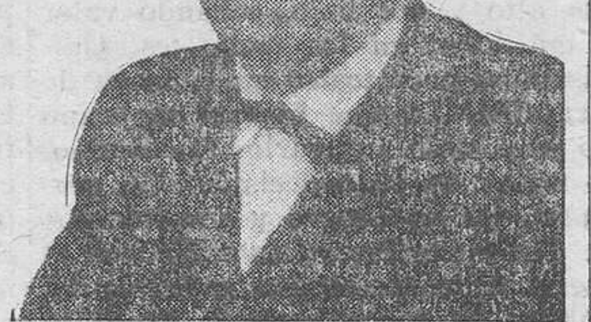
El diputado don Juan Sauret

Terminamos con estas palabras la conversación con el diputado por Lérida, cuya intervención en la discusión de la Ley electoral promete ser muy destacada.