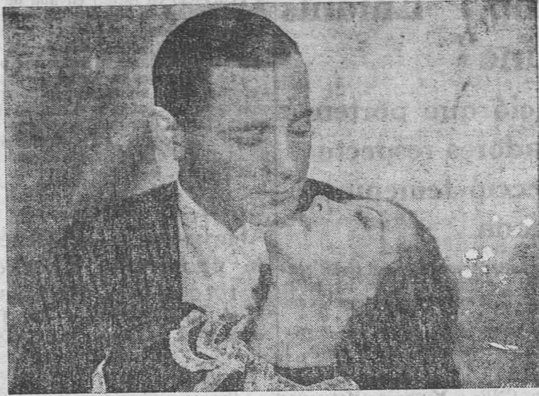
Sylvia Sidney i Herbert Marshall protagonistes del film Paramount IMPETUS DE JUVENTUD que avui s'estrena al Coliseum