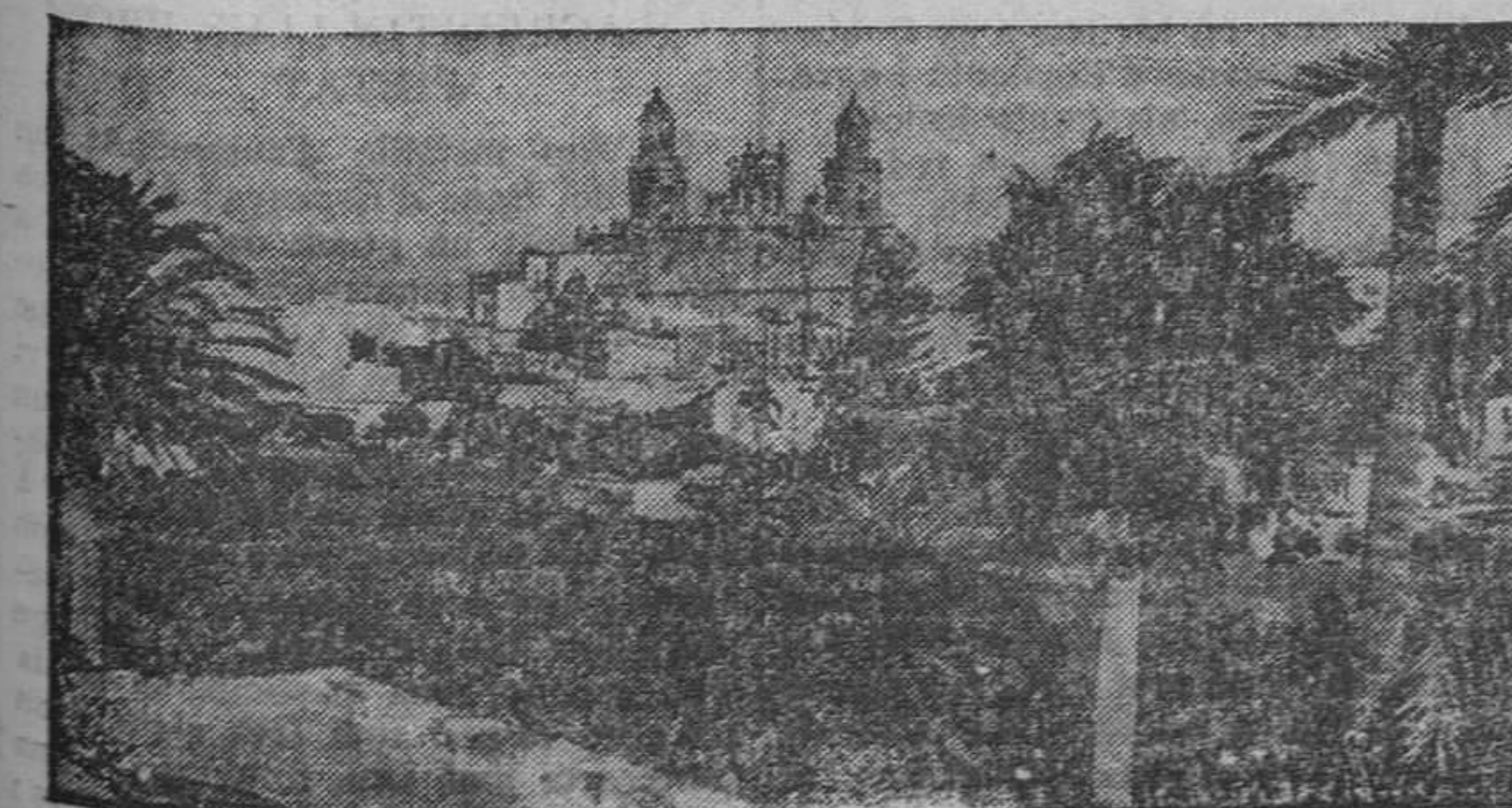
Un aspecte de Las Palmas

La ciutat — de quatre grans barris: Vegueta, Triana, Arenales i Port de la Llum — ocupa una extensió de 9 quilòmetres al llarg de la costa, recorreguts, sense parar, pels omnibus, tartanes i tramvies elèctrics que asseguren les comunicacions entre els extrems. La gran avinguda entre el port i la capital està rodejada d'hotels i jardins, i es troba prop de la Ciutat jardí. Les cases blanques de les barriades contrasten amb el verd dels platanars. Fora de la població, diversos pobles, anomenats «pagos» a Las Palmas, embelleixen el paisatge i donen mostres d'una vida agrícola en ple floriment.