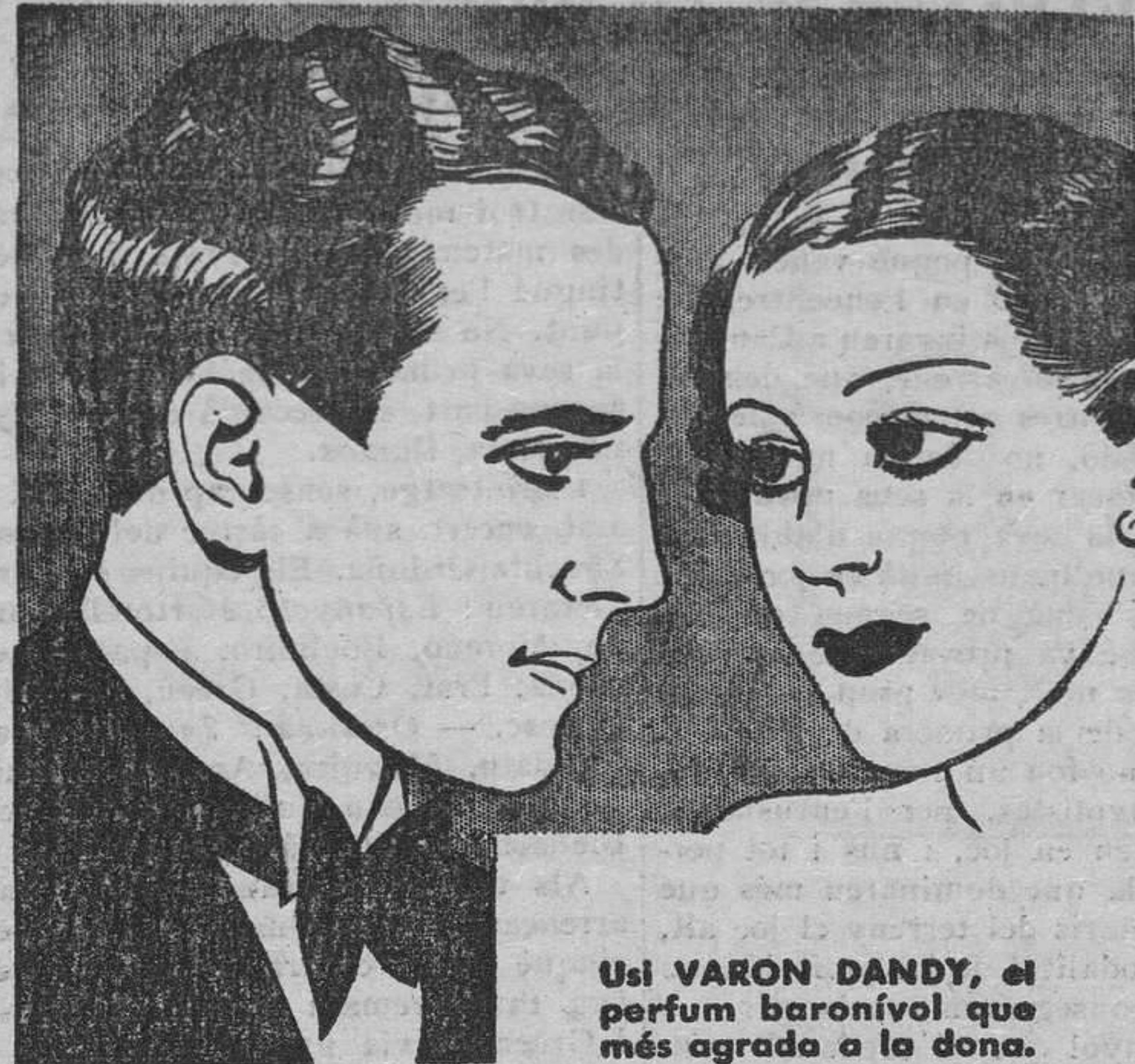
Usi VARON DANDY, el perfum baronival que més agrada a la dona.

Sant Andreu: Cruz, Sanz, Falguera, Parera, Torres, Castillo, Gómez, Pinyero, Roig, Vallibera i Ubeda.