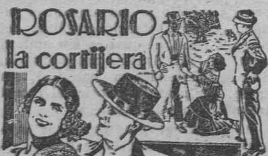
ROSARIO la cortijera Un film nacional que supera tot elogi