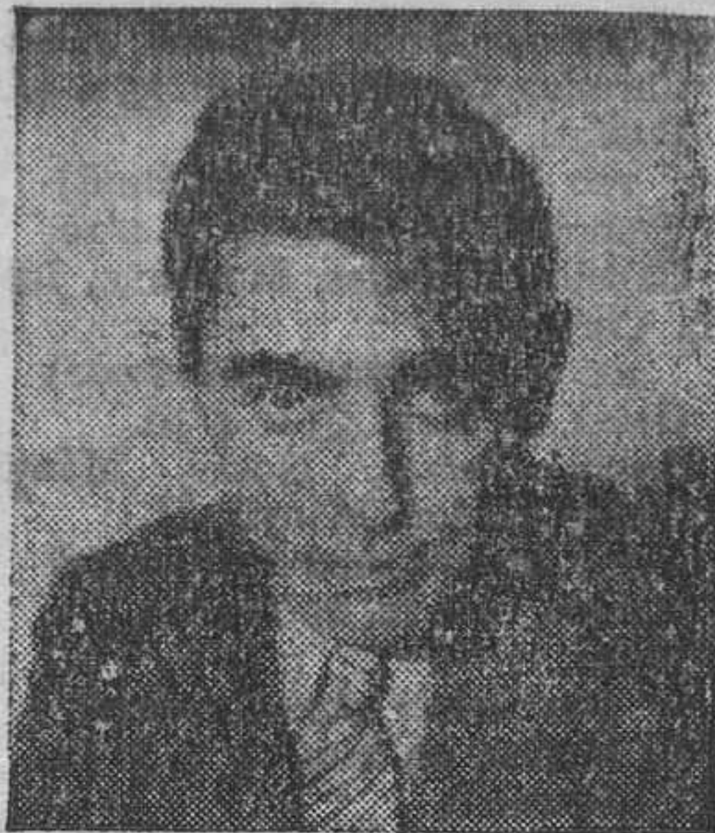
Eddie Cantor protagonista del film EL CHICO MILLONARIO , que aquesta nit s'estrena al Coliseum

A Capra se li diu el «creador de estrelles»; a Estrictament confidencial , Capra uneix de nou dues estrelles de gran cartell, Warner Baxter i Myrna Loy, i els dos triomfen plenament.