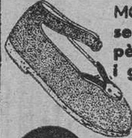
MODEL 24517 • Bobè drap pis crepè, en blau, vermell i verd Tamanys: 33 al 18.