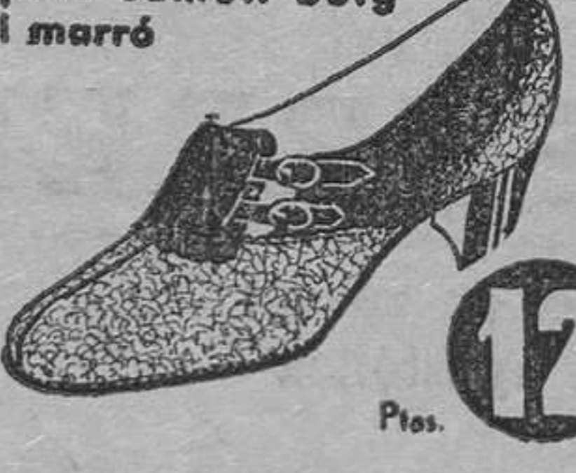
MODEL 7412/4 • Esport camell beig i marró