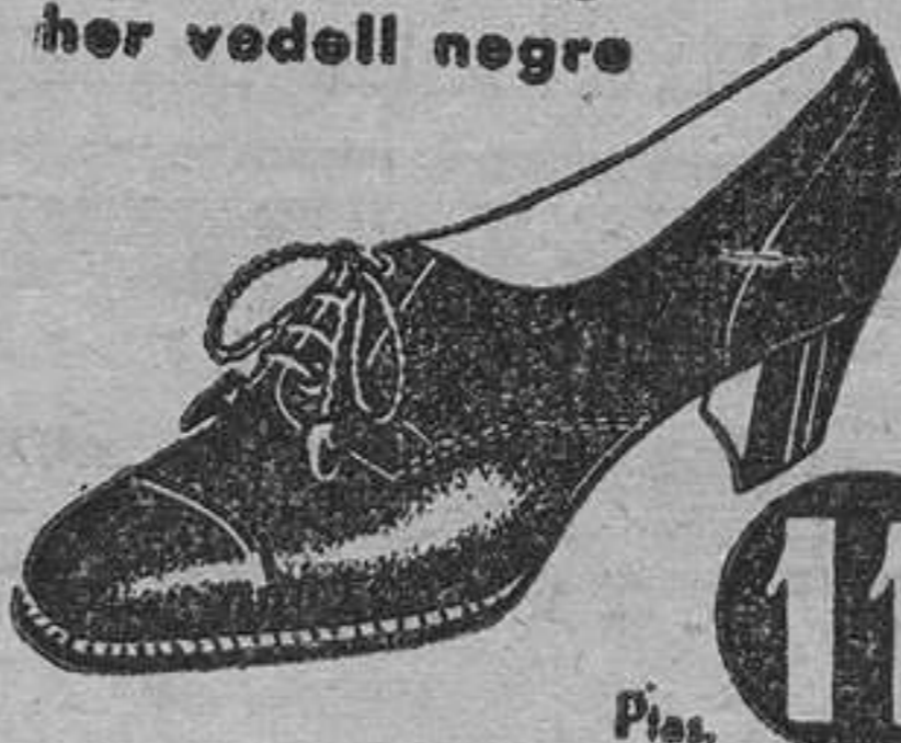
MODEL 6045/4 • Blucher vedell negre