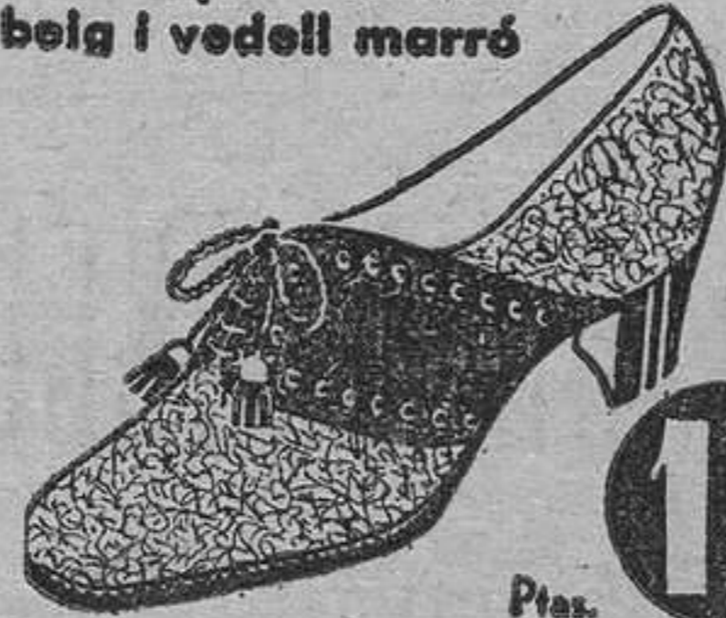
MODEL 7411/4 • Blucher esport camell beig i vedell marró