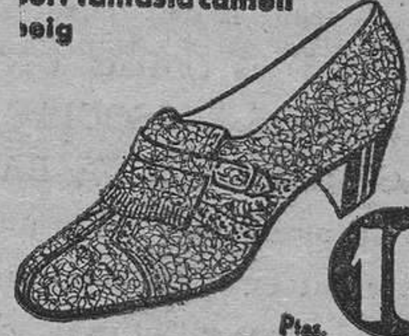
MODEL 7179/4 • Esport fantasia camell veig