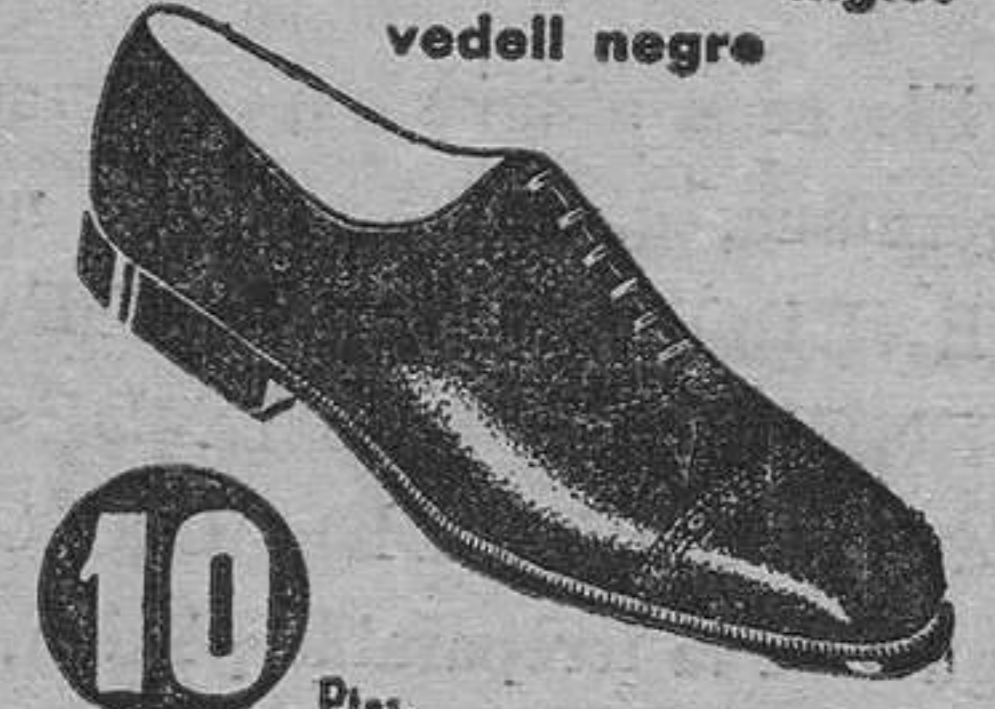
MODEL 114 • Anglès vedell negre