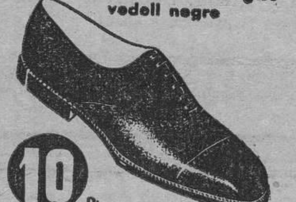
MODEL 110 • Anglès vedell negre