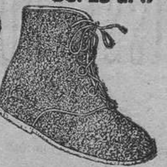
MODEL 24949 • Bors seguí drap pis crepè, en blau, vermell i gris. Tamanys: Del 26 al 17