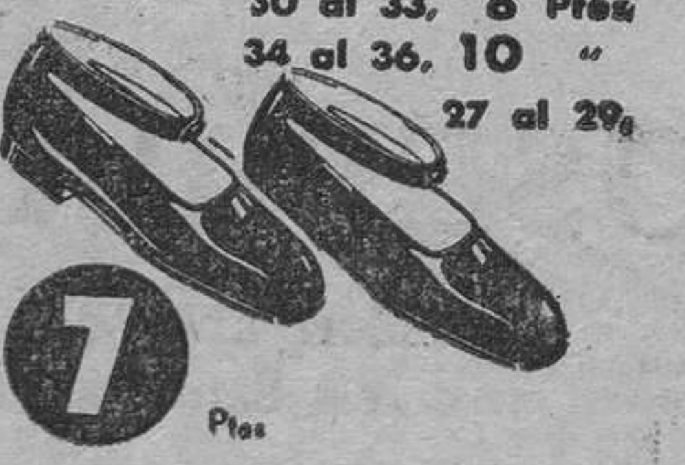
MODEL 17075 • Bobè de xarol negre Tamanys: 30 al 33, 8 Ptas. 34 al 36, 10 " 27 al 29.