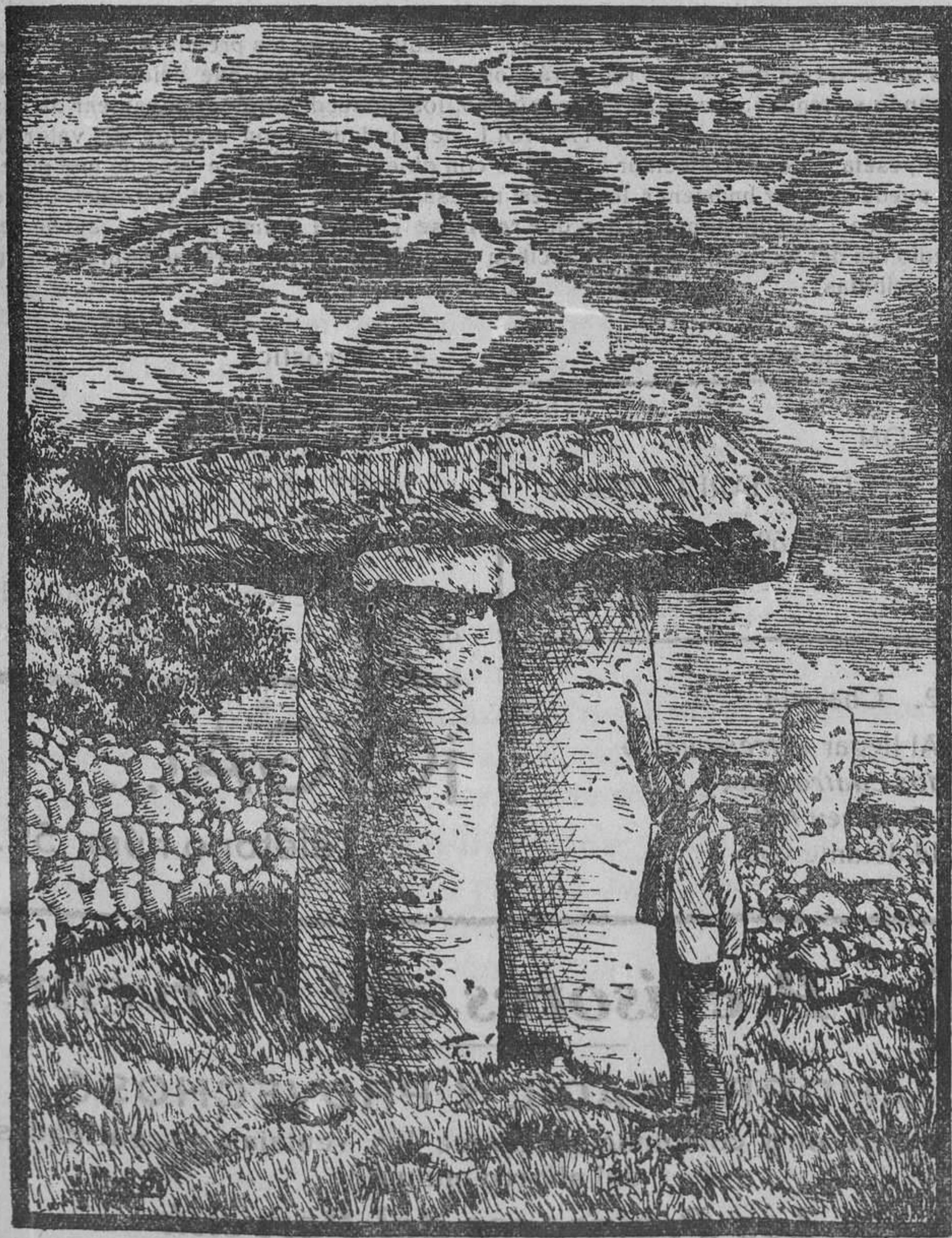
Taula de «Torre-Trancada»

Siendo la taula monumento de la cultura prehistórica mediterránea casi exclusivo de Menorca y por lo tanto sin término de comparación, ha dado lugar a que cada autor tenga diferente manera de interpretar en lo que se refiere a su destino. La teoría de que fueron monumentos de sacrificios y de