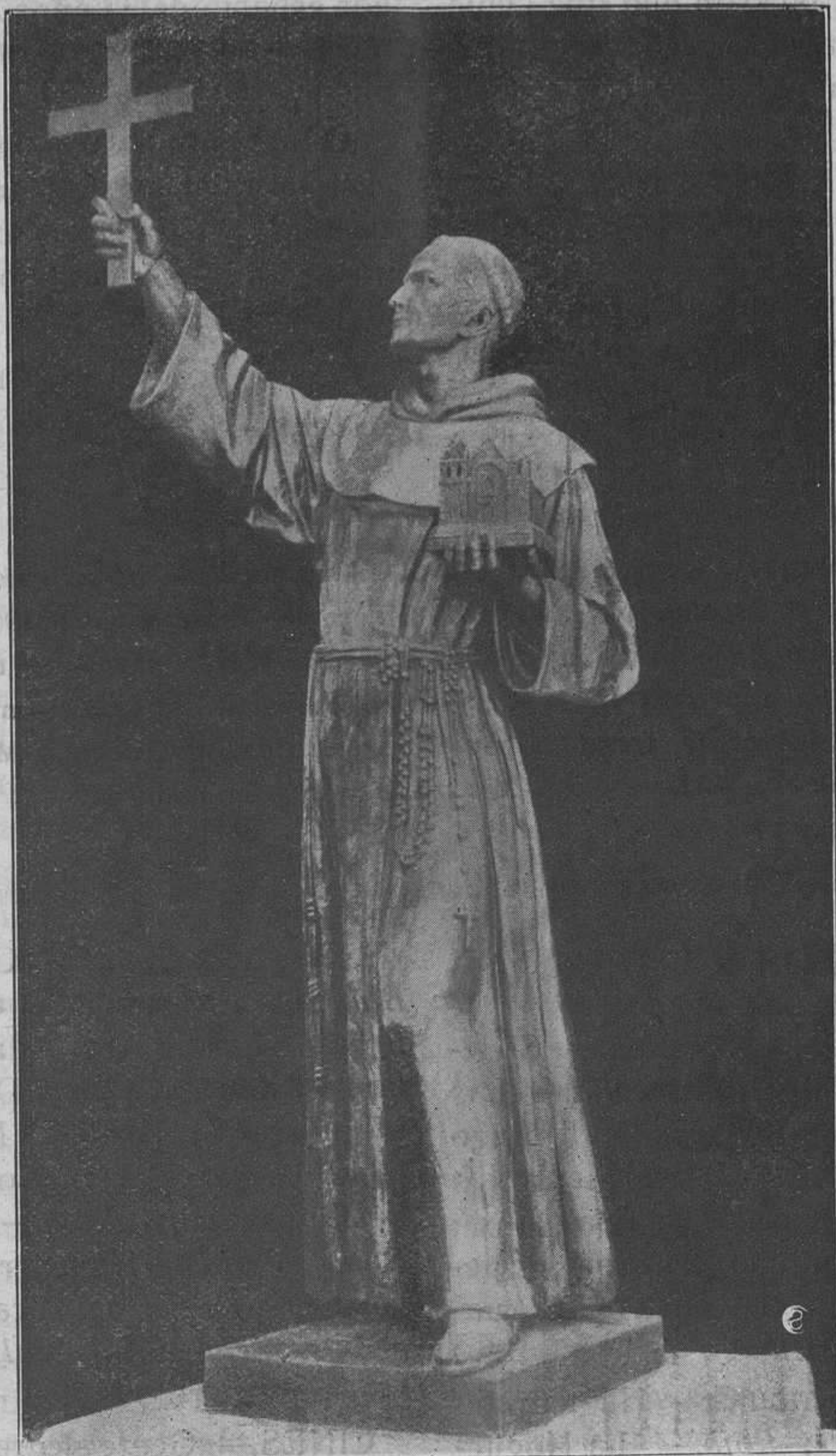
Fray Junípero Serra