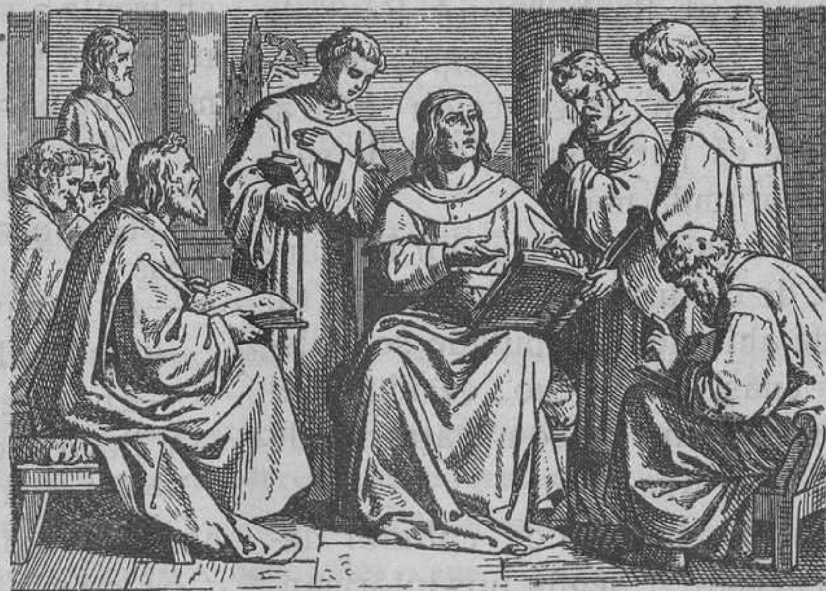
San Agustín, rodeado de sus discípulos

—¿Pero qué ha hecho usted conmigo camarada? ¿Me ha suspendido usted? ¿Y las recomendaciones a su benevolencia?