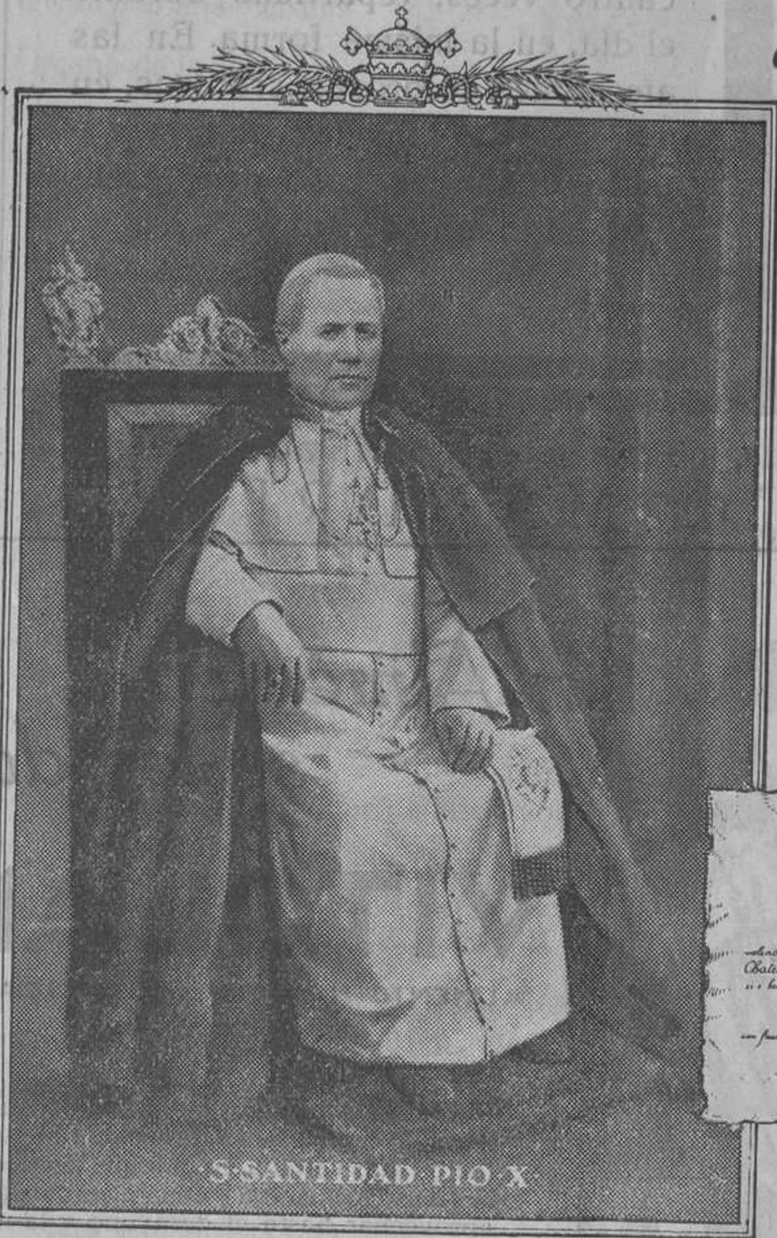
S.SANTIDAD PIO X