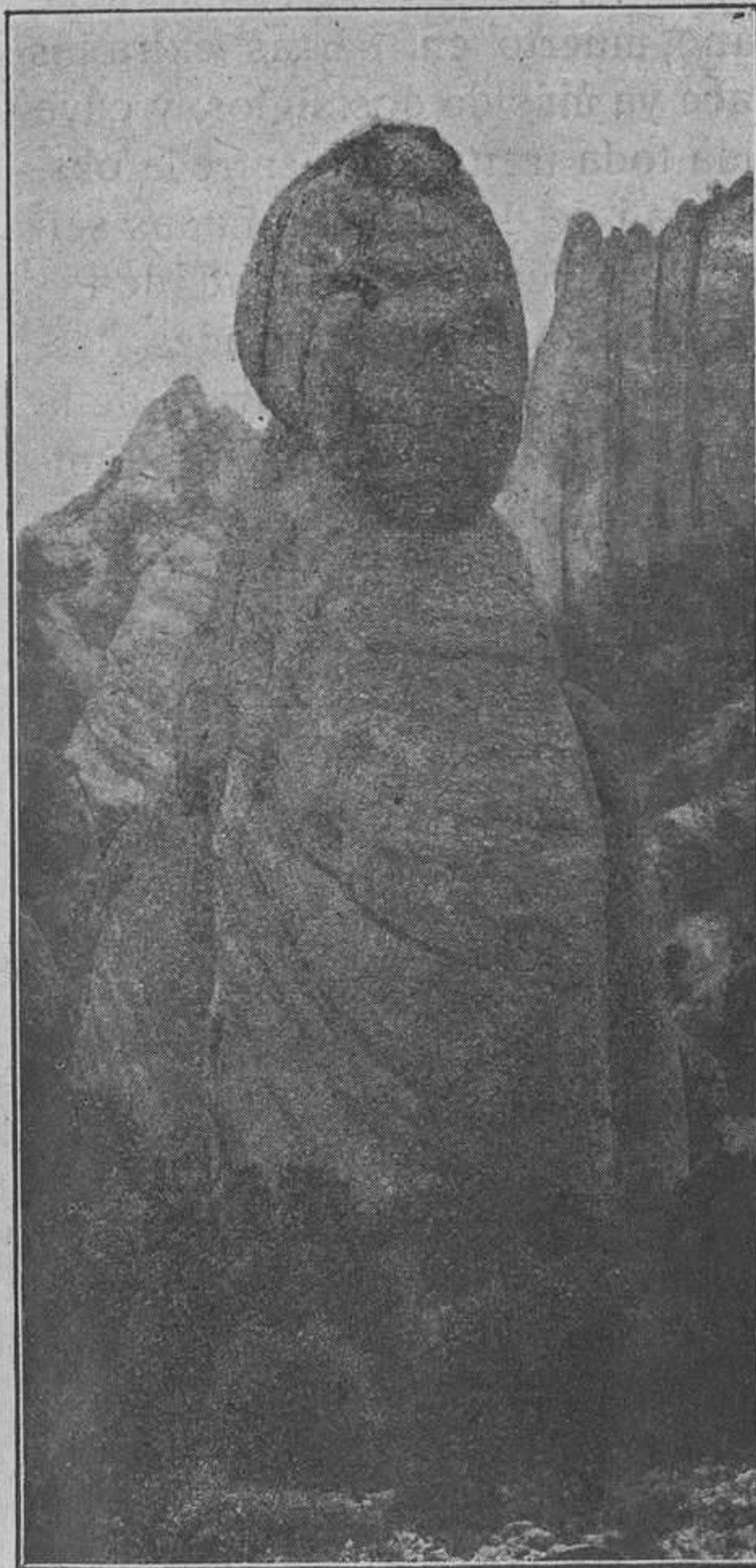
Gigante de piedra que puede admirarse en Montserrat

¡Qué bien van a venir esas 20.000 escuela (cuya aprobación ya ha pedido el Ministro de Instrucción) a los alumnos del Bachillerato que son diputados!