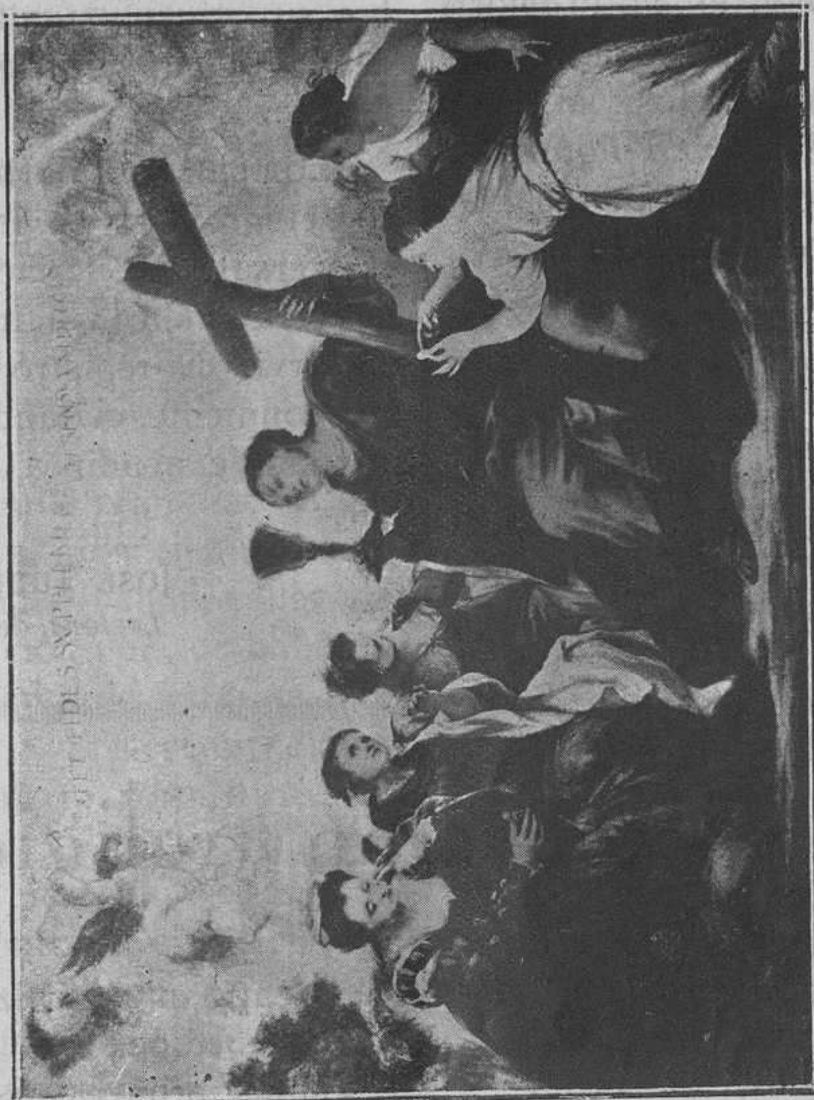
Triunfo de la Eucaristía sobre los cinco sentidos humanos.