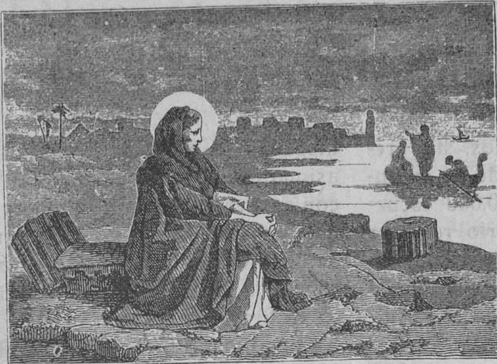
Santa Mónica ve con amargura a su hijo Agustín huir de ella en pos de los placeres y de la gloria mundana

definido todavía por los autores y tratadistas de la ciencia. Indefinida, equivale a falta de definición.