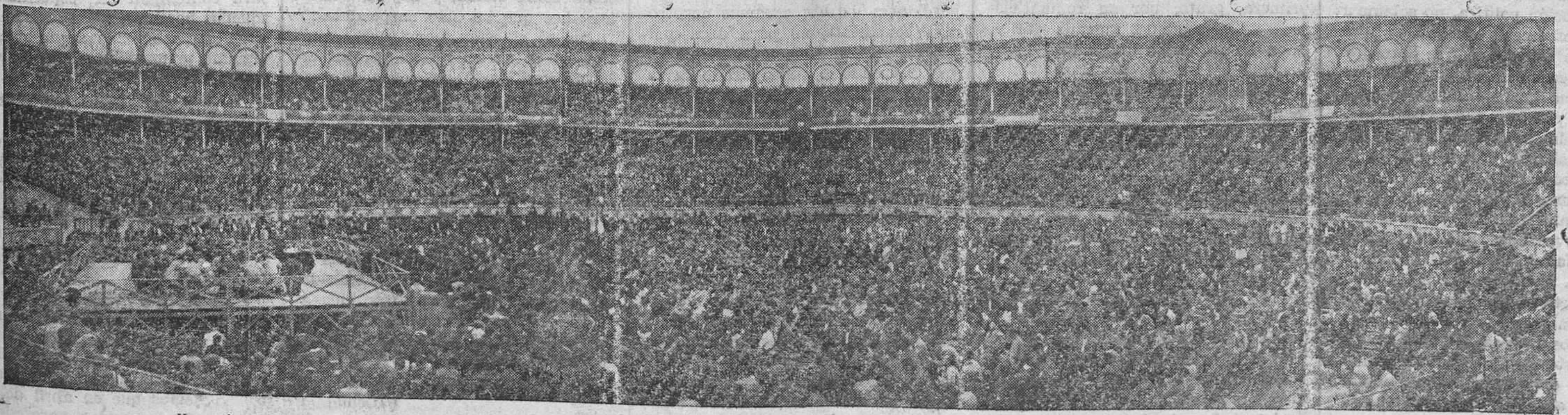
He aquí una vista de la Plaza de Toros durante el acto de afirmación socialista. ¡Qué gran diferencia con las fotografías de los mítines derechistas!