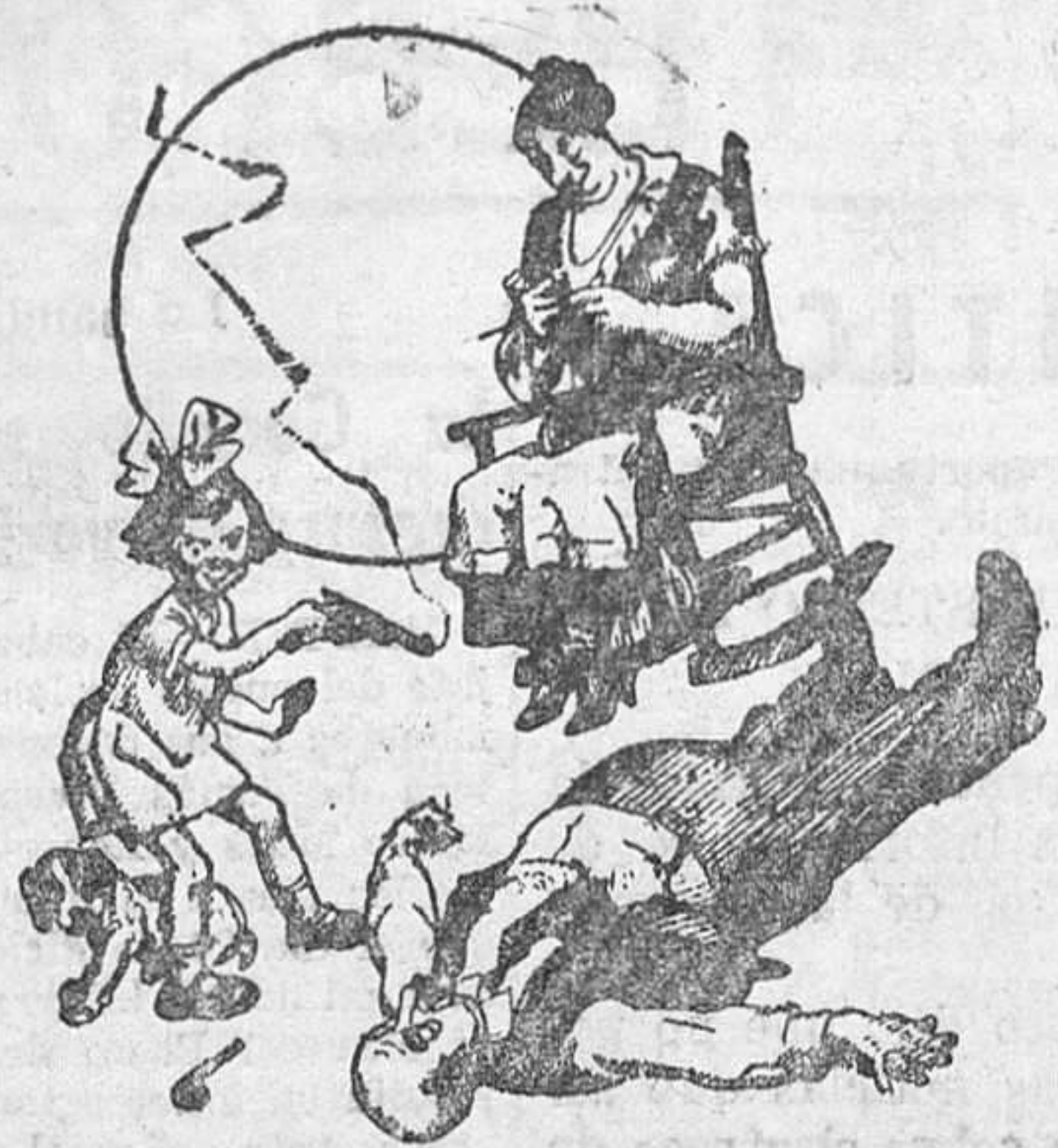
La deliciosa nena que ayuda a su mamá.