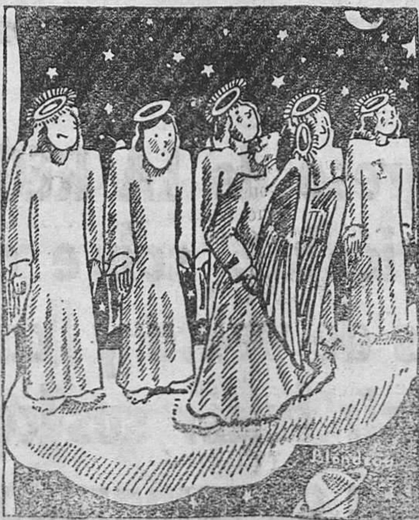
El angel bigadier. A restaos cuatro siglos por no haber limpado bien vuestros aureos

Gran Taller de Reparación de Calzado Burgos, 12 Santander.