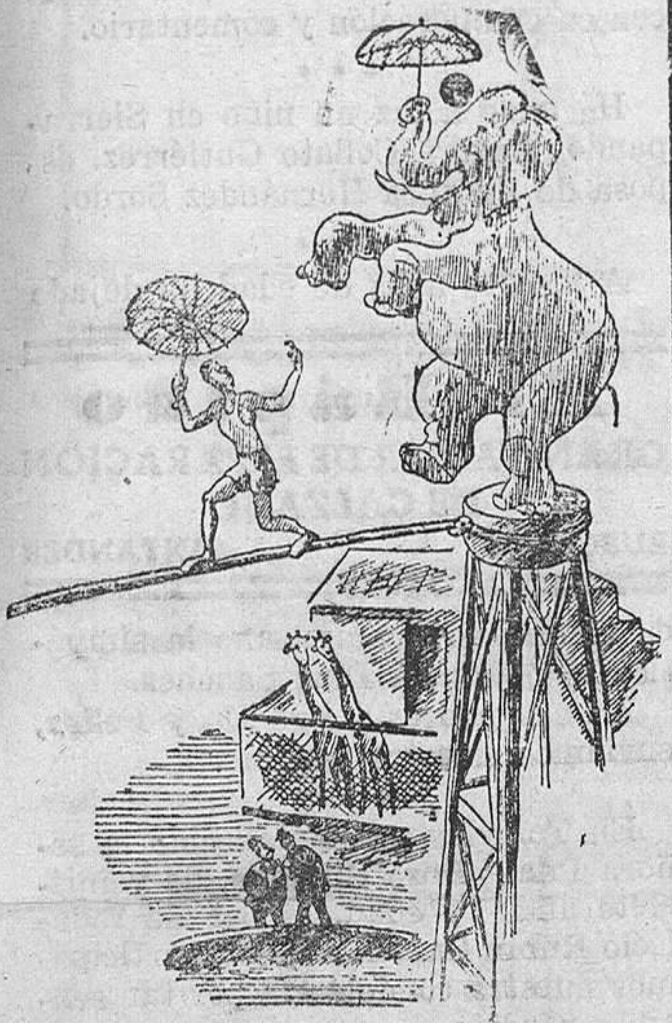
-Si esto se logra hacer, será una idea excelente...

Por ser los asuntos a tratar de suma importancia, se regea la asistencia de todos los socios.