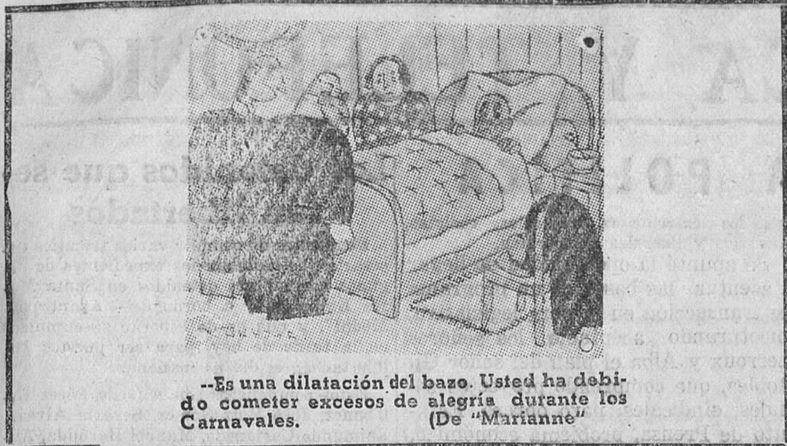
—Es una dilatación del bazo. Usted ha debido cometer excesos de alegría durante los Carnavales. (De "Marianne")