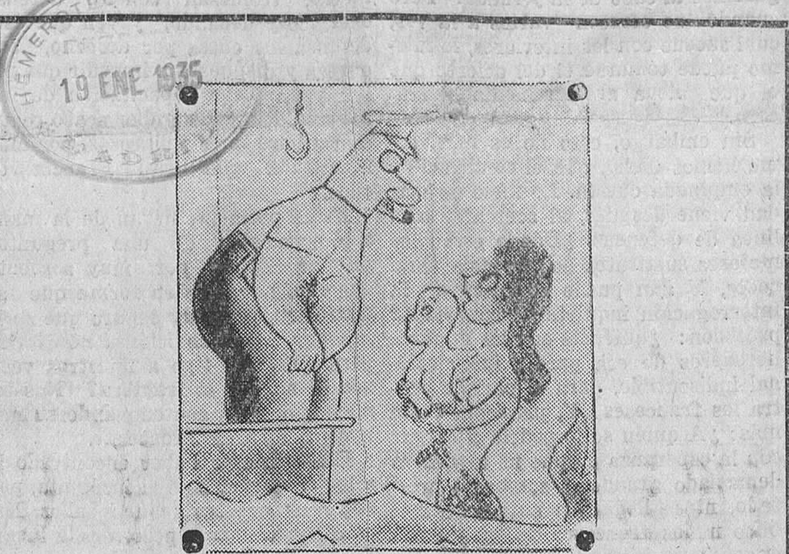
En busca de la paternidad. --La sirena: Hay aquí un buzo que se llama Schultz? (De "New-Yorker")

Con esta fiesta poética que organiza el Ateneo Popular de Santander, la Sección de Literatura del mismo comienza un ciclo que, como decíamos al principio de esta nota, constará de grandes actos literarios, conferencias, recitales de versos, ensayos sobre literatura española y concursos para escritores noveles.