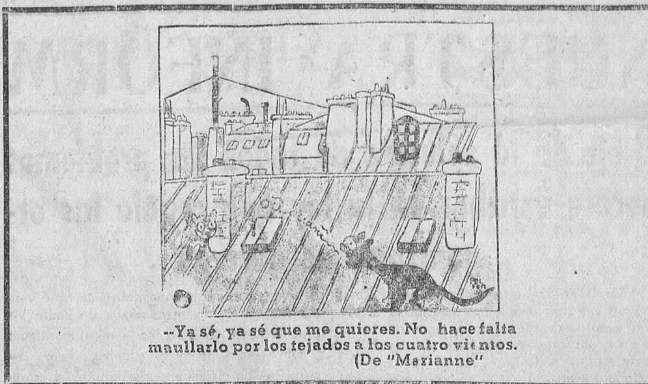
—Ya sé, ya sé que me quieres. No hace falta maullarlo por los tejados a los cuatro vientos. (De "Marianne")

Noviembre de 1934 En el mes de noviembre último, la Caja Nacional de Seguro de Accidentes del Trabajo ha recibido 169 notificaciones de accidentes, correspondiendo 55 a accidentes mortales y 114 a accidentes que han producido incapacidades permanentes para el trabajo. De los accidentes referidos corresponde: a patronos no asegurados; 72 a patronos asegurados en la Caja Nacional; 50 a asegurados en Mutualidades, y 41 a asegurados en Compañías mercantiles. Las víctimas de accidentes fueron todas españolas. Los expedientes resueltos positivamente fueron 170. De ellos 57 de muerte, importando los capitales pesetas 907.872,46. Las incapacidades permanentes parciales resueltas durante noviembre fueron 79, con un importe de 547.340,02 pesetas; las permanentes totales para la profesión, 25, con un importe de 425.802,46 pesetas, y las permanentes absolutas para todo trabajo 9, con un importe de 221.487,78 pesetas. El importe total de las rentas anuales constituidas hasta la fecha, asciende a 1.533.565,51 pesetas. El promedio anual de coste de las rentas para los derechohabientes de fallecidos es de 15.154,94 pesetas. La de mayor coste ascendió a 64.161,28 pesetas, y la de menor coste a pesetas 217,30. Por indemnizaciones de sepelio se han satisfecho 20.550,60 pesetas. En las rentas por incapacidad permanente, los promedios son: permanente parcial, 10.763,90 pesetas; permanente total, 17.125,25 pesetas y permanente absoluta, 23.435,75 pesetas.