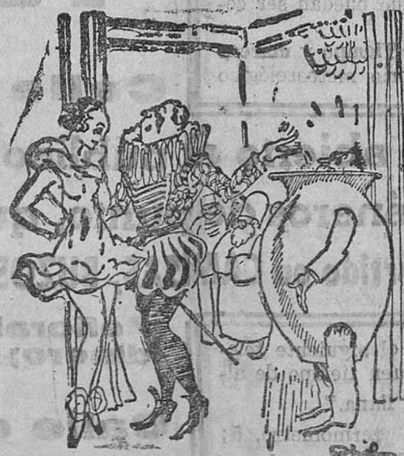
CARNIVAL —Le vuelvo a repetir, señor, que no soy un cenicero, sino un invitado. (De «Gringoirs»)