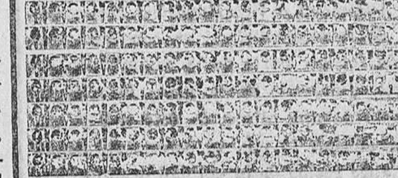
Esto es, sin duda, una consecuencia de la bancarrota comercial, económica y financiera en que se debate un mundo decadente.

MIRADOR Sería menester una sensibilidad de pedernal para pasar desapercibidos casos y cosas que nos presenta a diario una sociedad mal organizada.