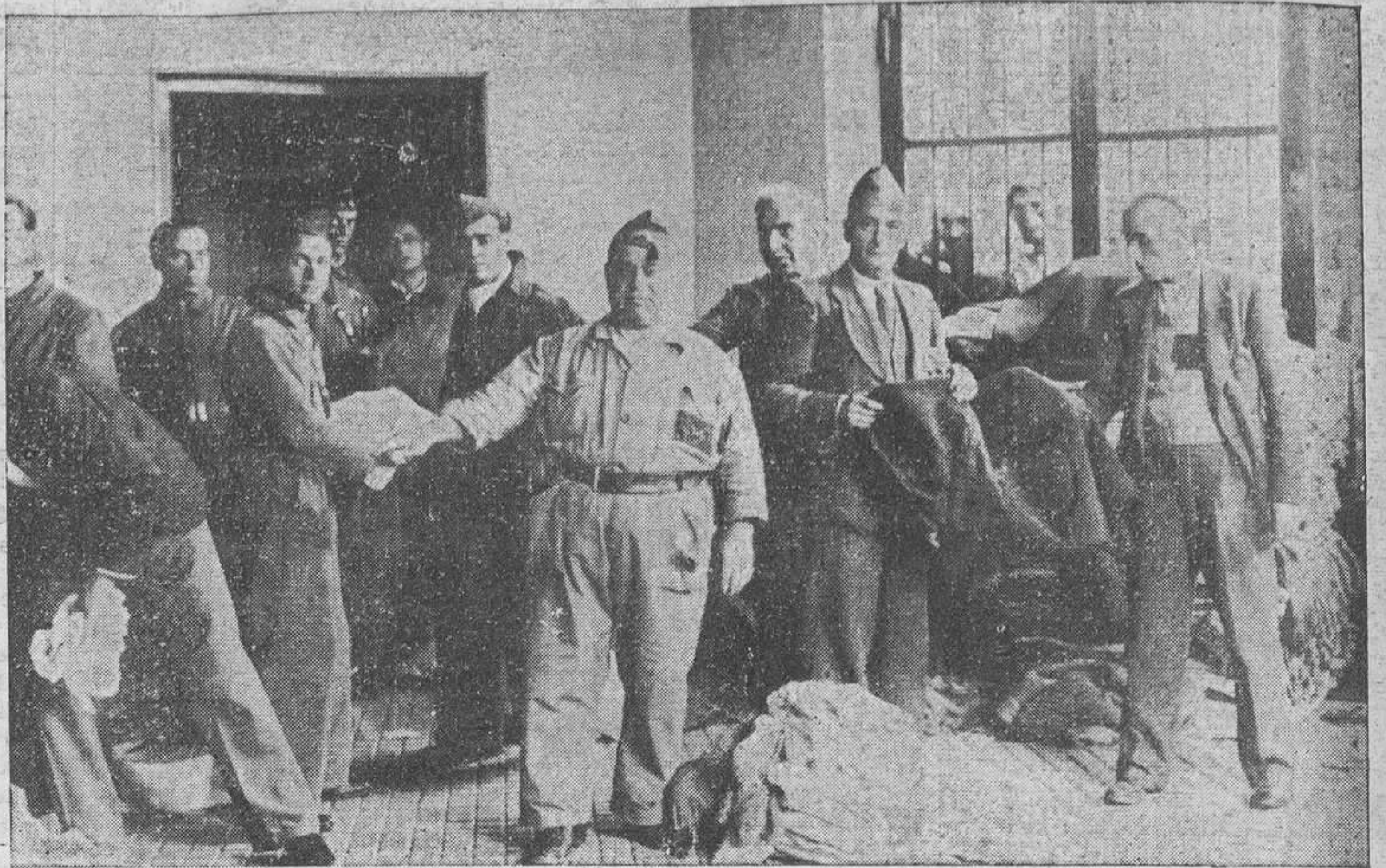
Una legión de milicianos afanosos se ocupa del reparto y clasificación de las prendas que han de ser alivio de los luchadores en los crudos días y en las inacabables noches invernales.

También facilita prendas de abrigo a los niños y a las pobres mujeres que tienen frío