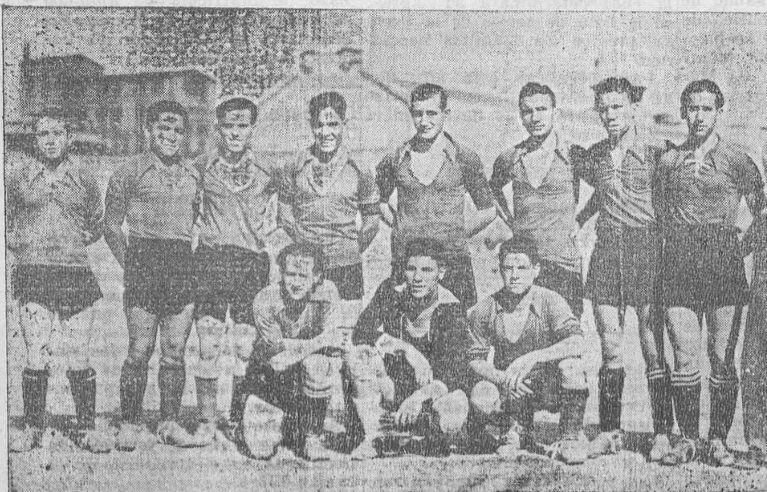
El equipo de la Peña Amparo que tomó parte en el festival deportivo celebrado ayer a beneficio de la Agrupación Profesional de Periodistas.

ALCALA DE HENARES. —Amistosamente han contendido el Madrid y el Alcalá de Henares. El encuentro fué de dominio abrumador de los madrileños, que triunfaron por diez tantos a dos de sus contrarios.