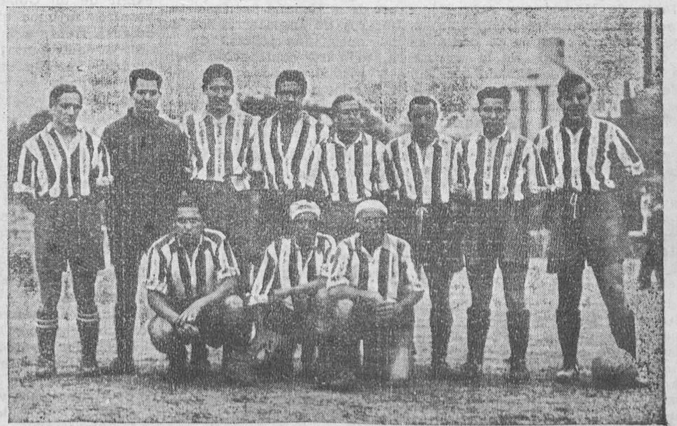
El equipo del Athlétic que tomó parte en el festival deportivo celebrado ayer a beneficio de la Agrupación Profesional de Periodistas.