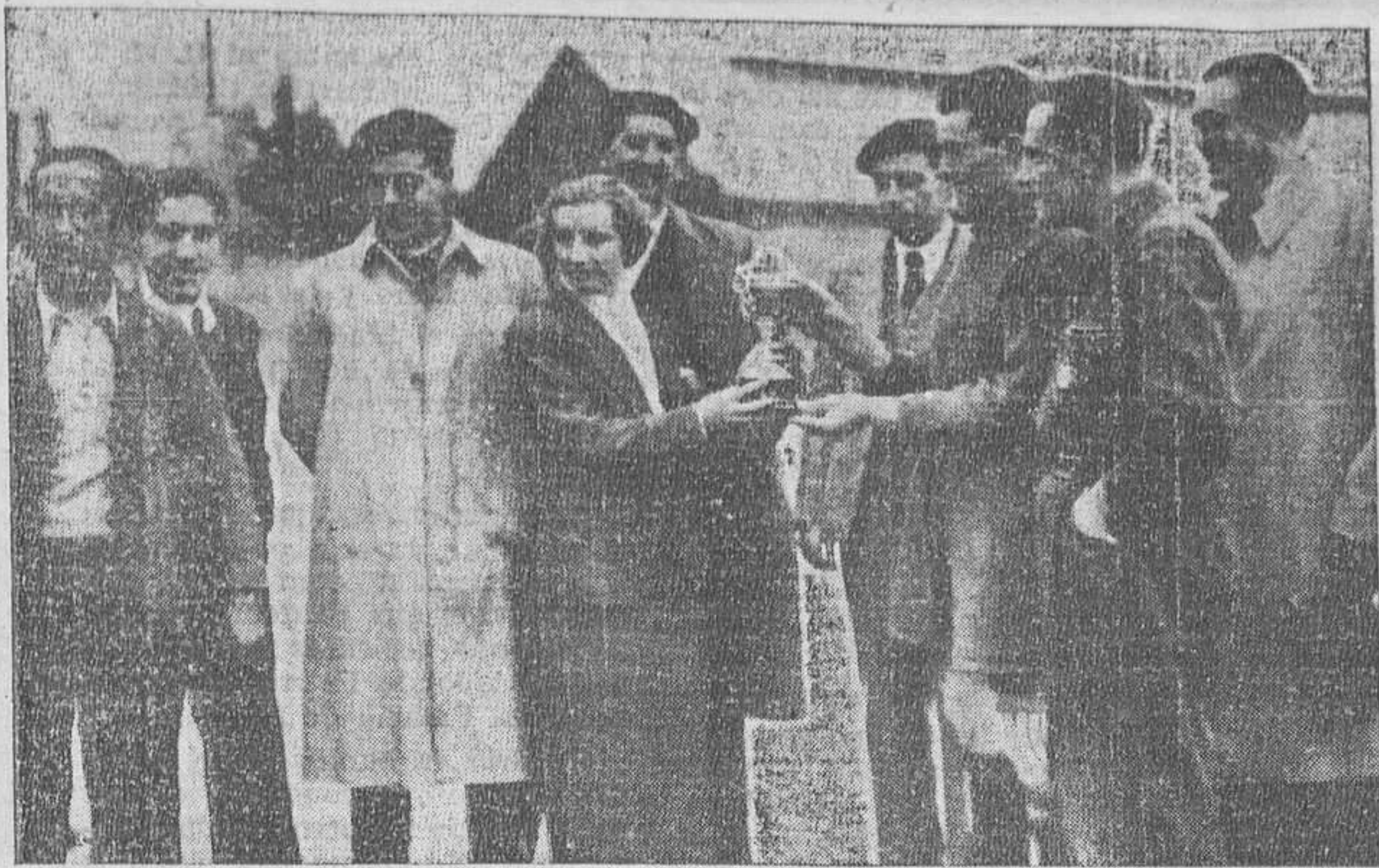
Entrega del trofeo al equipo del Athlétic, vencedor en el partido jugado ayer a beneficio de la Agrupación Profesional de Periodistas