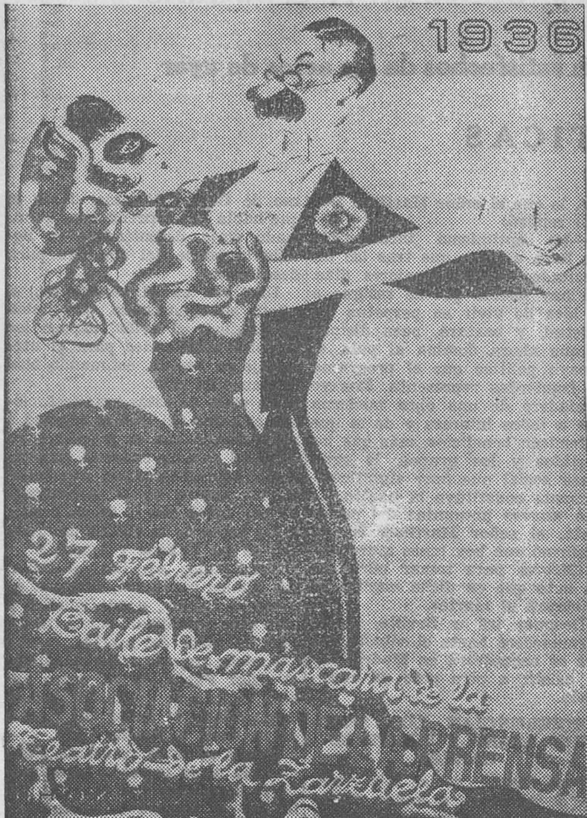
Cartel anunciador del baile de máscaras de la Asociación de la Prensa, notabilísima obra pictórica del ilustre artista D'Hoy.

Además del estupendo coche "D. K. W.", se rifarán un magnífico despacho, de Federico Gallar; un precioso estuche tocador, de D. García; mantones de Manila, de los Almacenes San José y de Núñez; preciosa capa bordada, de Seseña (Hijo); un smoking, de la sastrería Santiago; mantas de la fábrica de García Carrera, de Antequera; objetos de arte de Gabino Sánchez, de Valladolid; vinos y licores de las mejores marcas y multitud de regalos que se van recibiendo