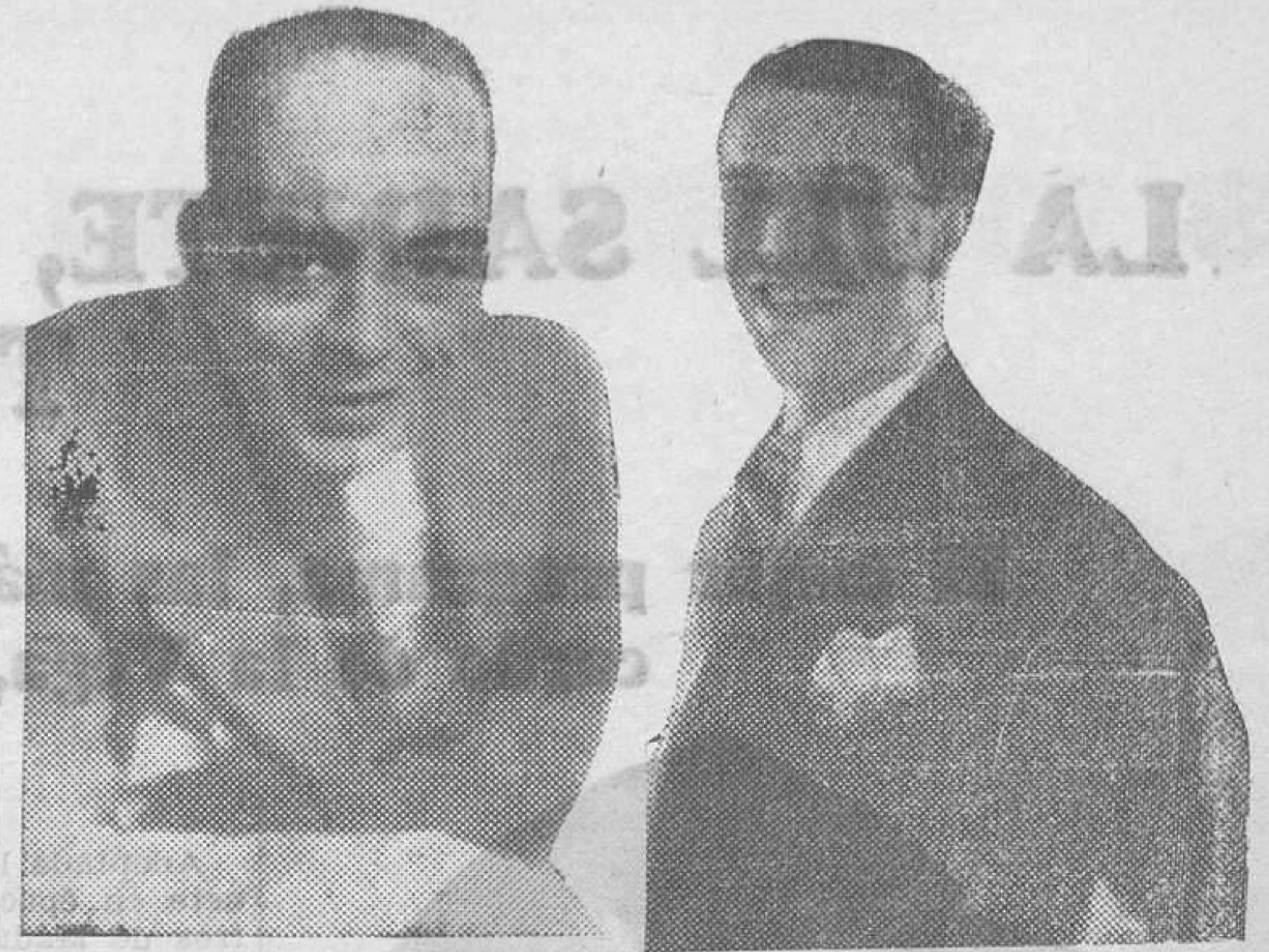
LEPE Y ALADY

La primera lectura se dará hoy lunes, con una obra del insigne maestro don Miguel de Unamuno, quien rinde este honor a Lyceum. Lleva por título "Raquel encadenada", comedia en tres actos y en prosa.