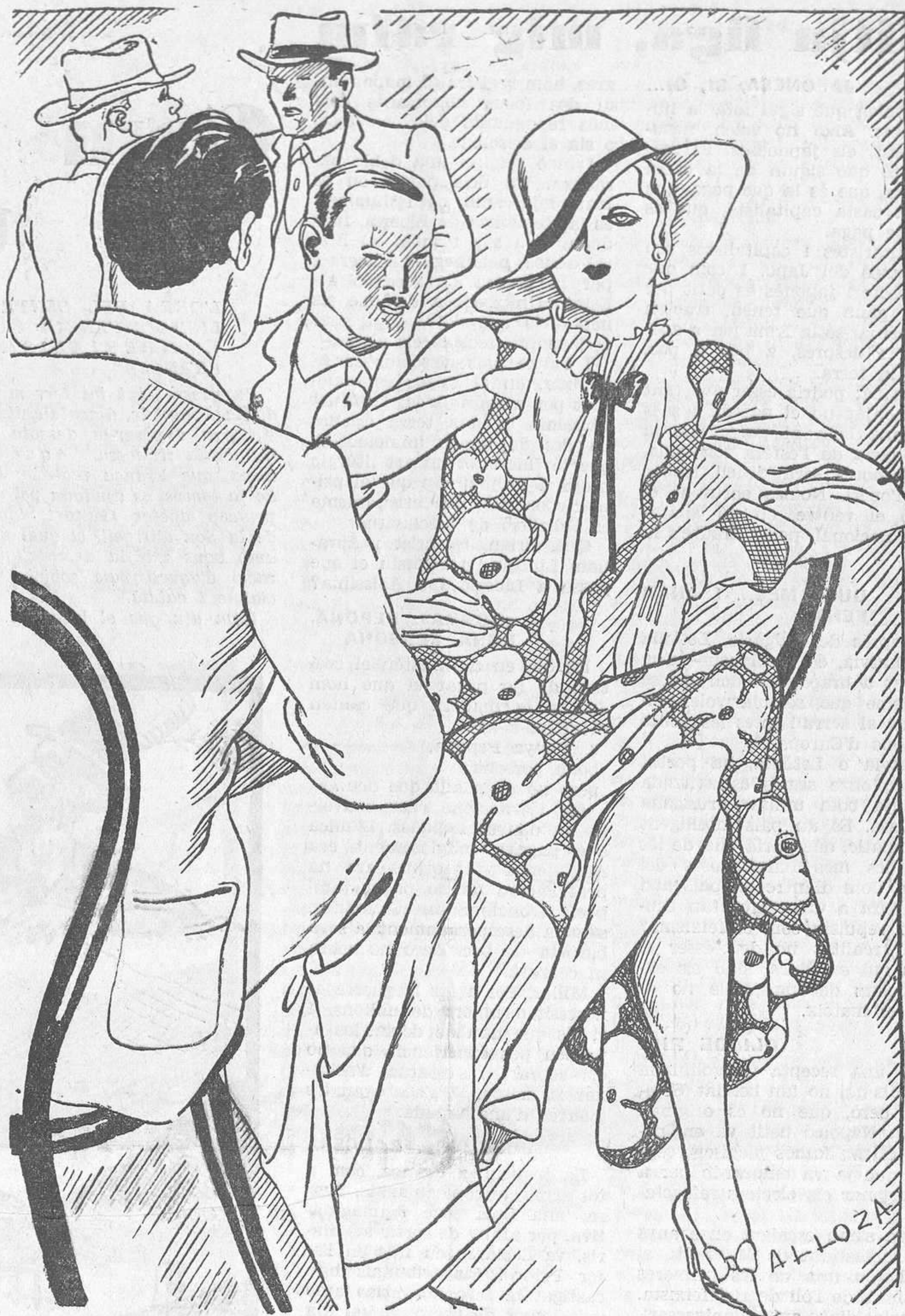
—Home! Es curiós, això! Vostè és diputat radical? I com és que no va al Congrés? —No cal. Ja hi van els de Gil Robles!

En aquestes hores greus, la responsabilitat és de tots.