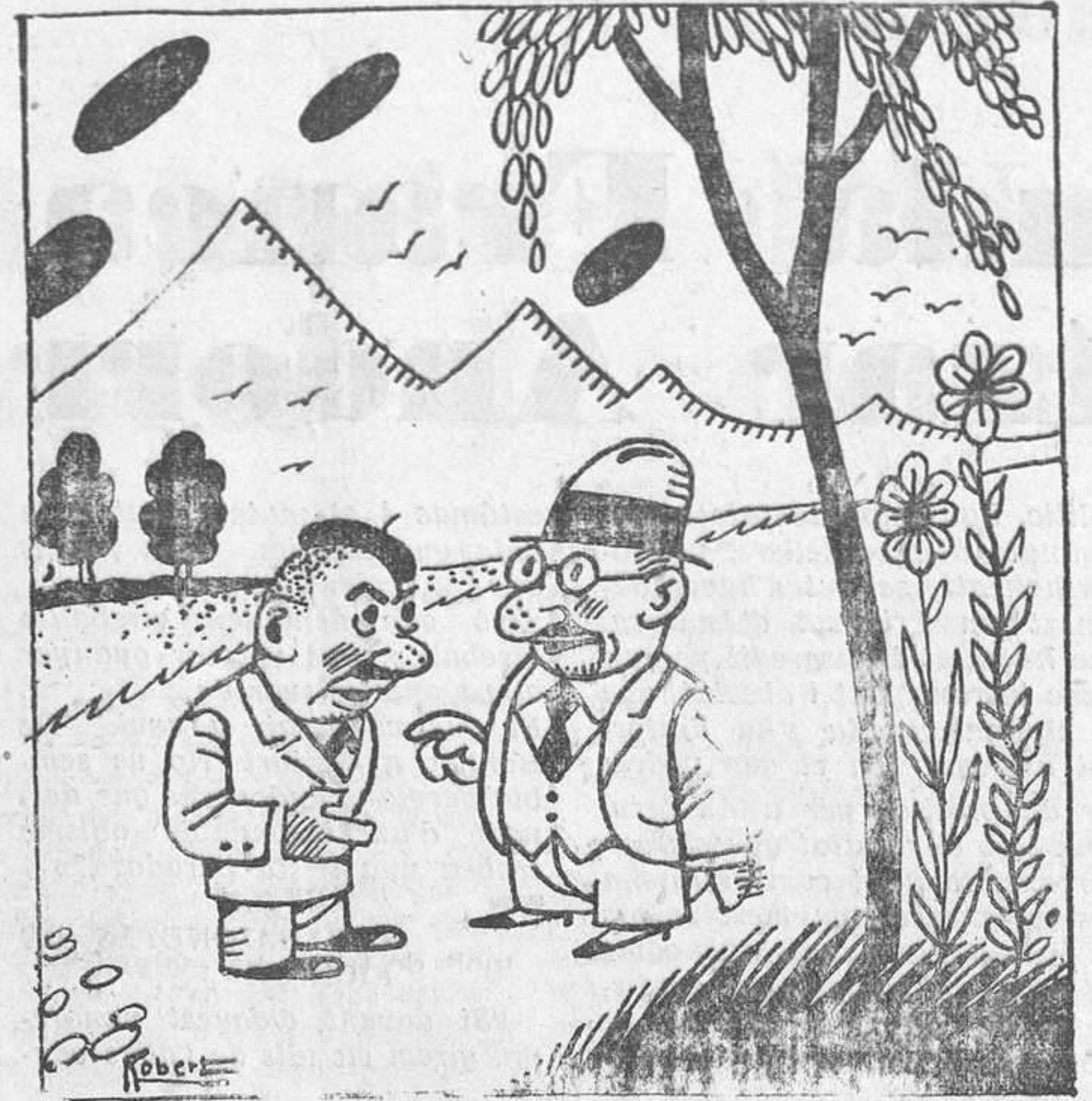
— Pobres xicots! I tot ha estat obra del «fascio». — Digueu millor del «desfascio».