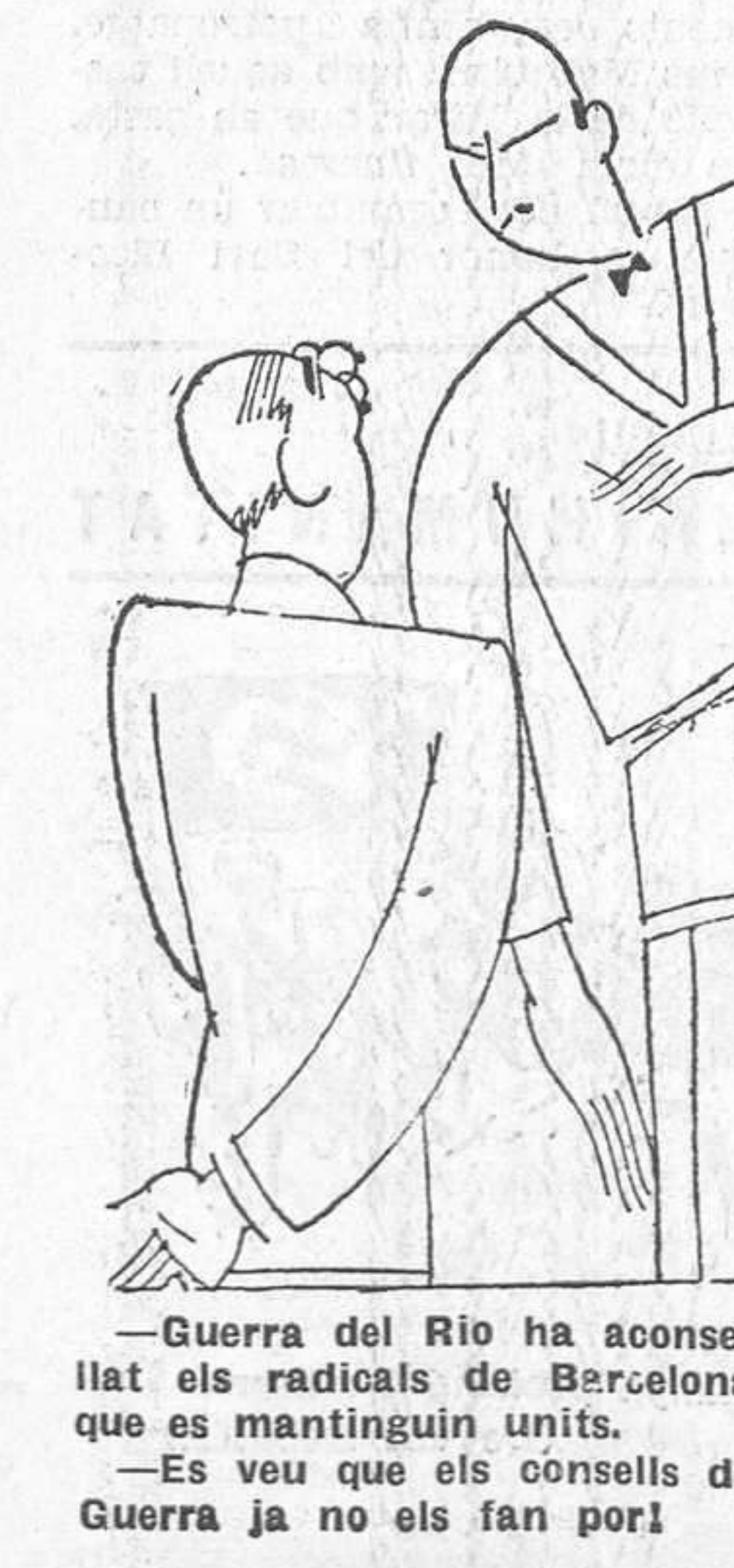
—Guerra del Rio ha aconsellat els radicals de Barcelona que es mantinguin units. —Es veu que els consells de Guerra ja no els fan por!