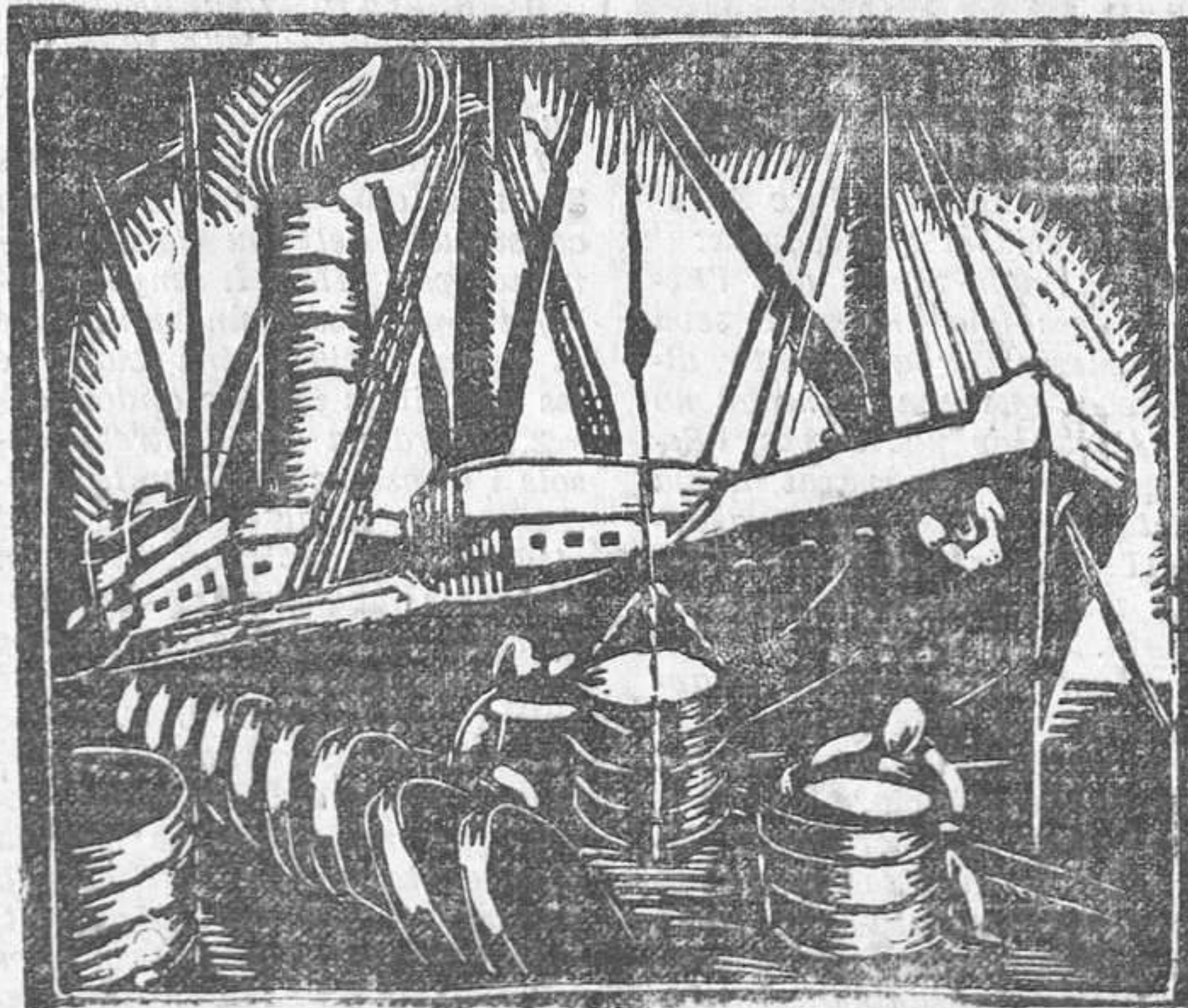
— Veritablement, hi ha feines molt pesades. — Això dels vaixells és cosa que carrega molt!

En alguna cosa s'ha de conèixer la diferència.