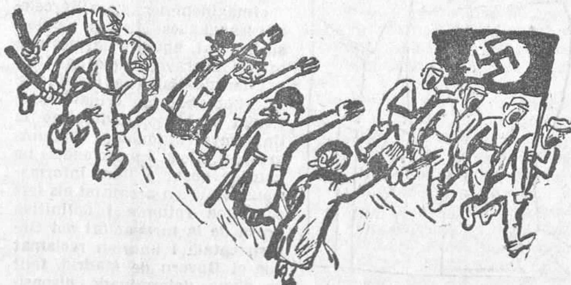
«L'entusiasme nazi és a Alemanya profund i sincer.» (De «El Debate».)