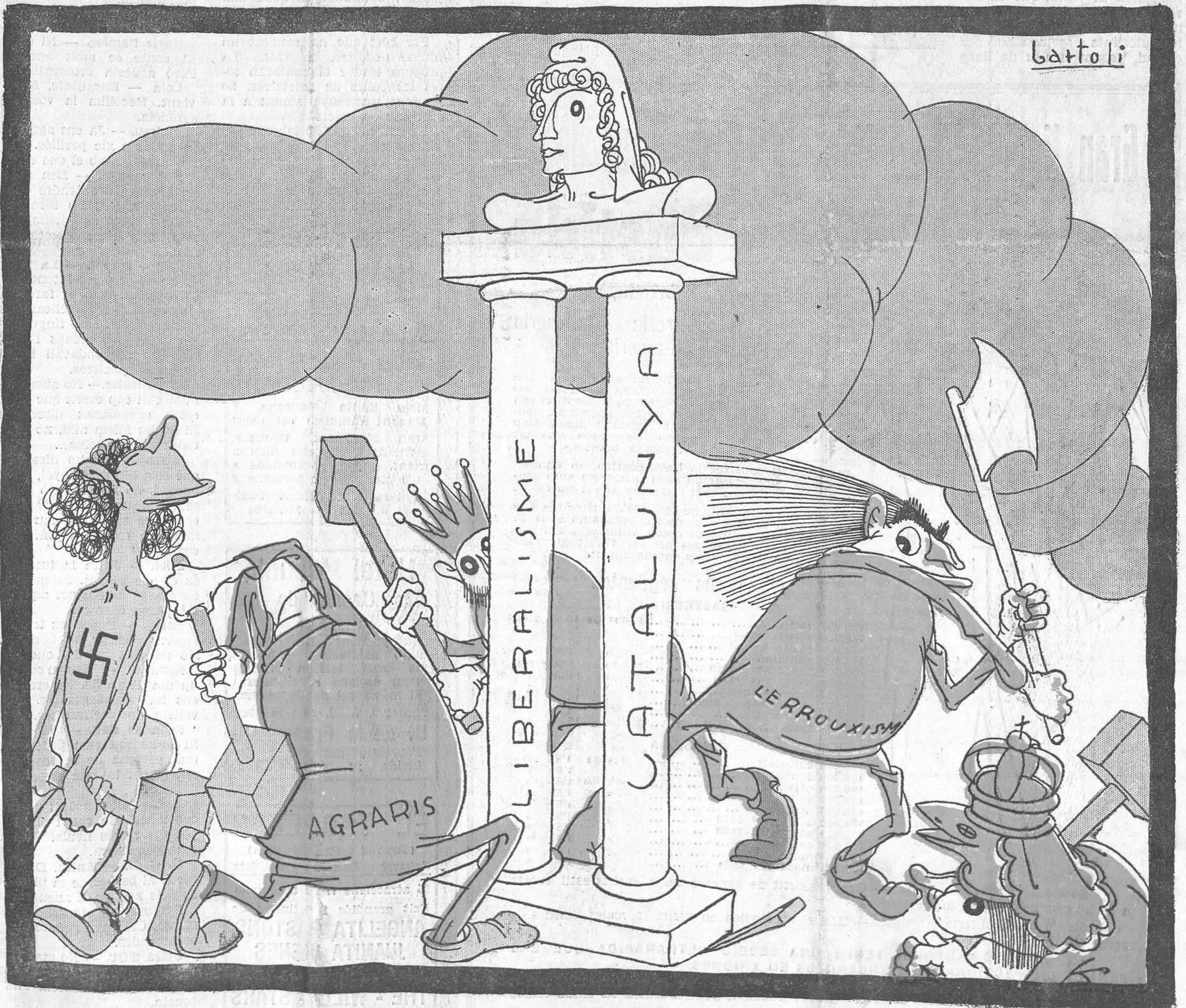
Els cops van adreçats a les columnes, per tal de fer caure el que sostenen...