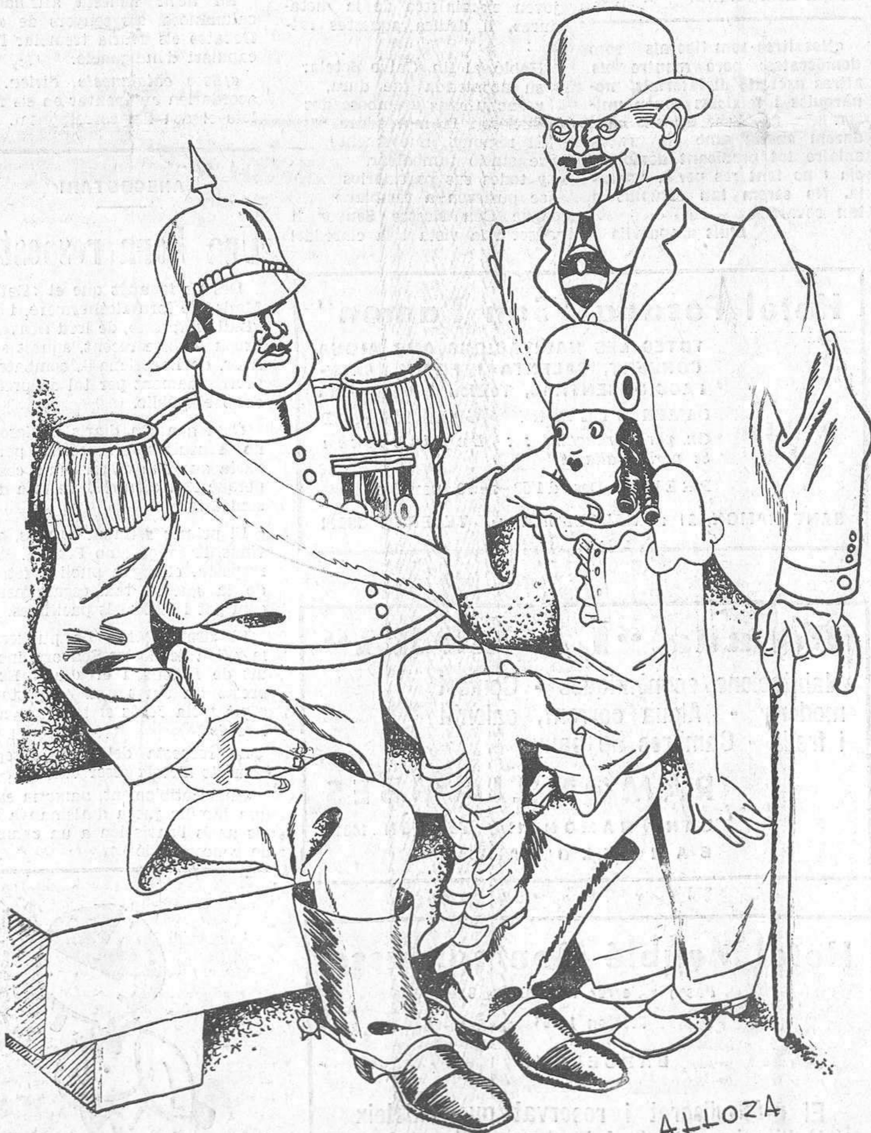
— Sembla que a la fi podem tornar. Costa de creure!