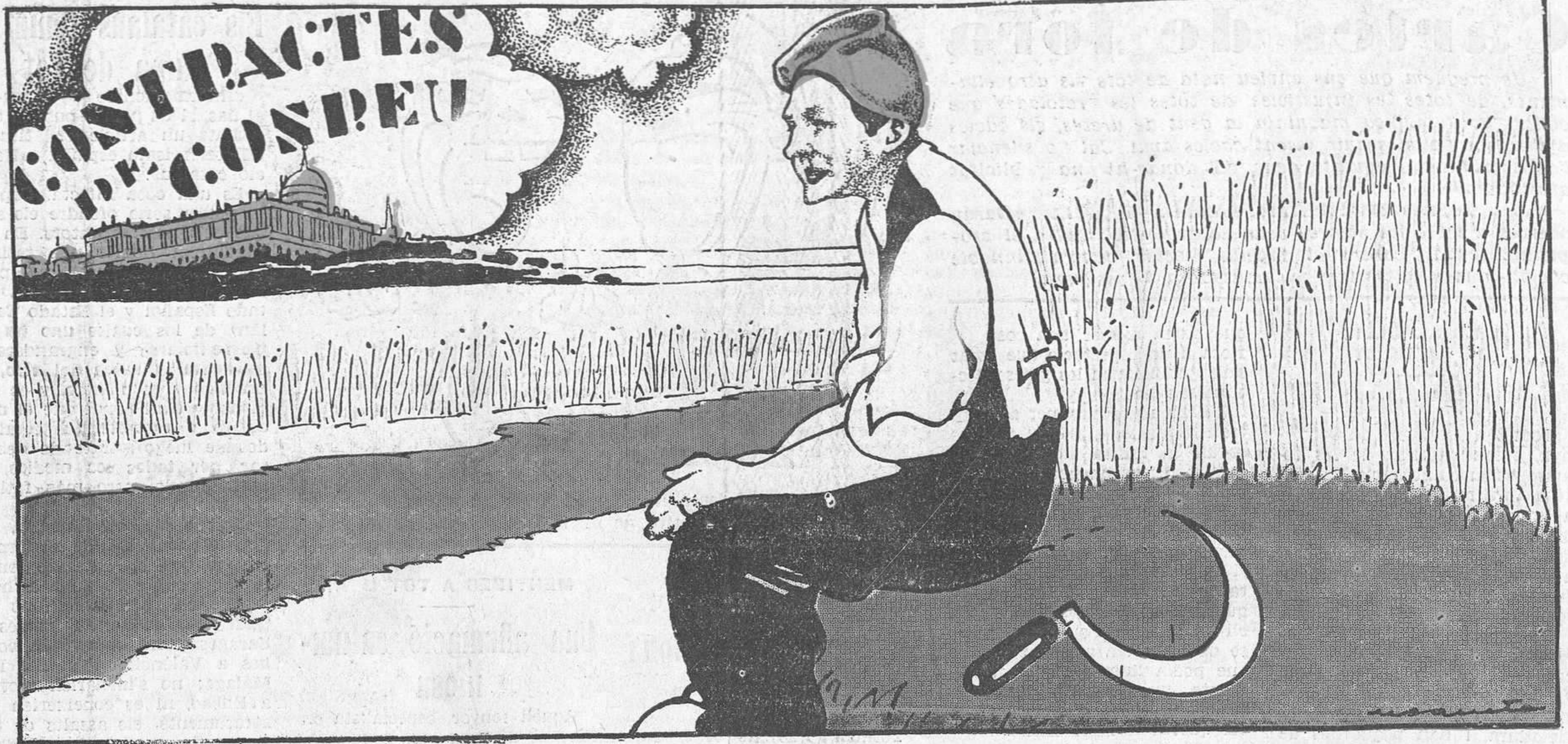
— Amb la falç al puny, ben esmolada!