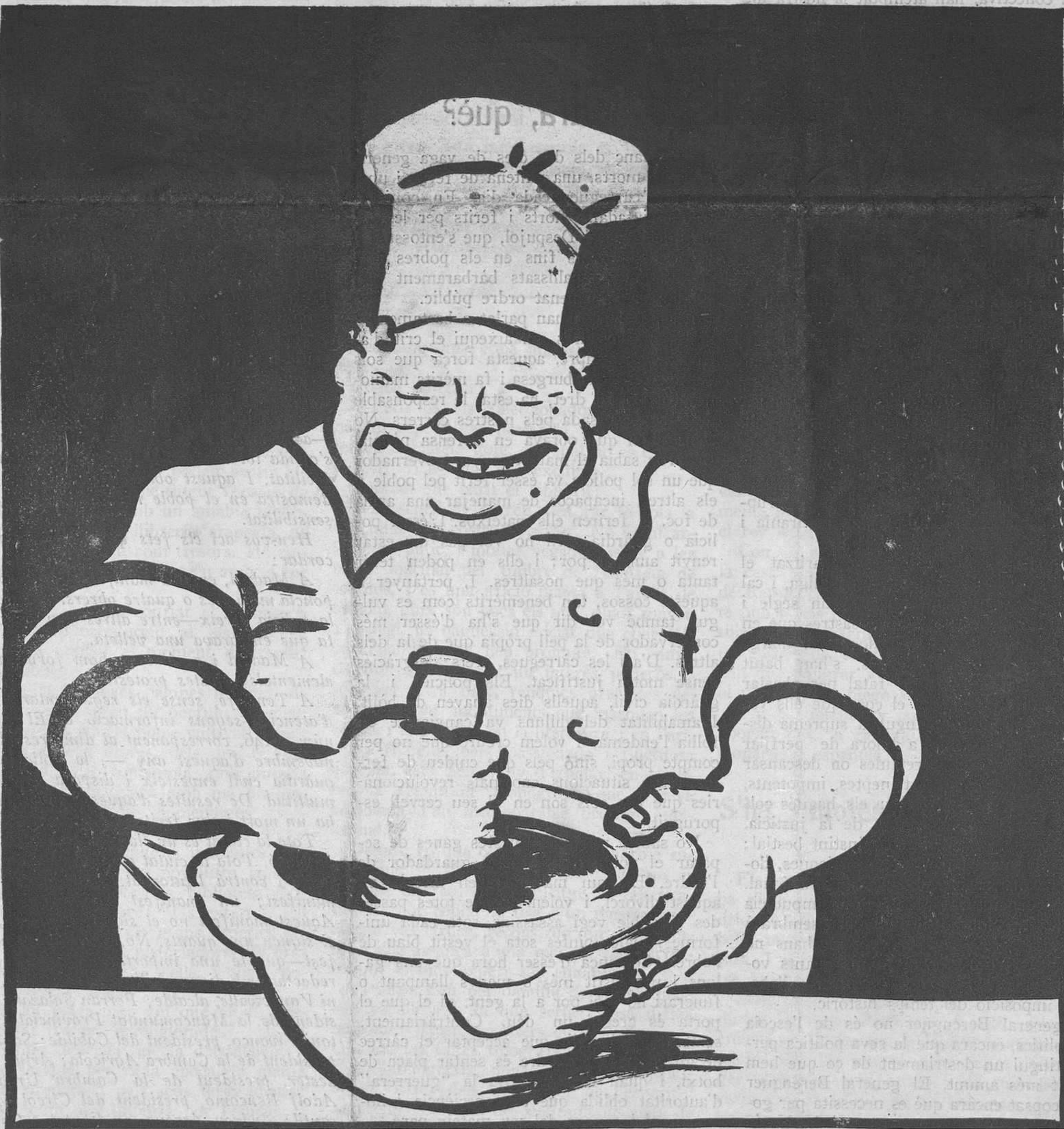
El cuiner republicà

—Aques allioli se m'ha negat; l'hauré de tornar a començar.