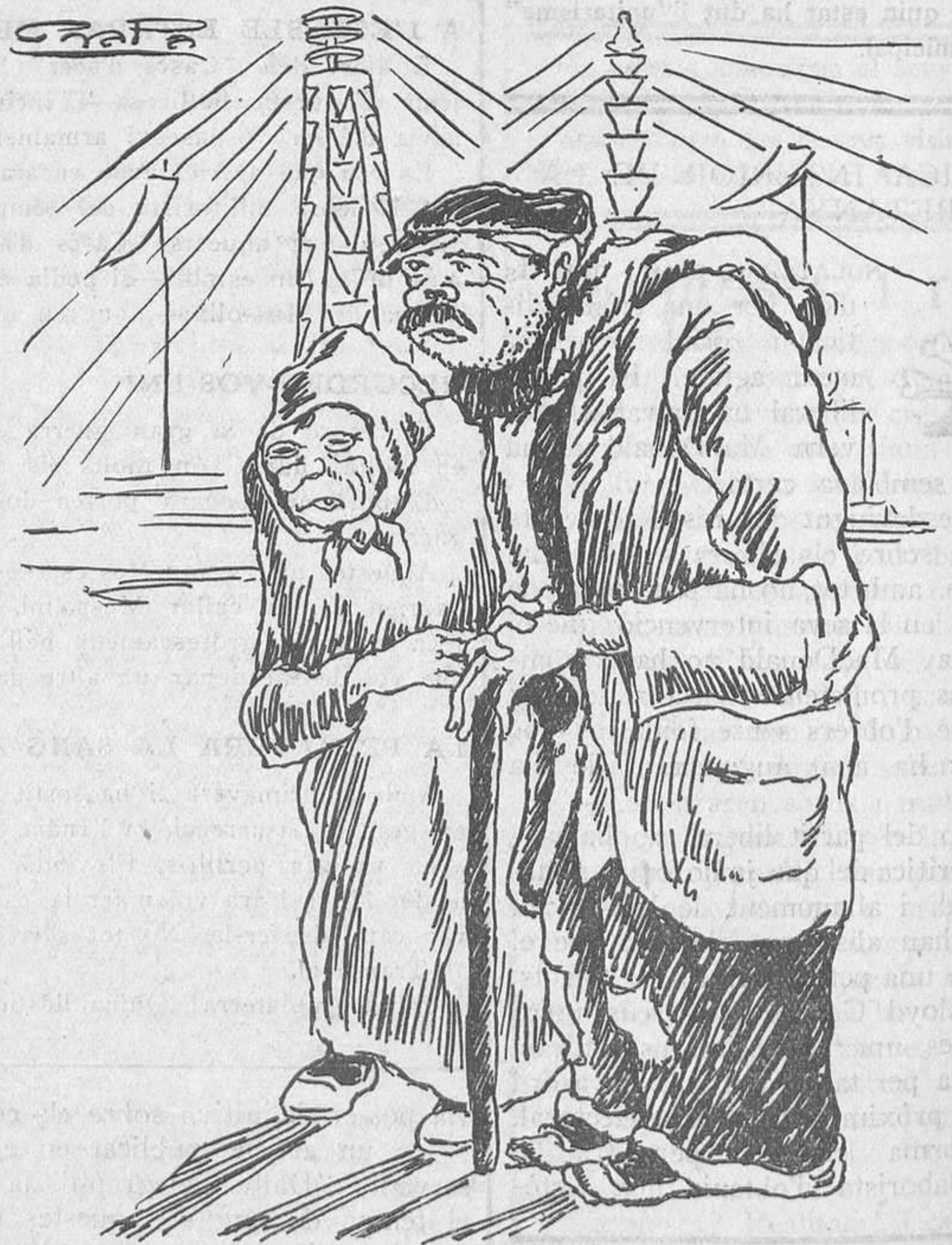
Sempre hi ha queixes

—A la plaça de Catalunya, tanta llum, i nosaltres hem de viure a les fosques