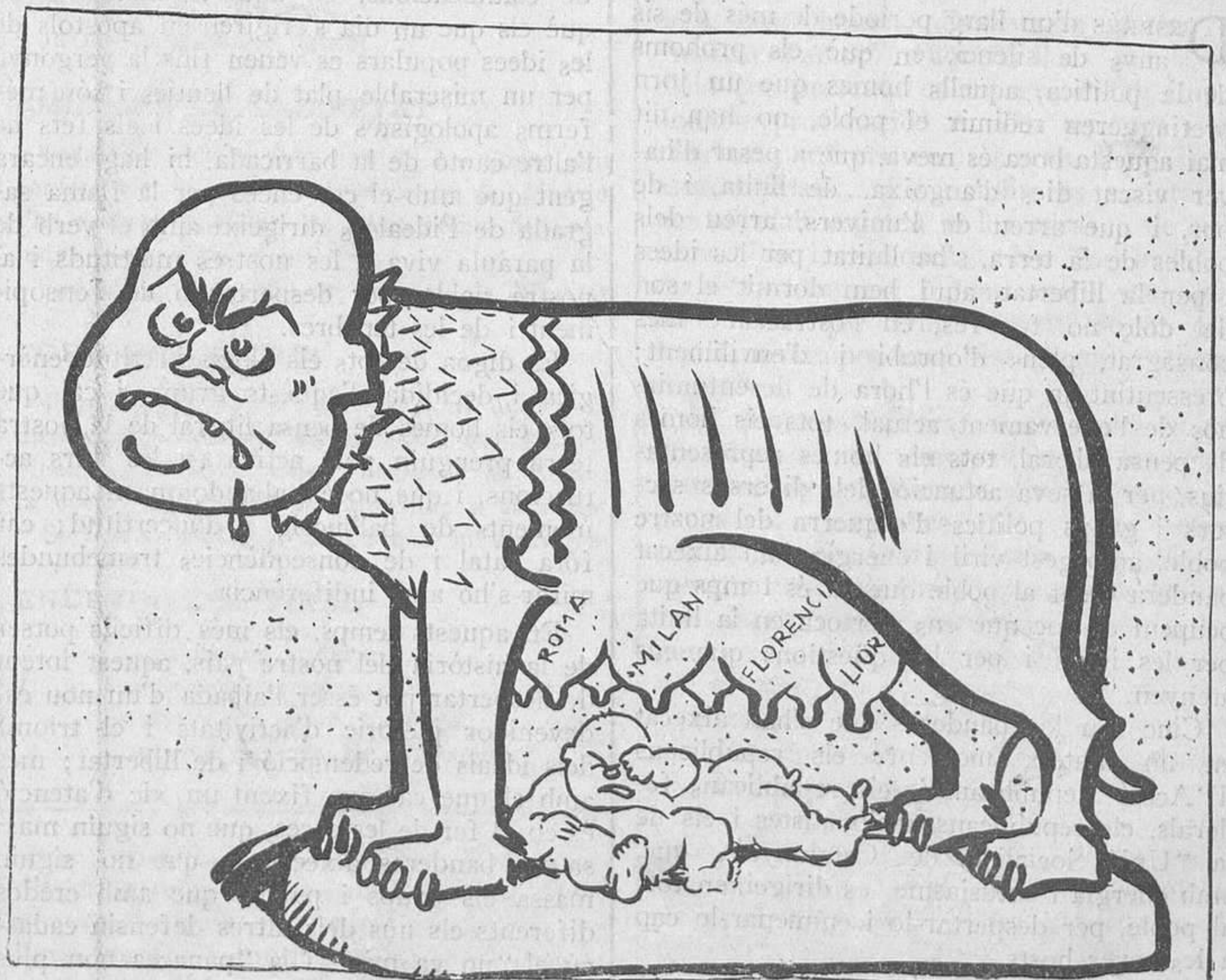
Retorn a la Roma antiga

Ahir, a primera hora de la nit, en conèixer-se a Madrid el resultat del partit final del campionat de futbol, aparegué a la Carrera de Sant Jeroni un nodrit grup de