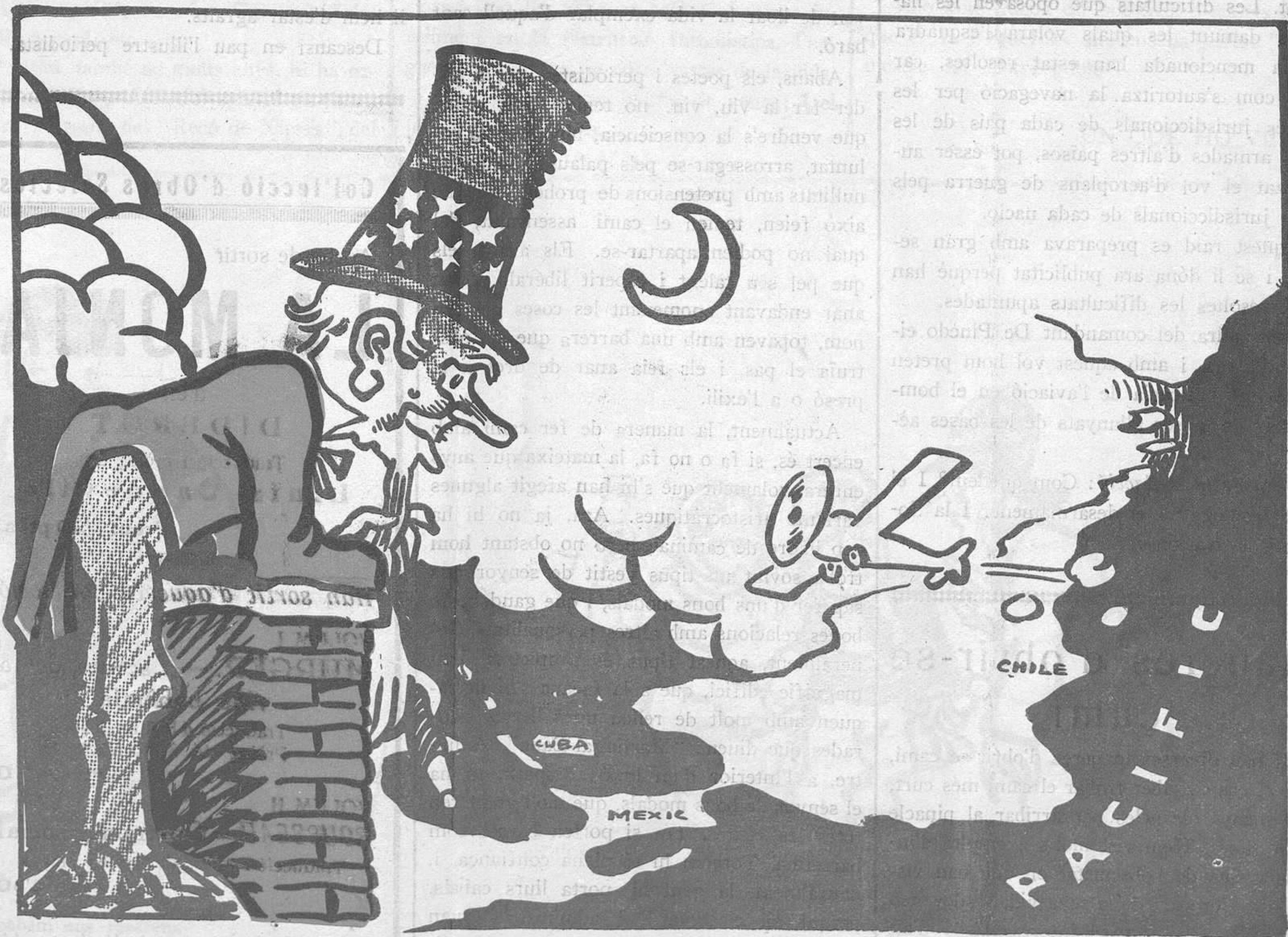
L'ONCLE SAM I LA AVIACIO

EL PRESENT NUMERO HA ESTAT VISAT PER LA CENSURA GOVERNATIVA