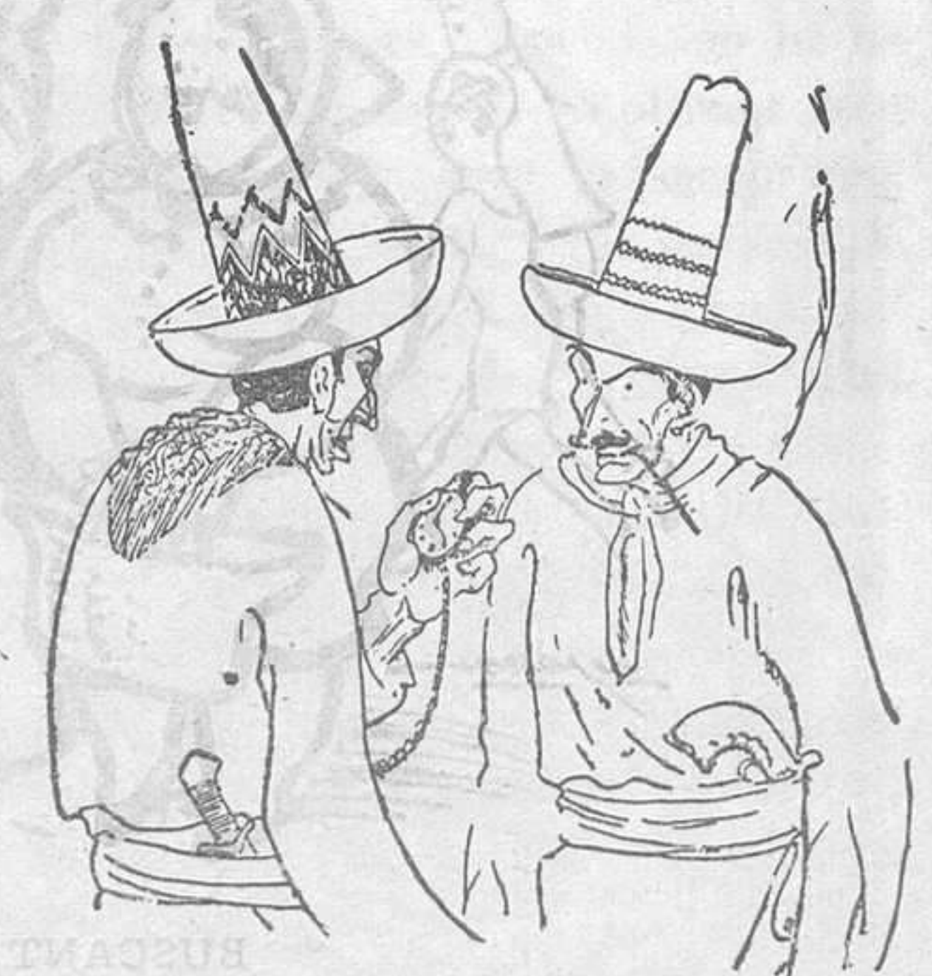
DIVERTIMENTS POPULARS A MEXIC —Me'n vaig, Miquel; tinc preparada una altra revolució a les 8 h. "Nebels Palter", Suisse.