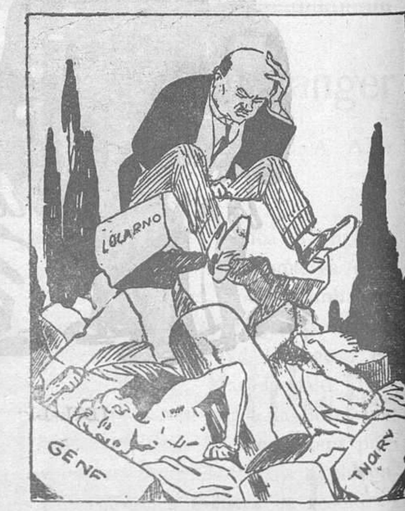
Stresemann sobre les ruïnes de Locarno. "Kladderatsch", Berlín.