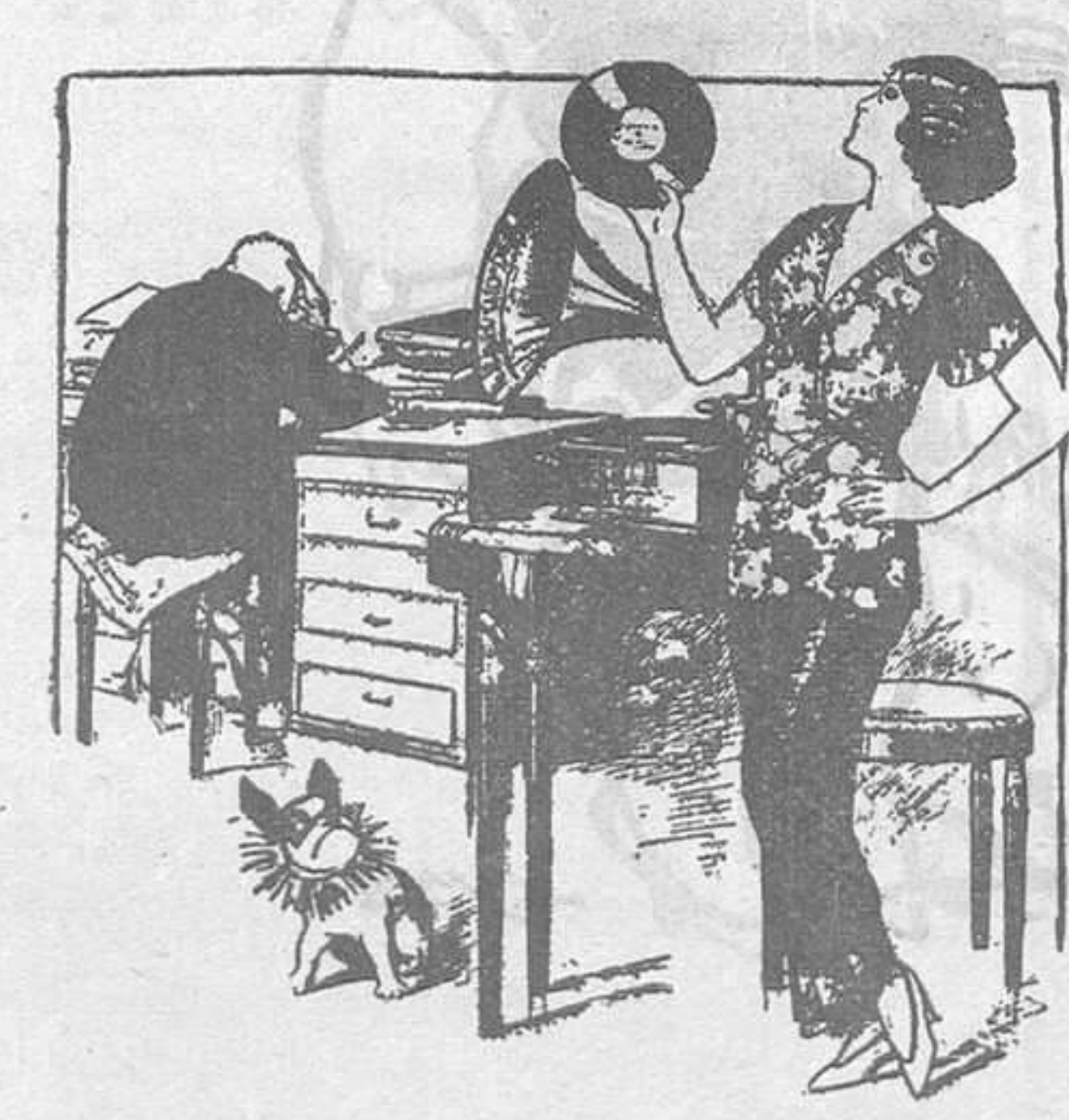
UNA ULTIMA PARAULA! —O em compres un vestit de primavera o faig funcionar el gramòfon. "Humoristicke Listy", Praga.