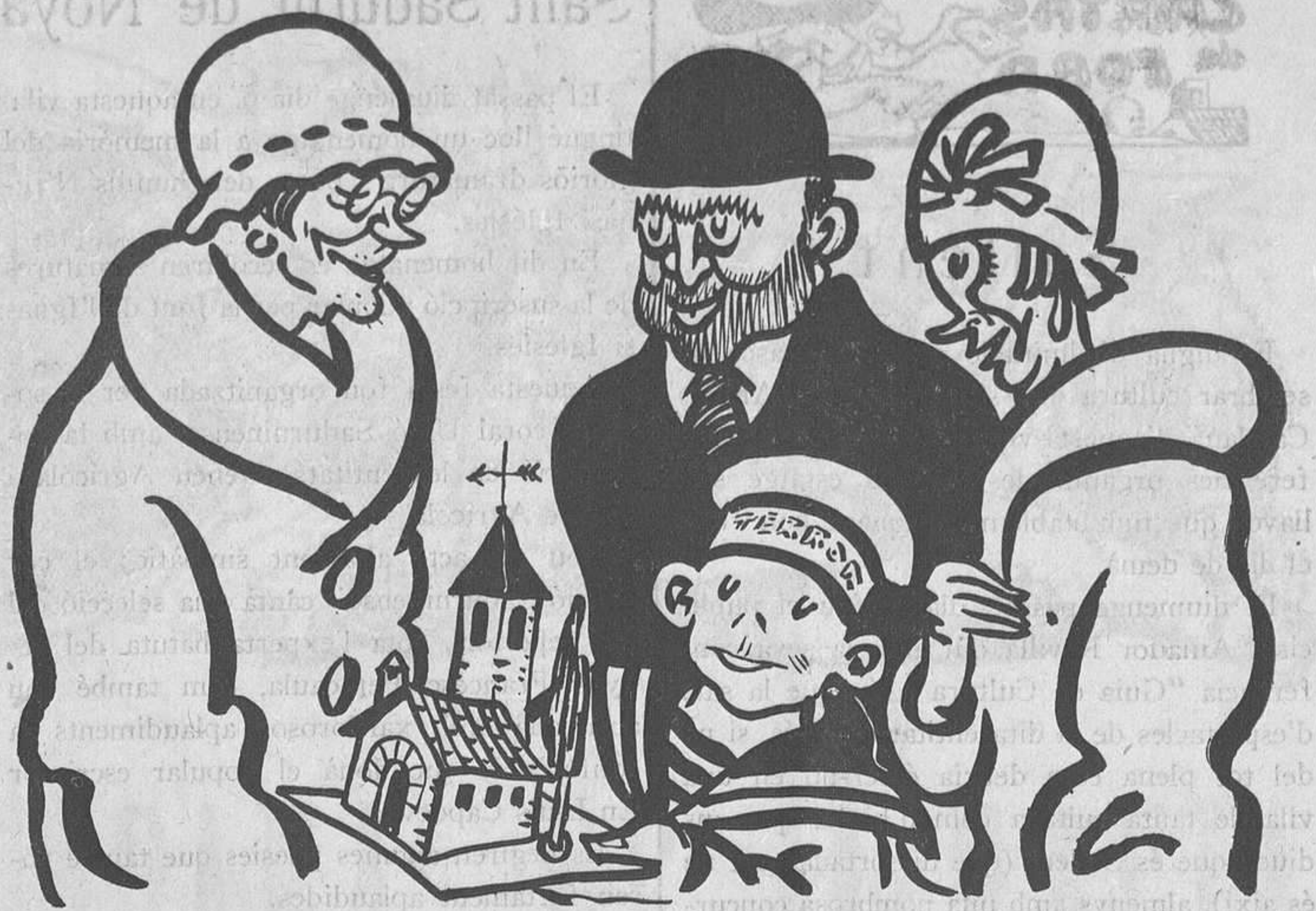
LA FIRA DELS PESSEBRES

Reconec que passo pel món sense saber-hi viure. Ells, els apassionats, els del cop de puny i la guita, són dignes fills del segle en què benauradament vivim. Jo tinc la desgràcia de no estimar-ne els mèrits positius d'aquests avenços i d'aquesta civilització. Mentre em dol veure que, per efectes de la cultura, un pobre noi va amb el cap obert o amb l'estómac fet a miques, ells censuren el meu plany, per bé que el ferit és un contrari o un inexpert, el que demostra que al pas que anem, fins per a morir se n'ha de passar l'aprenentatge.