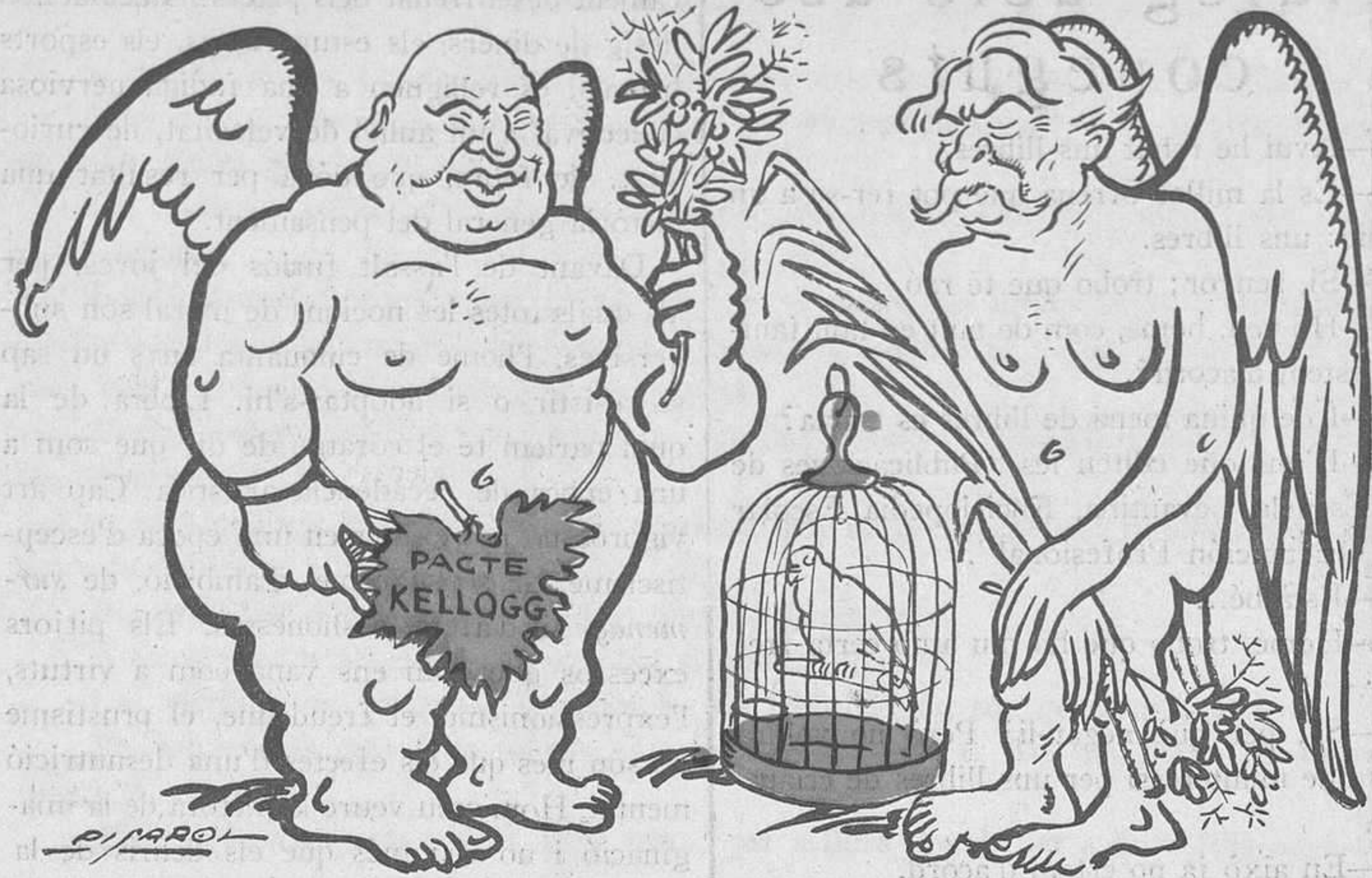
L'ANGEL DE LA PAU

—Ara n'hi han dos: Stressemann i Briand. I sembla que faran feina.