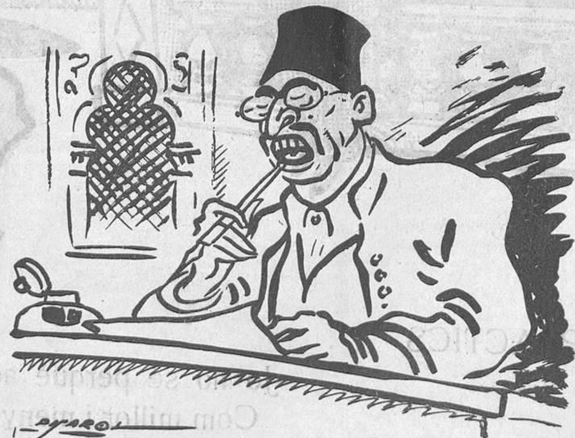
L'ALFABET LLATI A TURQUIA