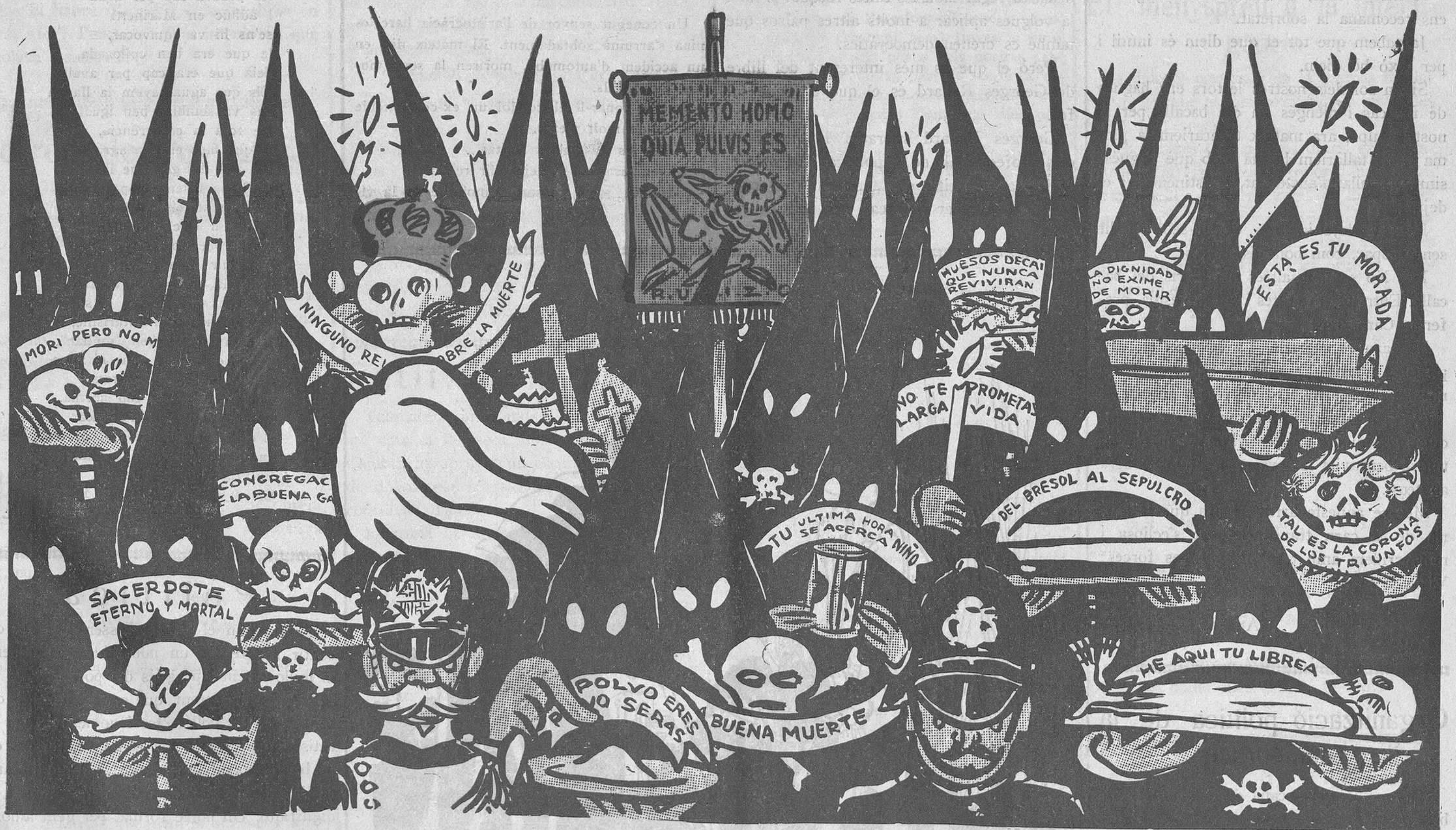
La processó de la Bona Mort