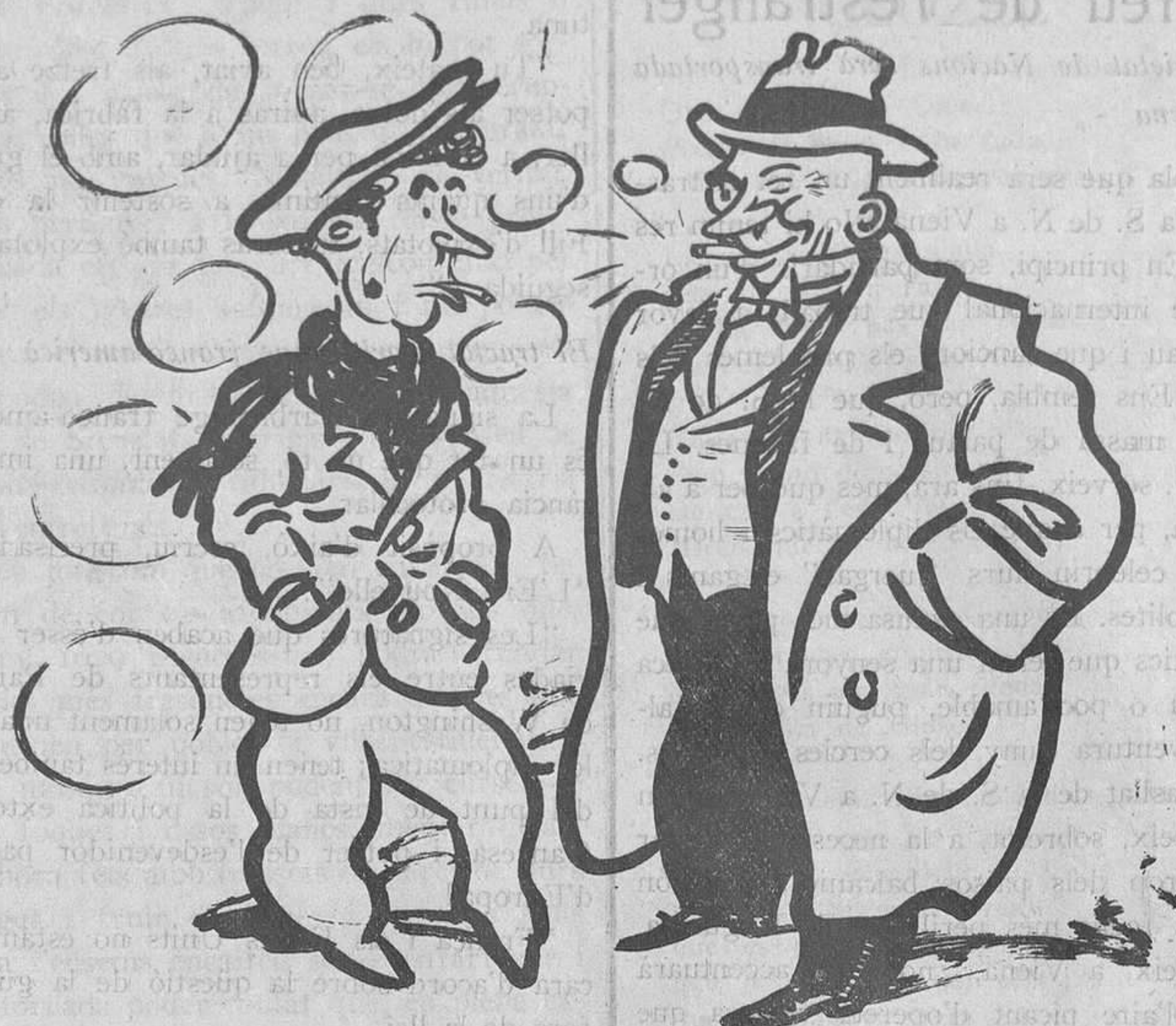
SORTINT DEL BALL

—Soc l'amo del pis, i com que mai el trobo a casa... —Doncs, ve bé; perquè ara cobrarà!