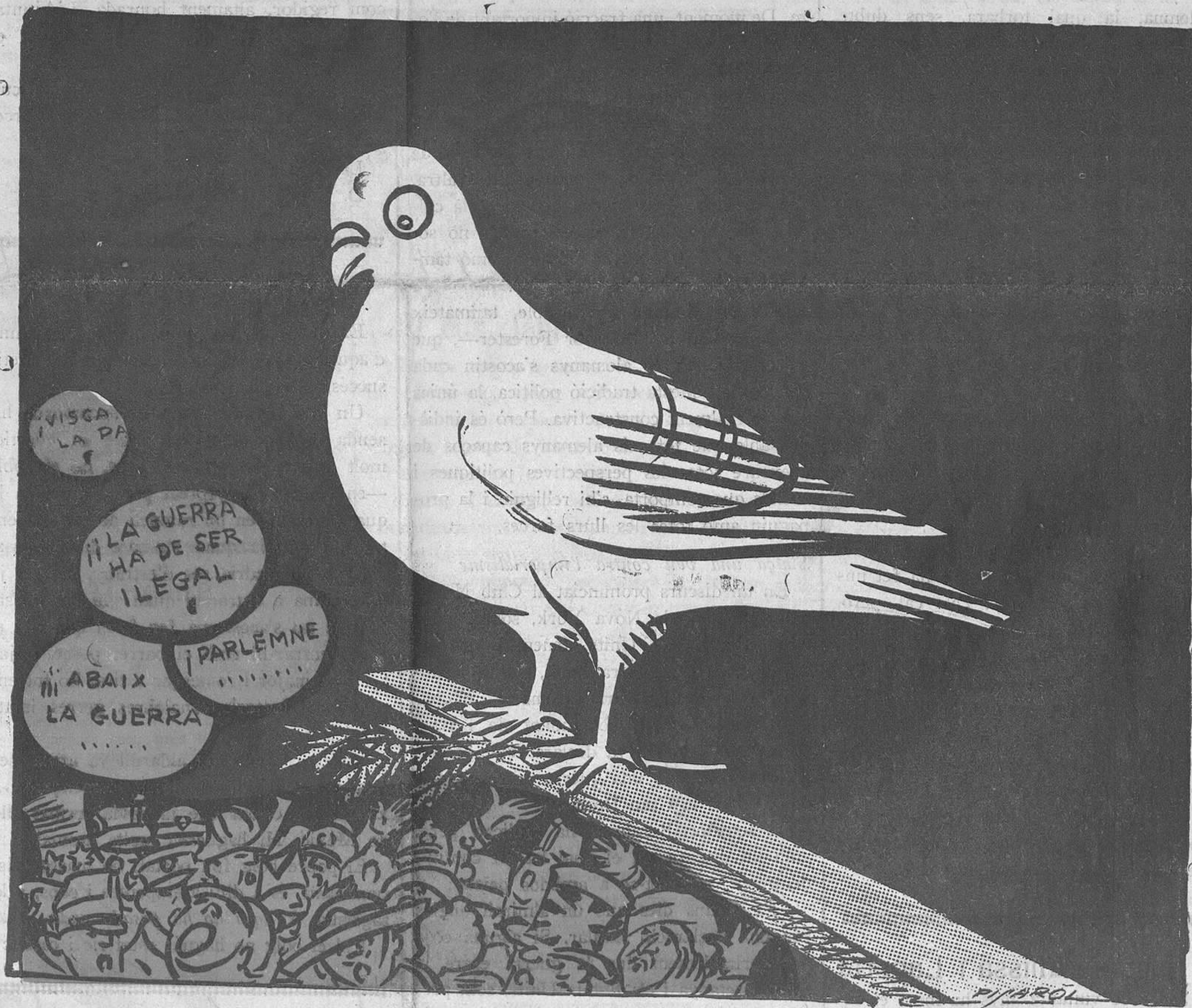
EL COLOM DE LA PAU

"La monja de las llagas", és la reconsti-