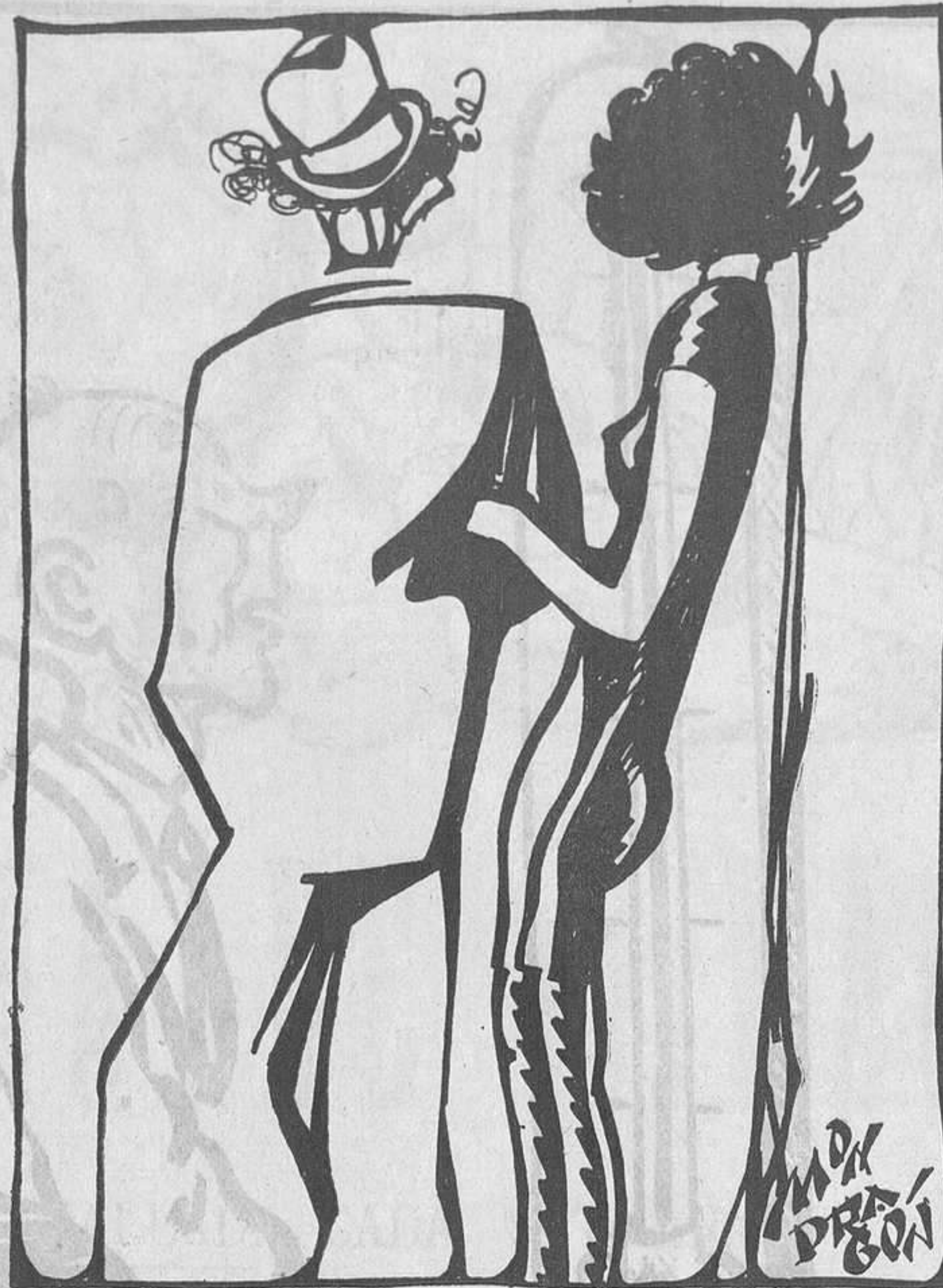
ELS SENSE FEINA

—Tampoc has trobat feina en aquella casa? —Perquè demanaven empleats d'ambos sexes!