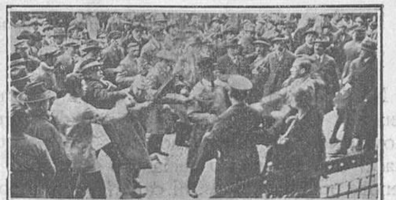
Batusses entre republicans i imperialistes durant les eleccions