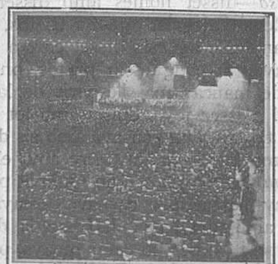
Marx, el candidat radical, en un míting.