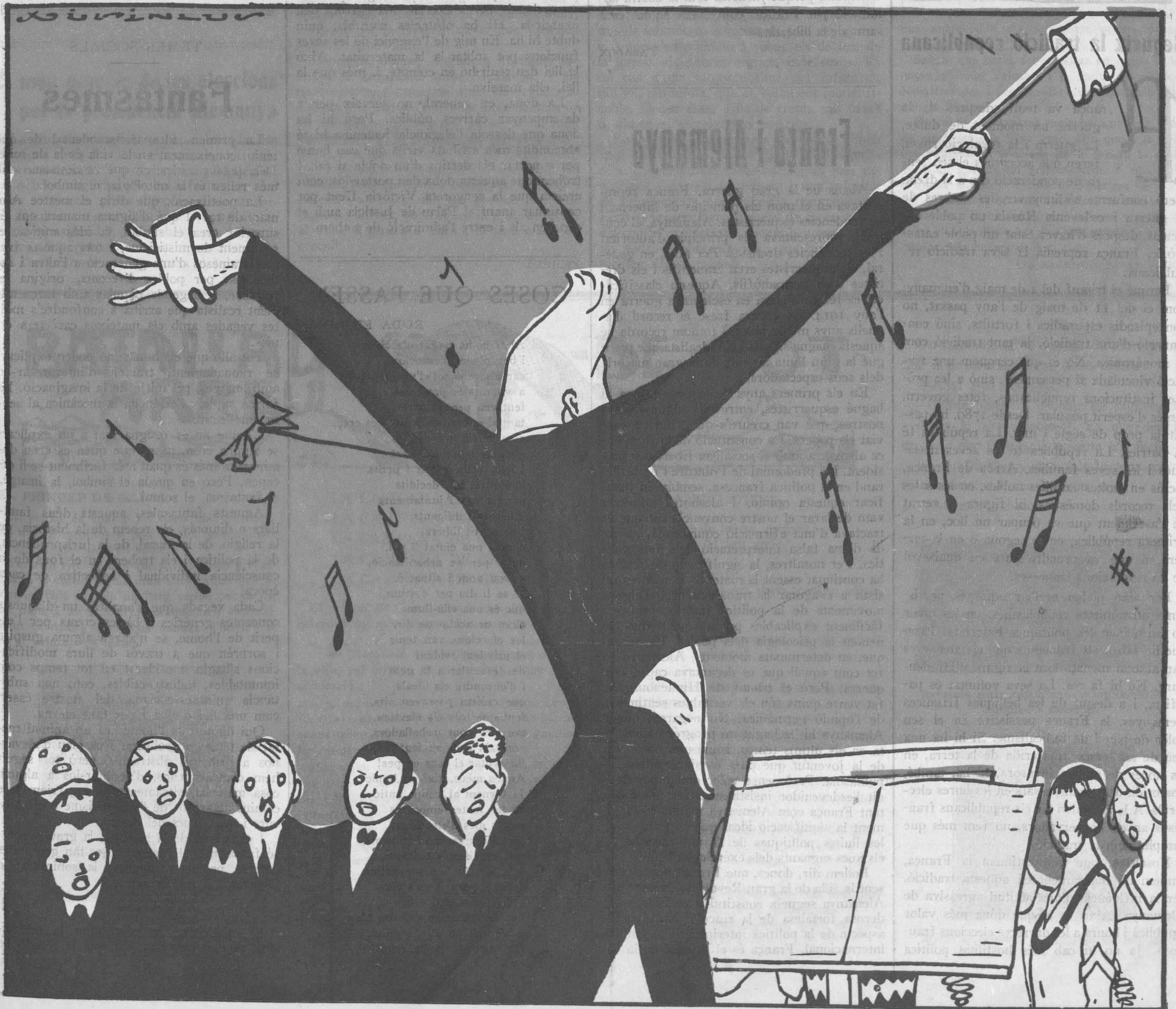
L'Orteó Català conquistant al món.