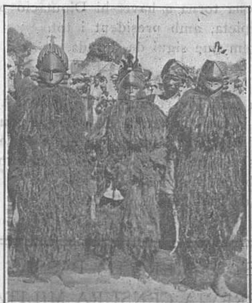
Una dansa guerrera en honor del príncep de Gales

Per això veiem algun que altre príncep predestinat a la corona d'una gran nacionalitat que de tant en tant emprèn un llarg viatge per la faç del món. I un dels prínceps que més especialment es dedica a aquesta manera d'instruir-se és el príncep de Gales.