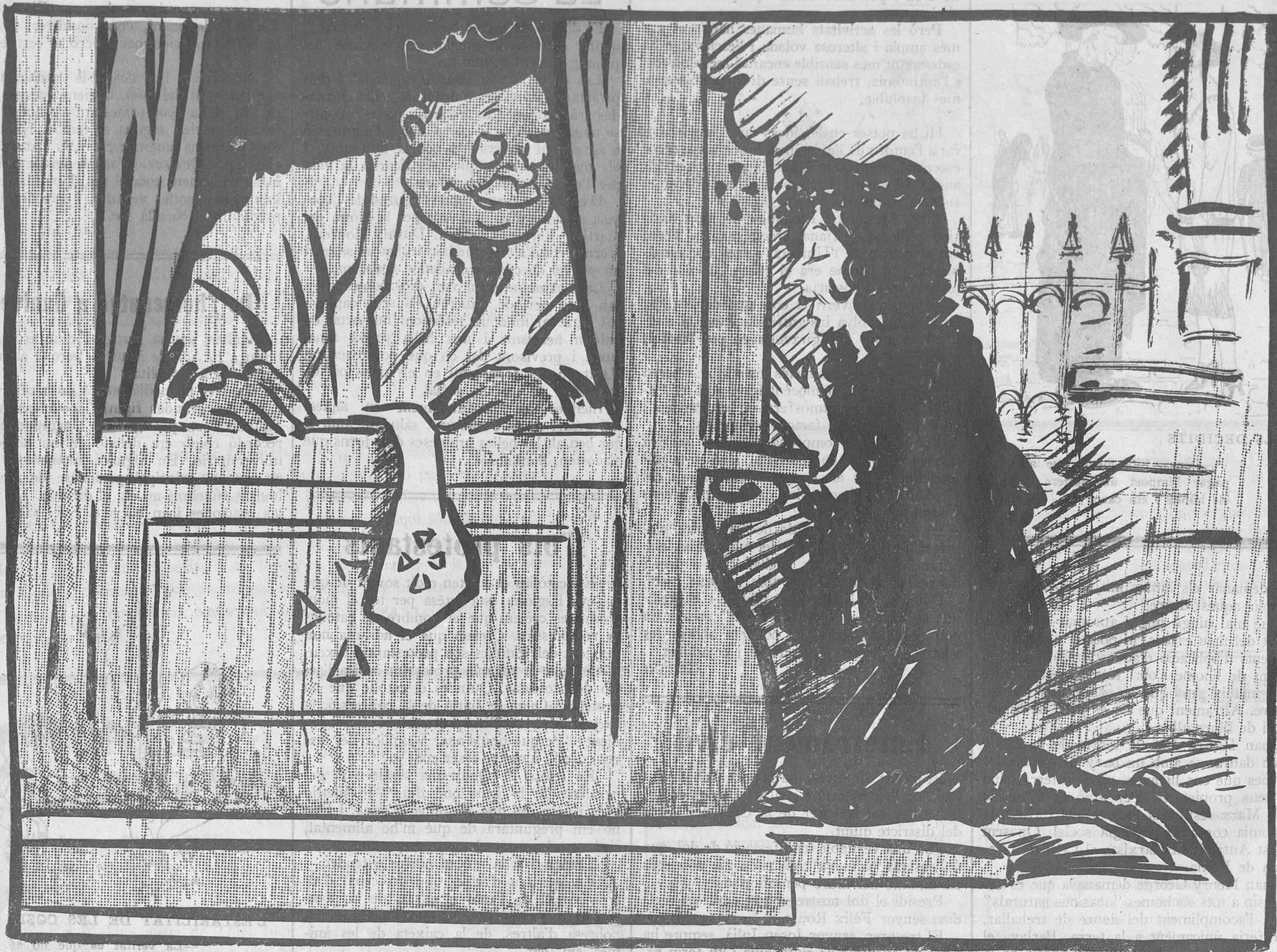
DE LA DIADA

—He fet un pecat molt gros! —Ros o moreno?