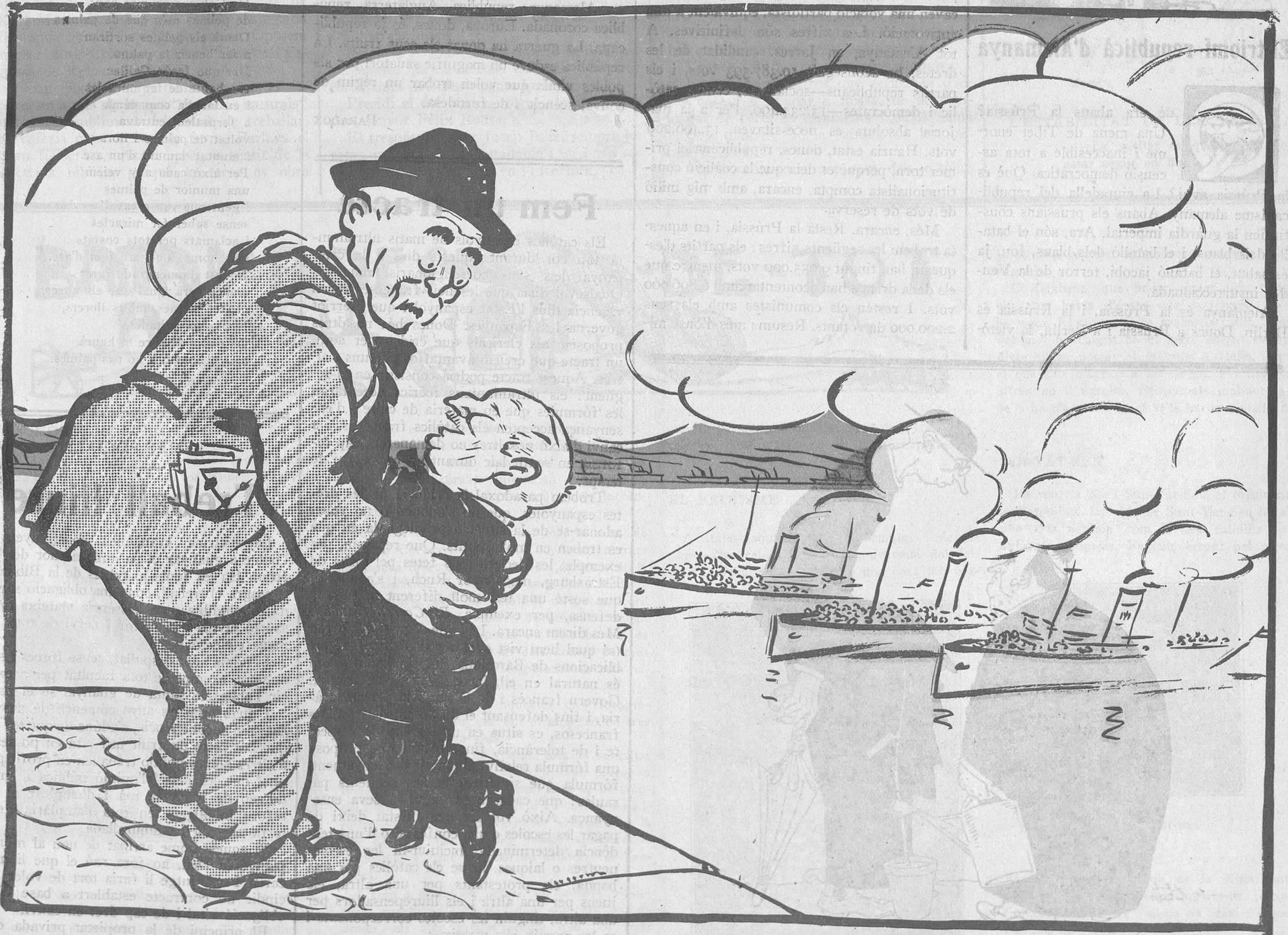
El vell. —Noi, ets un gran home!