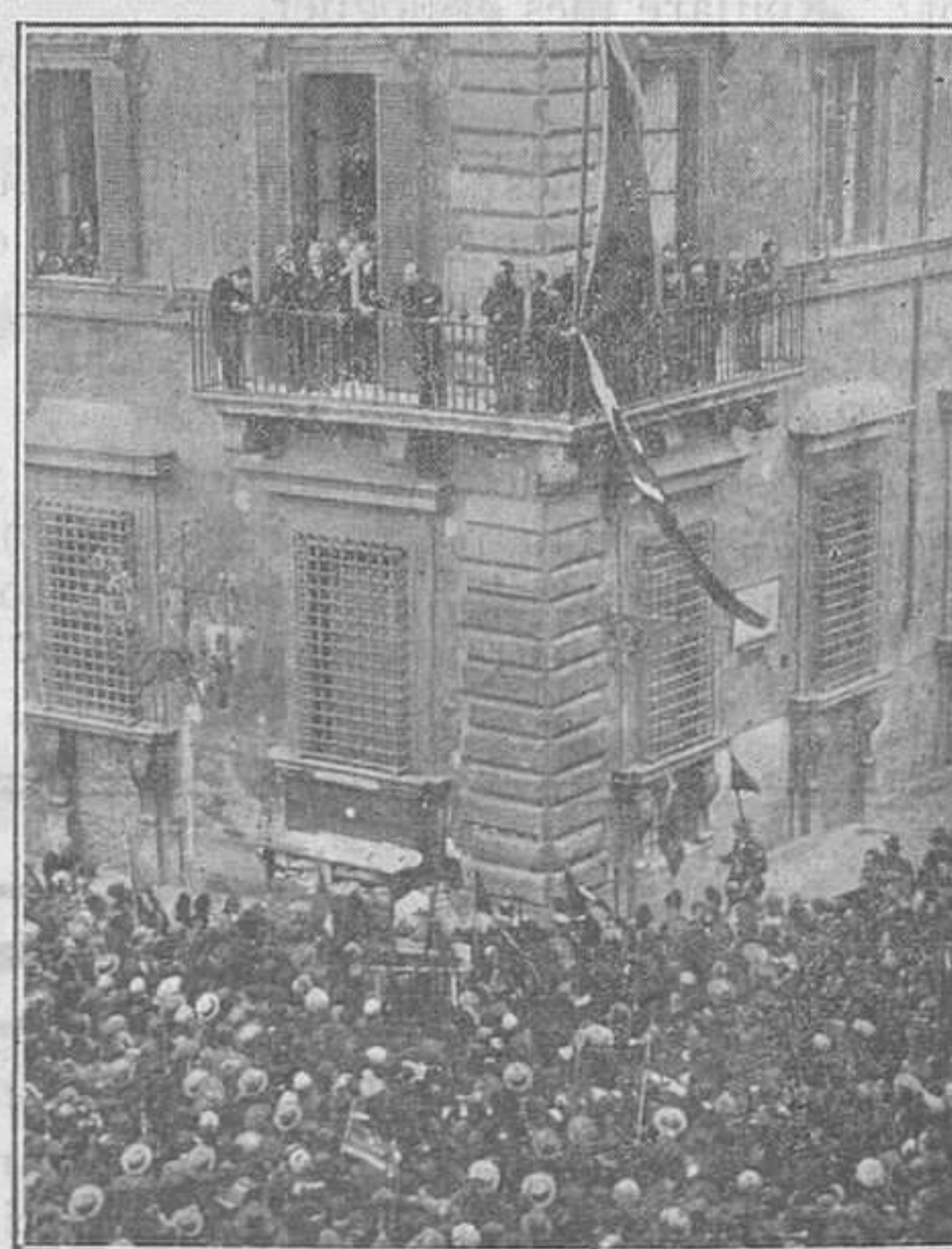
El setè aniversari del feixisme

A Itàlia—aquest país de formatge i de tenors—s'ha celebrat el sisè aniversari del feixisme. Nosaltres creiem que una cosa tan tris-