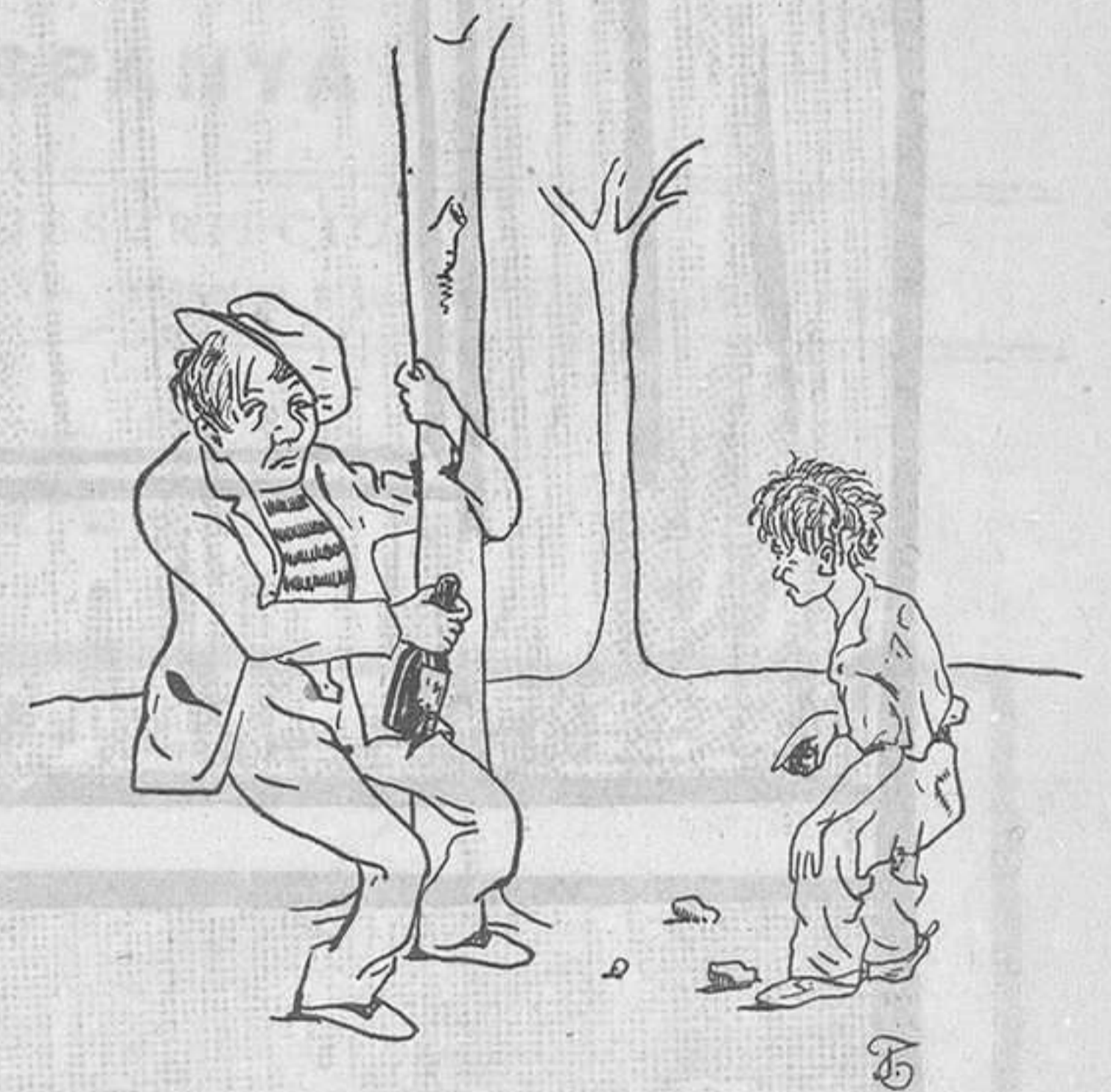
L'ESTABILITAT DE LES COSES

"Ganivet no podia menos de hacer recordar a dos grandes figuras coetaneas suyas: Joaquín Costa y Miguel de Unamuno. Se les recordó como era debido en un homenaje universitario. En algunos momentos parecia que el principal personaje de aquellas honras fúnebres no era el difunto. No todas las oraciones iban hacia el Sur, hacia Gra-