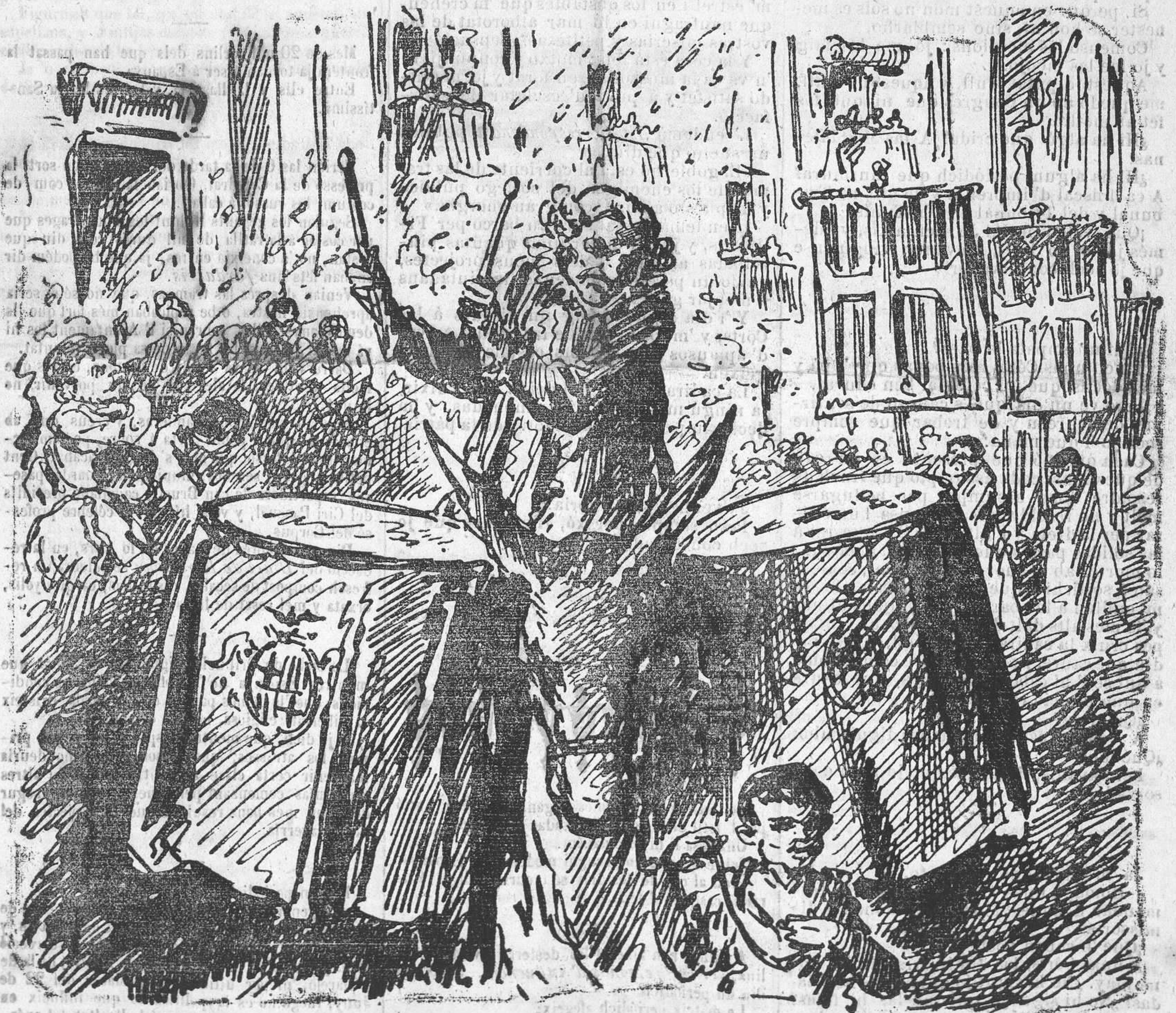
Los gegants son nous pero per això LAS TRAMPAS continuan sent las mateixas.