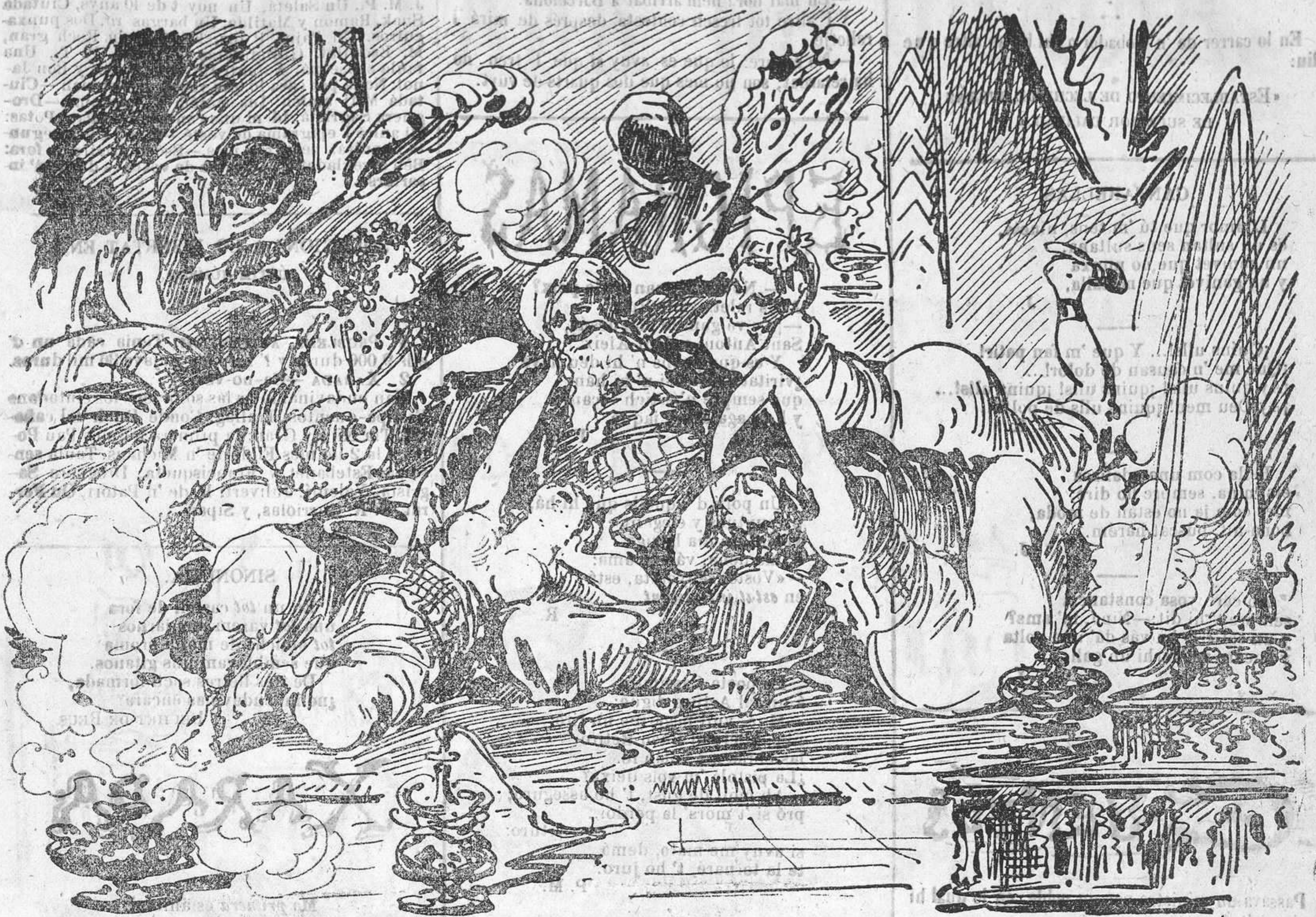
Entre-mitj de tanta esclava—;Quina vida si durava!