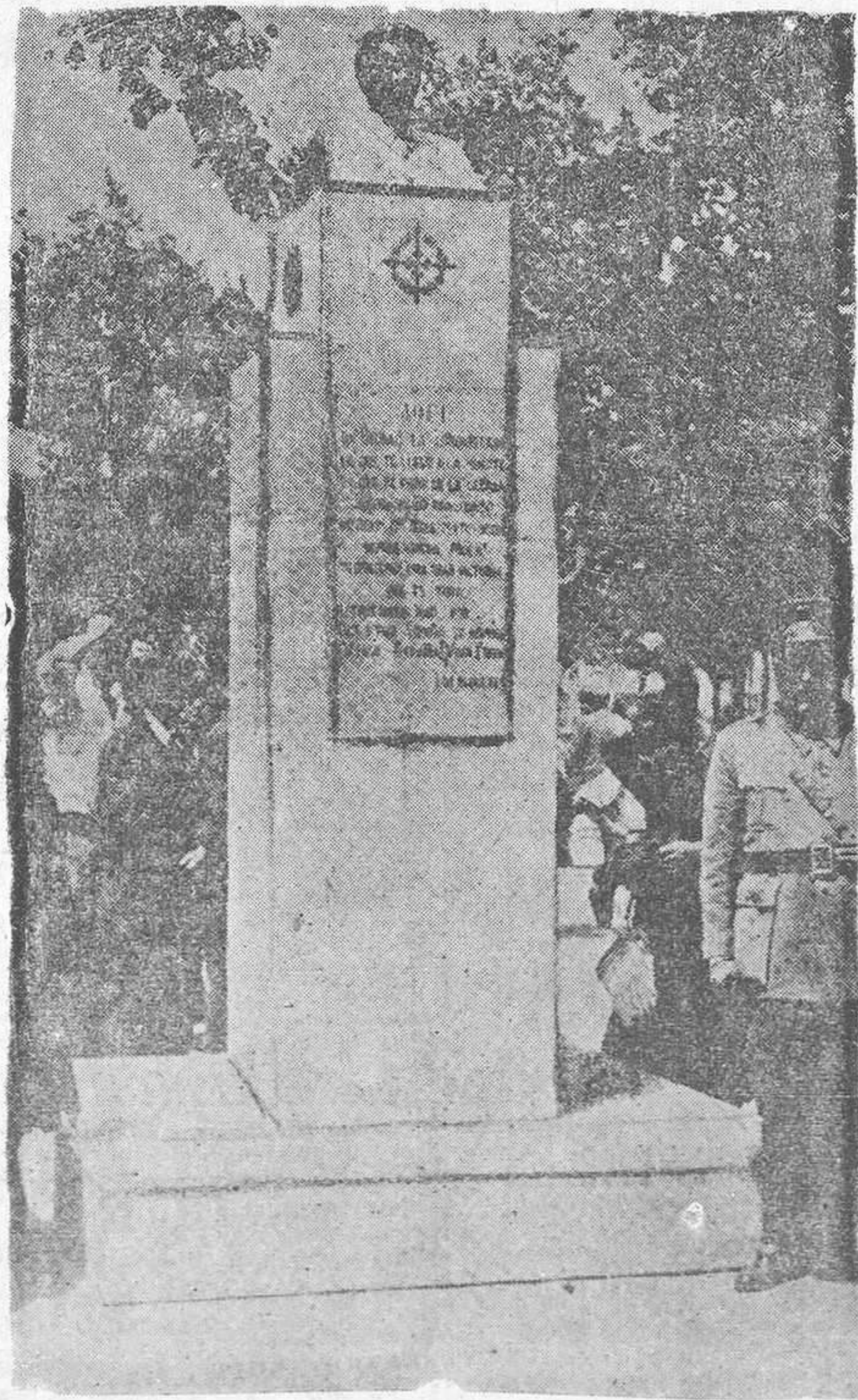
Bilbao libertado. Este es el monumento que, en el espacio de pocas horas, alzaron en Bilbao los Requetés para perpetuar la memoria del glorioso General Mola, libertador del país vasco