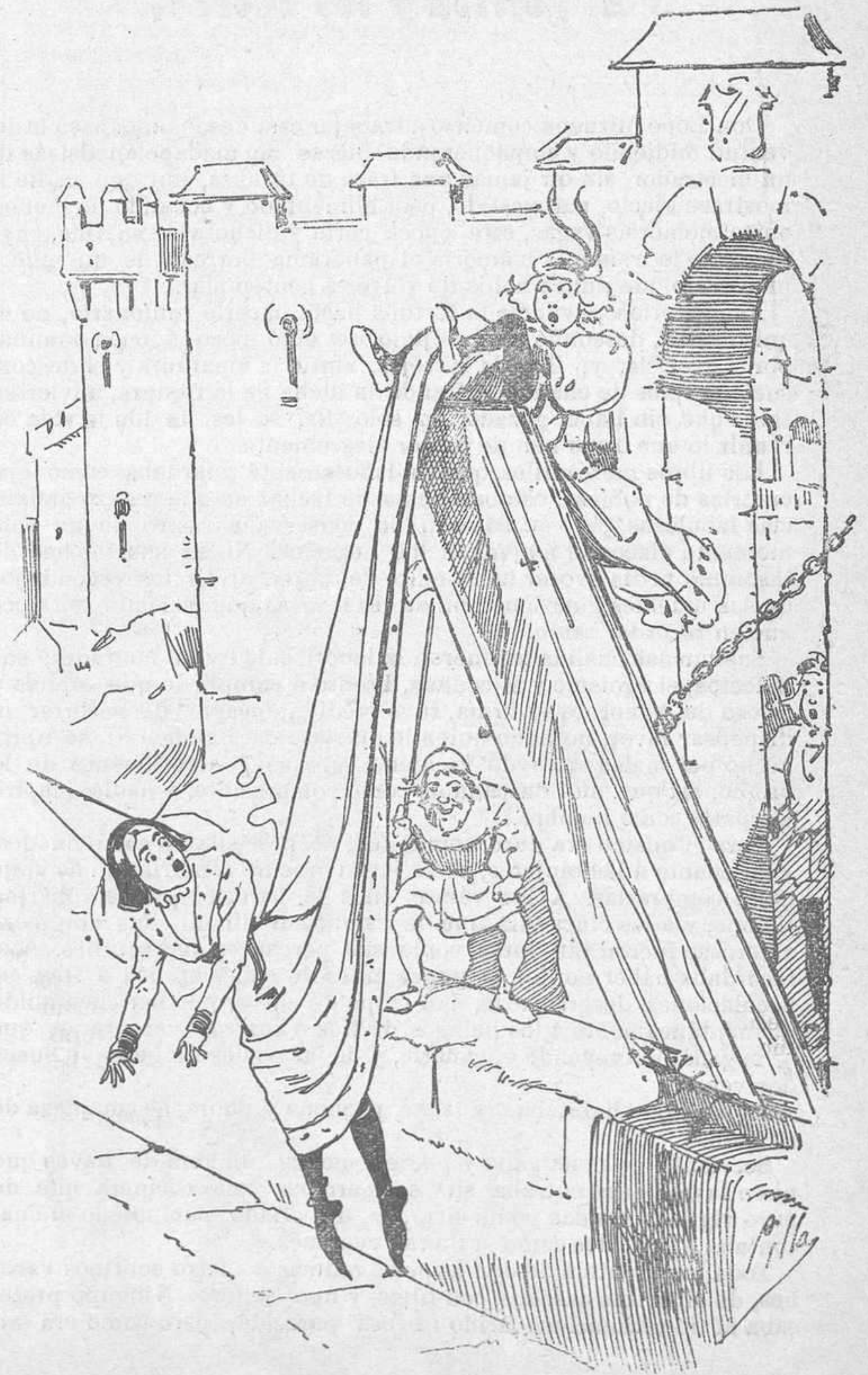
Segunda parte (que es la más lastimosa).