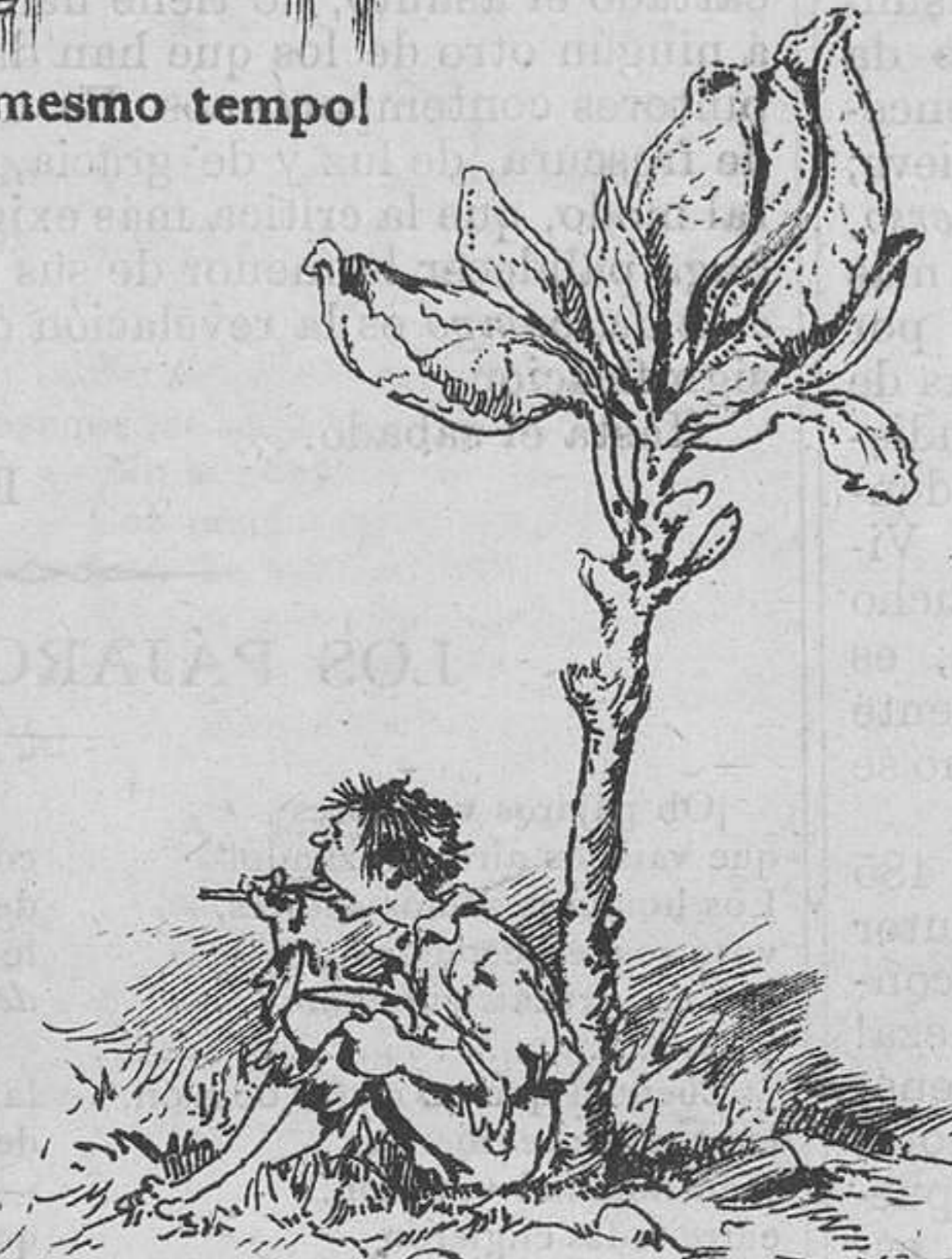
Este tamaño tienen las coles... ¡Sépanlo todos los españoles.