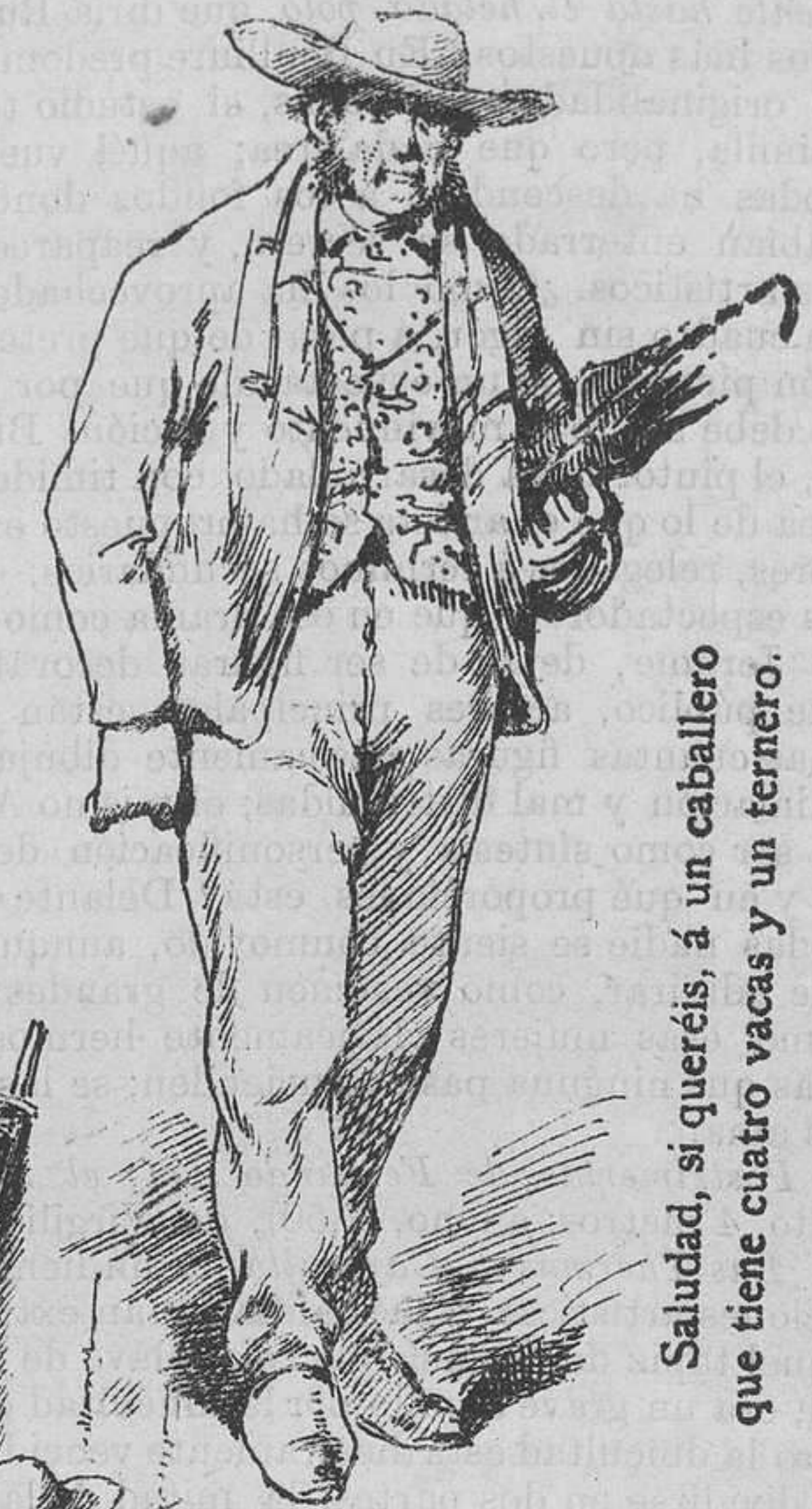
Saludad, si queréis, á un caballero que tiene cuatro vacas y un ternero.