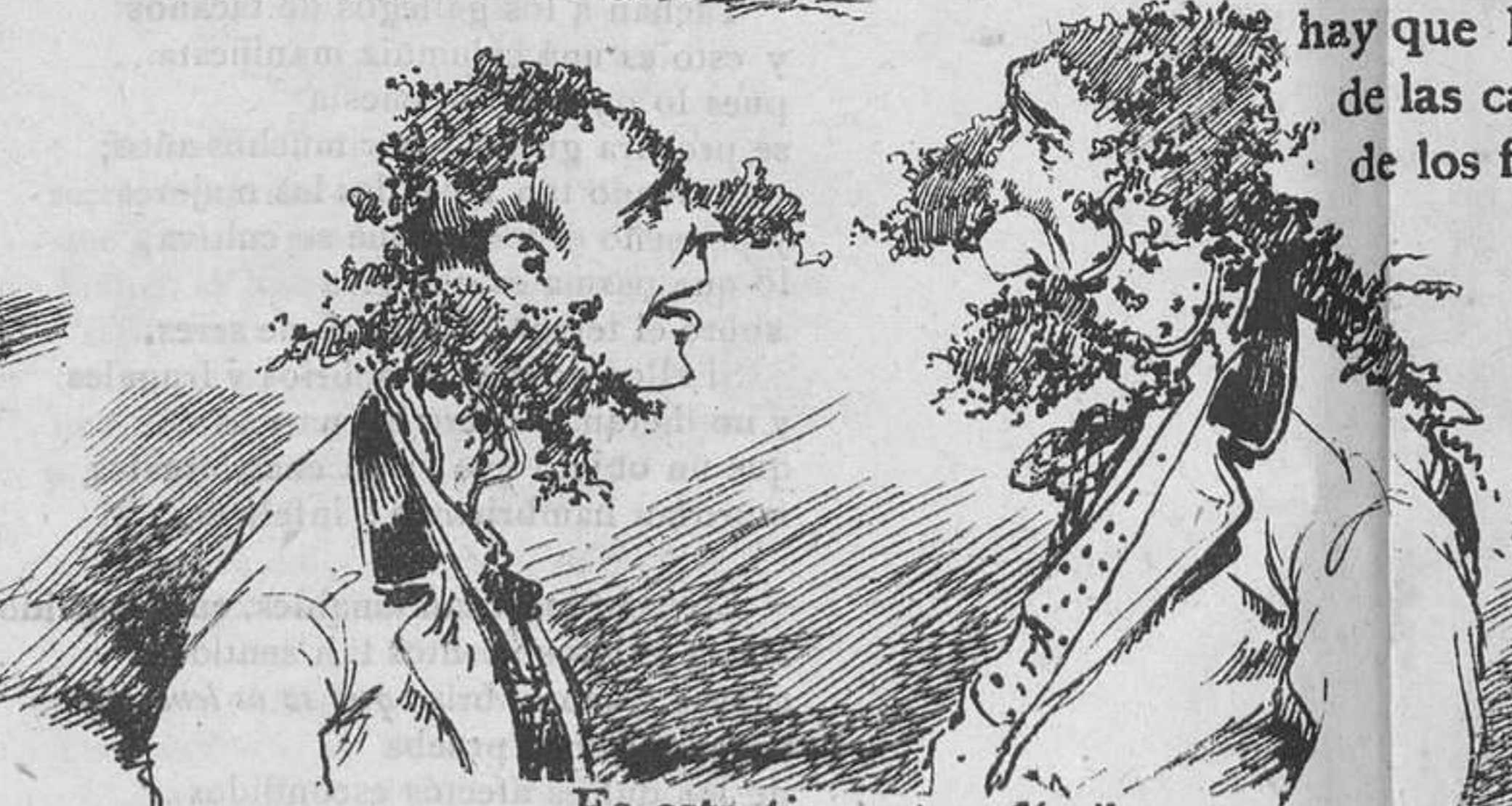
Es esta tierra tan fértil que hay gérmenes en el aire y, como verán ustedes, brota el musgo en todas partes.