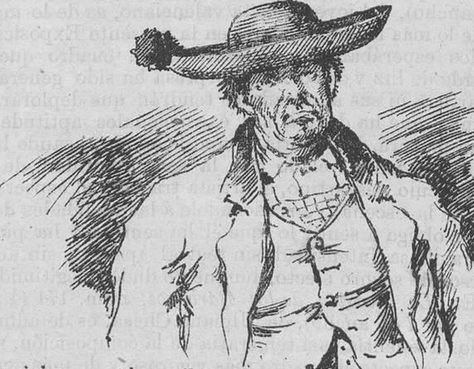
¡Los viajes que tiene él hechos á Andalucía, á recoger la aceituna, allá en sus mocedales!...