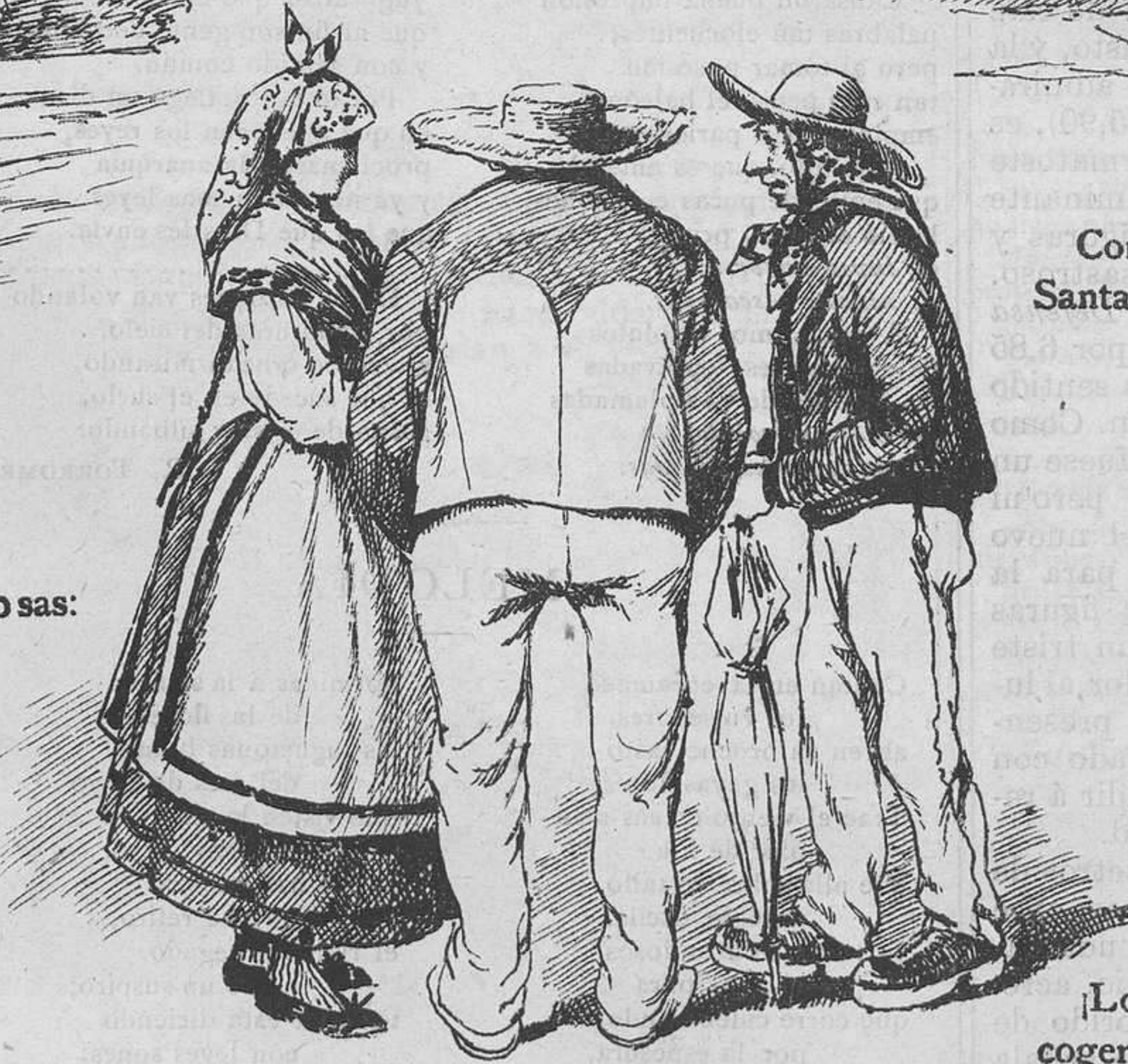
—Peru al mercadu de Ribadavia volver non vuelvo. —¿Por qué? —Porque compre me un cuenquiño, y leváronme un ochavo de más.