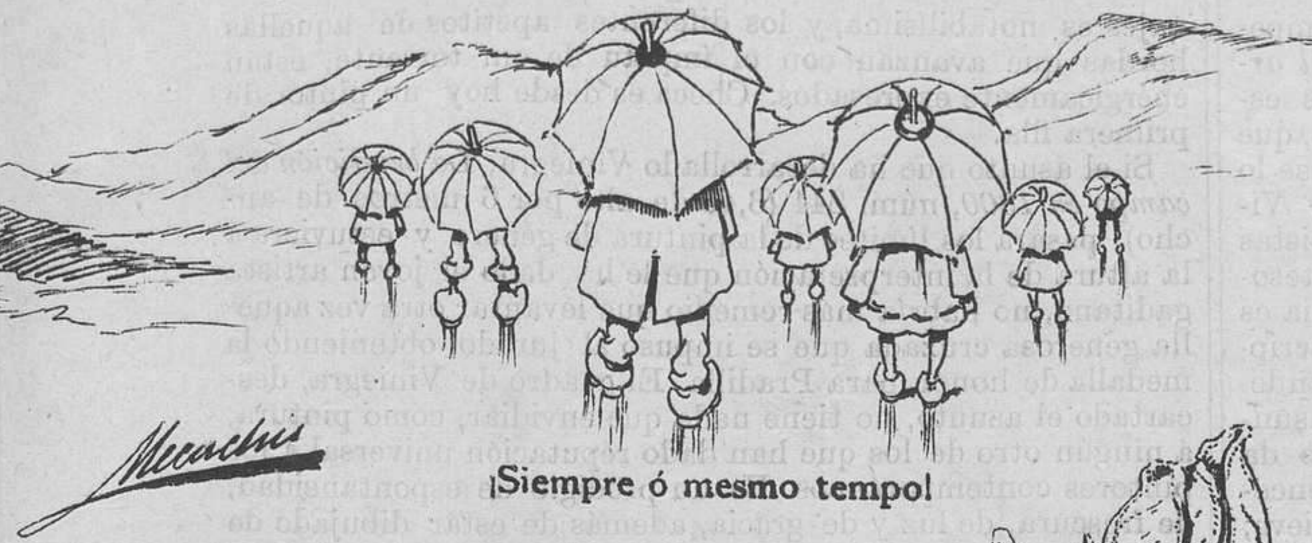
Siempre ó mesmo tempo!