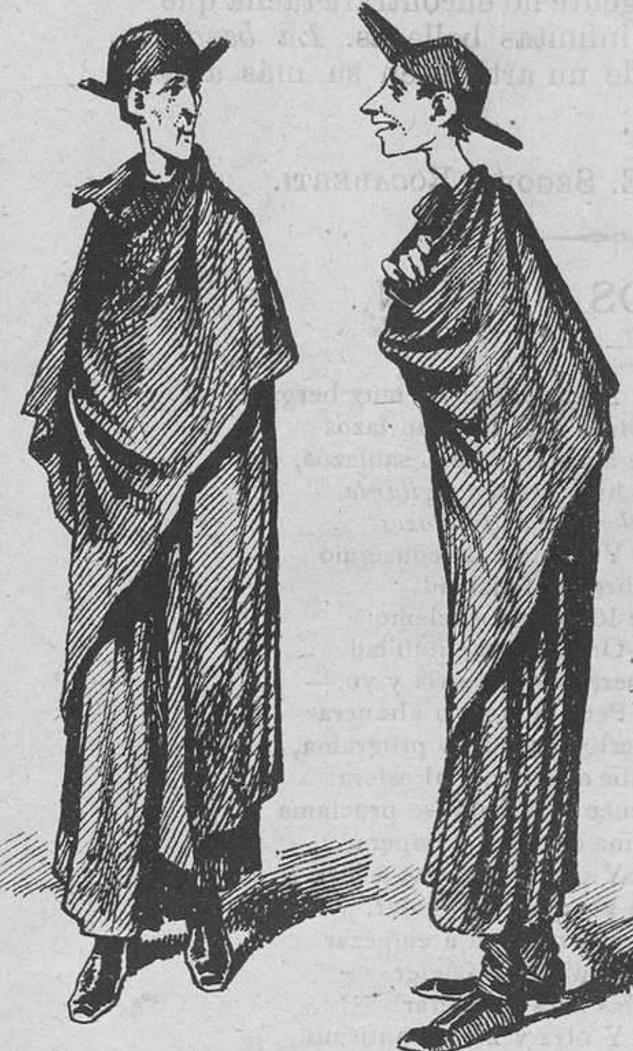
Del Seminario conciliar.