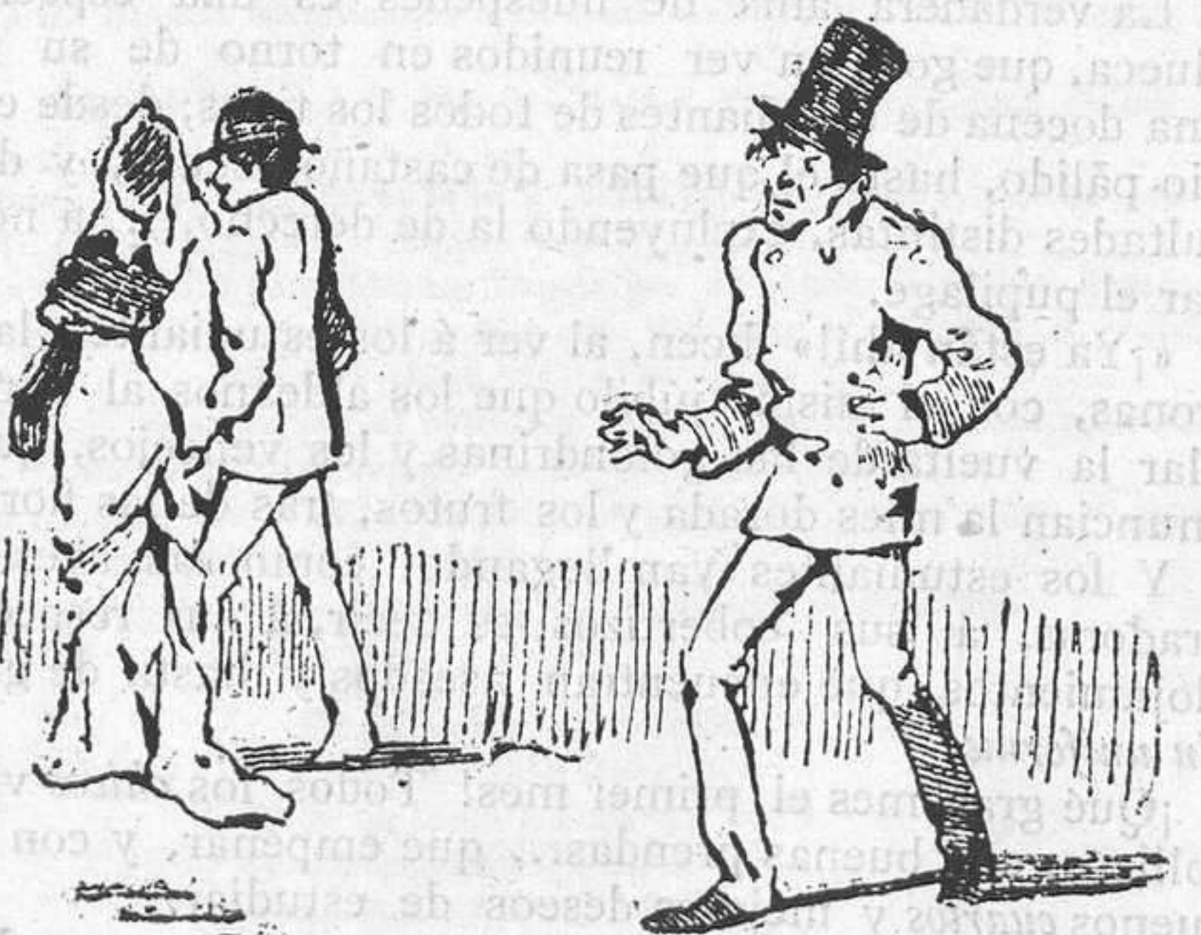
6.—Sale viejo y matalon: y en la calle del Soldado le dá un vuelco el corazon, al ver la que ha ocasionado su prision.