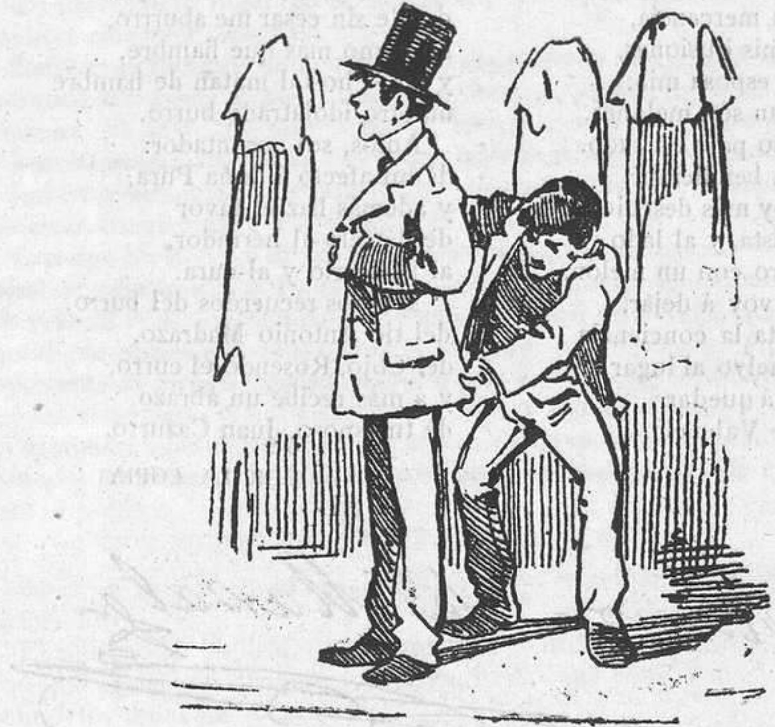
2.—Es su ocupacion primera ir á comprarse, en seguida, un reloj, una chistera y un traje, hecho á la medida... de cualquiera.