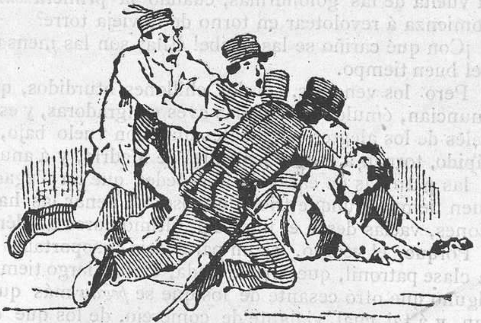
4.—Al contemplar tal exceso, grita el sastre: ¡Aquí del Rey! y en la Plaza del Progreso cae sobre él, con todo el peso de la ley.