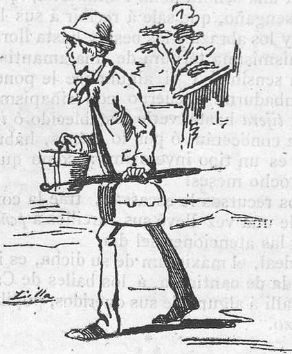
1.—Jóven delgaduchito y largo, que viene de Tarazona con el exclusivo encargo de casarse: y es persona, sin embargo.

POR CONSTANTINO GIL. — ILUSTRADA POR CILLA.