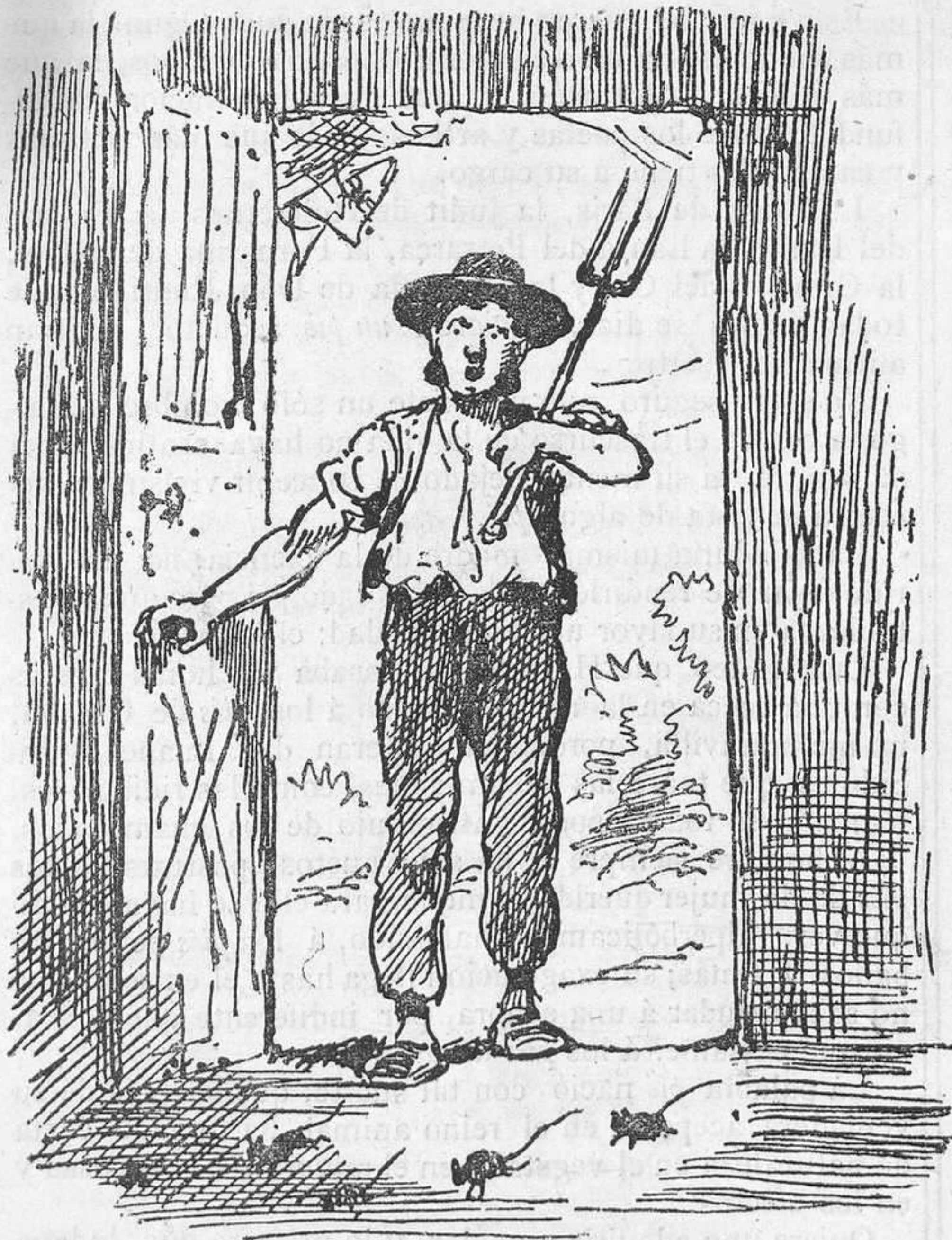
Cerremos esta portada, y pues de hembras y varones la sangre está ya templada, es justo que los ratones comiencen su temporada.

frecuencia, acostumbran á decirle al apuntador: «vaya usted al pié .» Esto dá pié á que las obras no salgan como es debido; á que el público no asista á verlas; á que el empresario tome pié para declararse en quiebra y ellos tengan que marchar á pié con la música á otra parte. Se han dado casos.