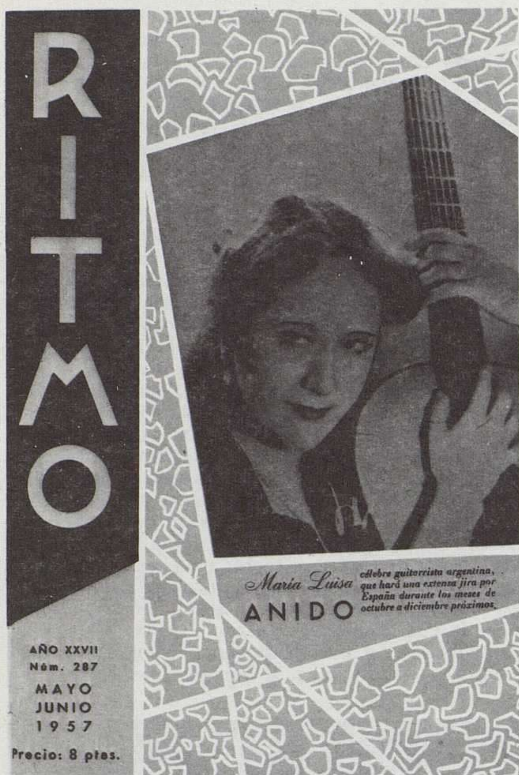
Cubierta del n. 287, mayo-junio de 1957.

fotografía central, naturalmente en blanco y negro, enmarcada entre grandes espacios blancos; en la parte superior, como ya quedó dicho páginas atrás, campeaba el título con la leyenda: «Revista Musical Ilustrada». En efecto, en casi todas sus páginas aparecían fotos o grabados.