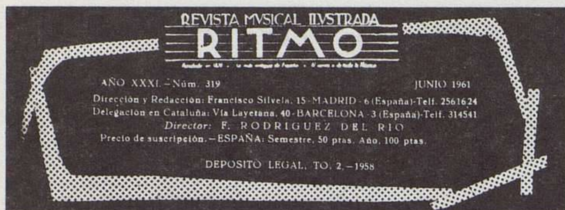
Mancheta del n. 319, junio 1961.

de la cubierta, que presenta una o varias fotografías en caprichosas formas oblicuas de irregulares ángulos, según la última moda del momento, que también afectó al cuadro de la mancheta editorial interior (dislocado en diversos trazos), pero que no fue capaz de alterar la tipografía característica del título.