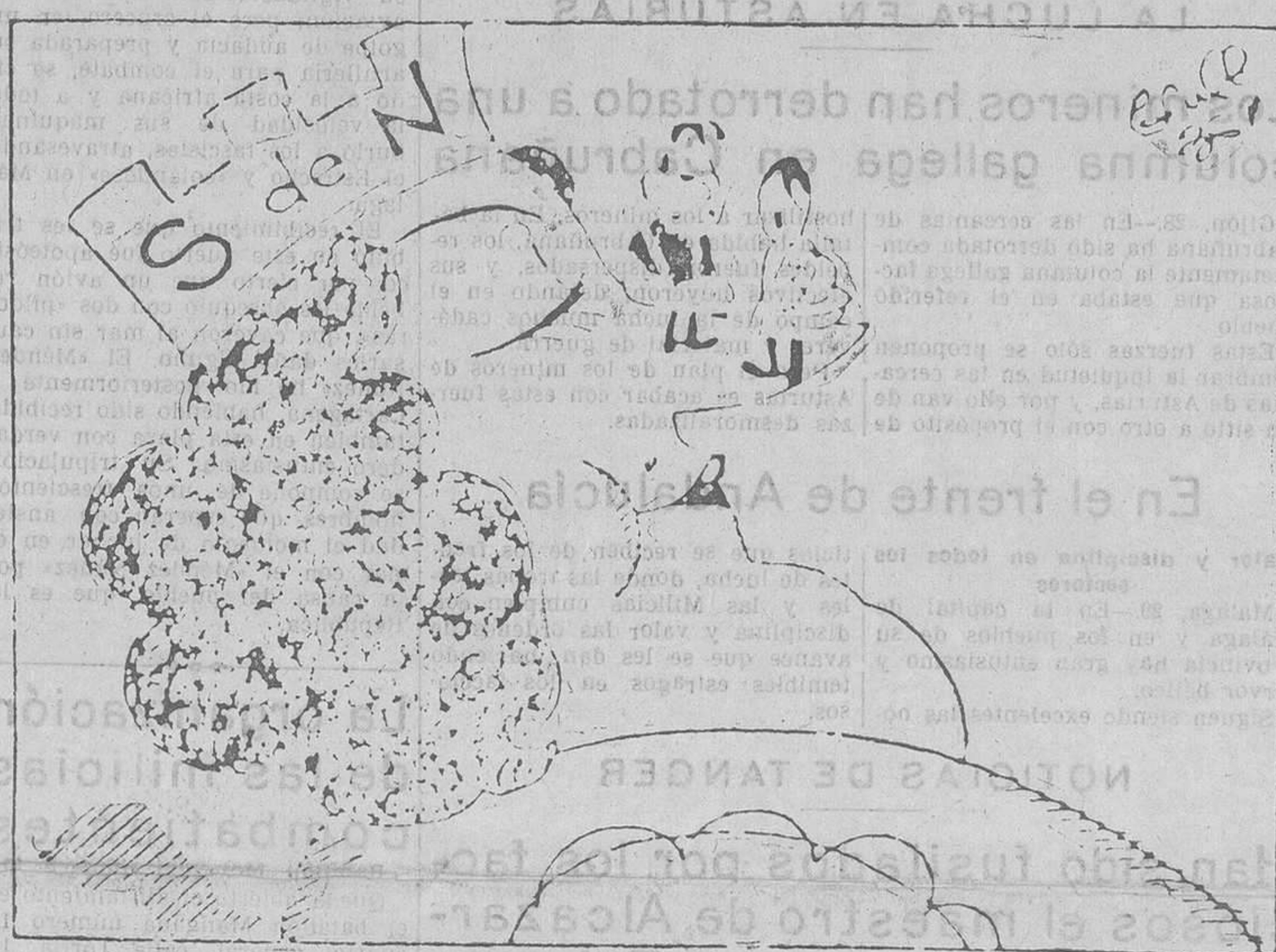
EXTASIS, por Bluff

Las actividades del Gobierno merecen, indiscutiblemente, la confianza que el pueblo tiene en él depositada. Su obra constructiva—todo o casi todo se lo encontró por hacer—ha de vencer obstáculos considerables. Y, sin embargo, es necesario que la realice con rapidez, obediente al imperativo categorico de las circunstancias. A los decretos constructivos debe seguir, en el menor plazo de tiempo posible, la declaración oficial de que han sido cumplimentados. La «Gaceta» no puede ser, como lo era en tiempos pasados—tiempos algunos, por desventura, dentro de la República y muy cerca de estos días dramáticos de la guerra encendida por el fascismo internacional—, una serie de páginas sin aliento, un fardo pesado de espíritu burocrático. Las disposiciones que contengan sus páginas han de ser cumplidas inmediatamente, eficientemente. Y ese decreto acordado ayer por el Consejo de ministros—militarización de las milicias—, base de un Ejército regular y garantía de un poder considerable, debe alcanzar en brevísimo plazo su máximo desarrollo. Entonces el pueblo en armas podrá considerarse absolutamente invencible.