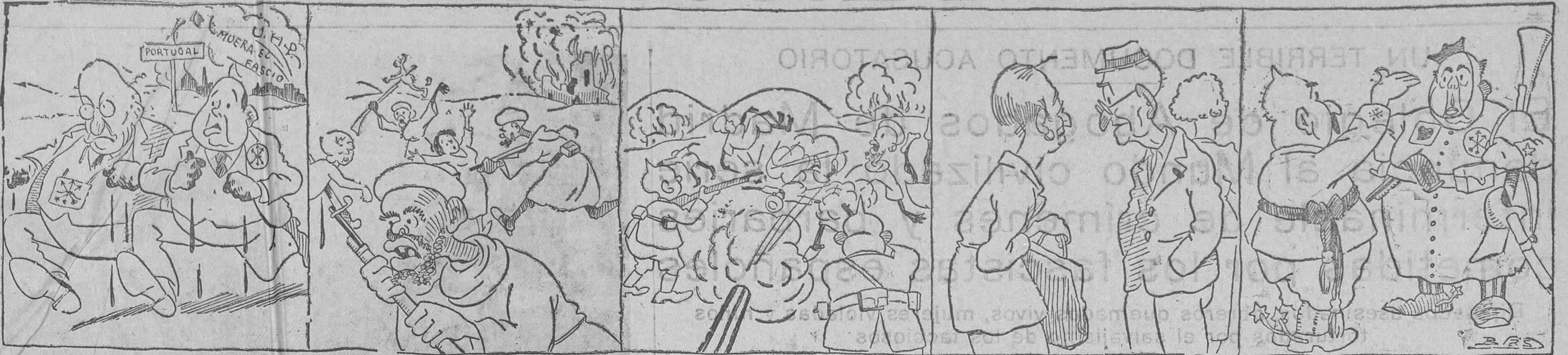
-El Mundo nos es pequeño, D. Ale.