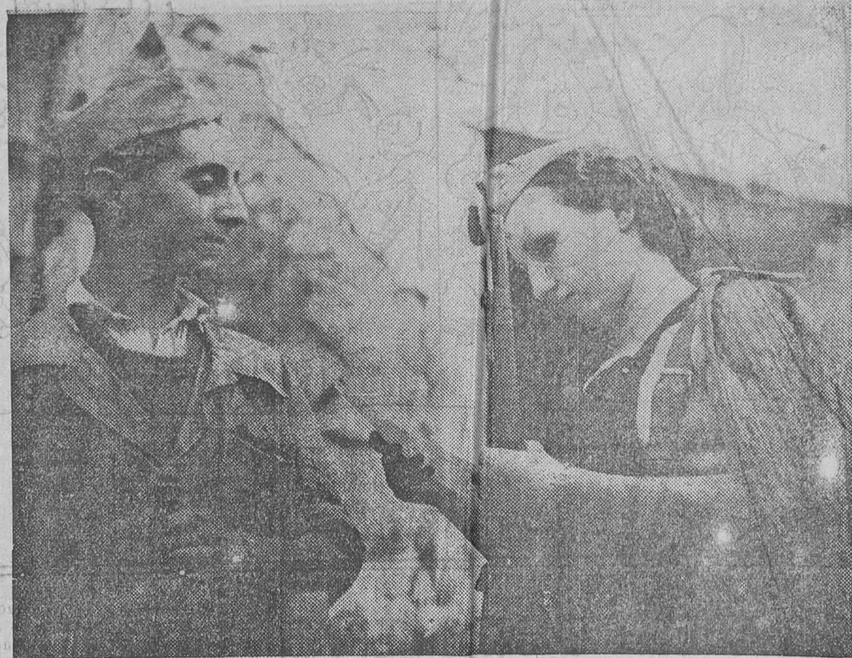
EN EL SECTOR DEL TAJO.—Una bella miliciana hace entrega de un recibo por la cantidad de nueve mil pesetas, que este miliciano encontró en una casa abandonada y que depositó en su Comité. Este acto pone de relieve, una vez más, la honradez que preside la actuación de nuestras milicias, tanto en el frente como en la retaguardia

El Gobierno legítimo de la República española, reflejo de las fuerzas parlamentarias recientemente elegidas con la garantía de sinceridad electoral, que significa la circunstancia de que di-