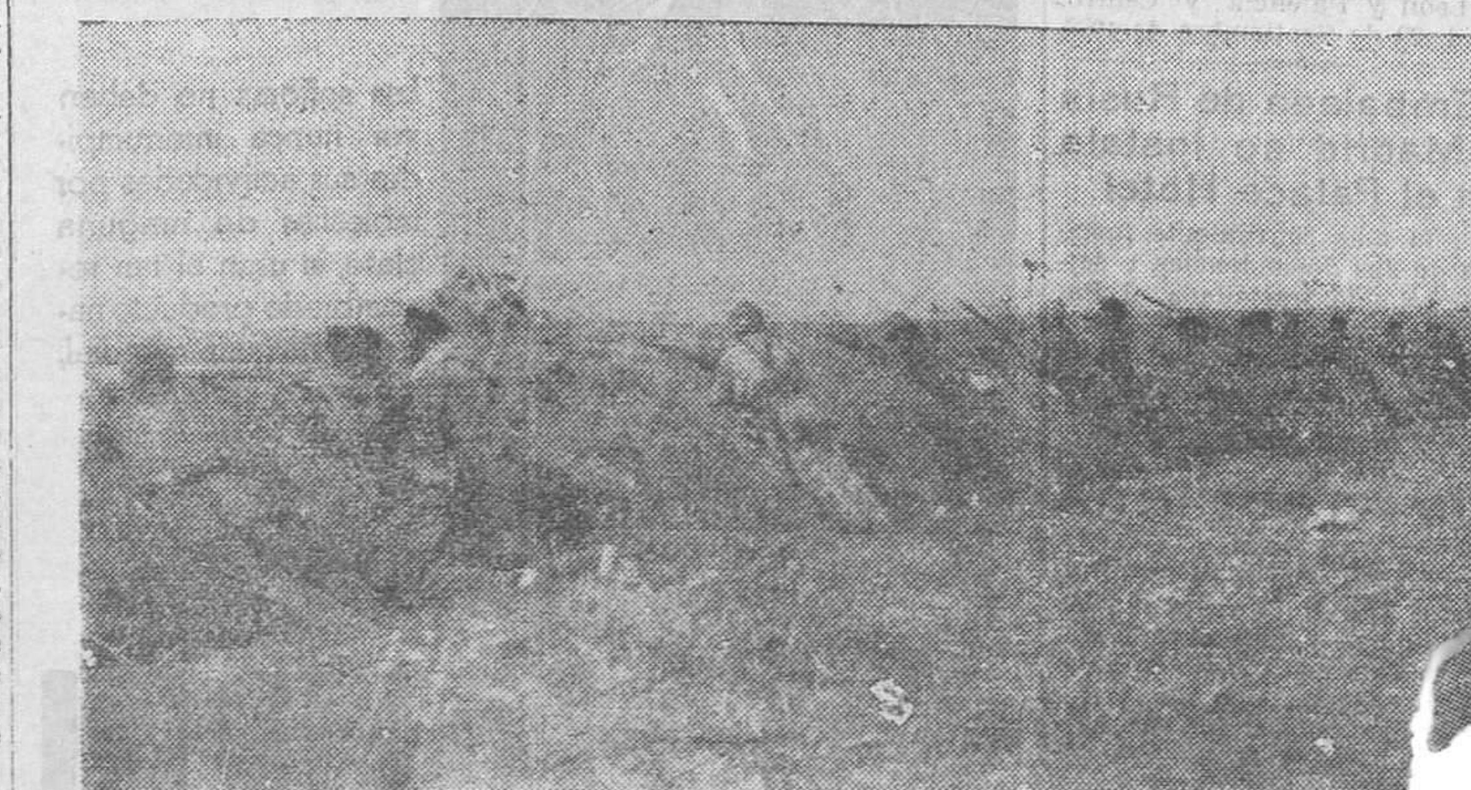
Una de nuestras avanzadillas, parapetada en la carretera, protege la marcha de nuestras fuerzas en el sector del centro

Al final de la reunión, el Sr. Monteiro, representante portugués, expresó su satisfacción por el resultado de la reunión.