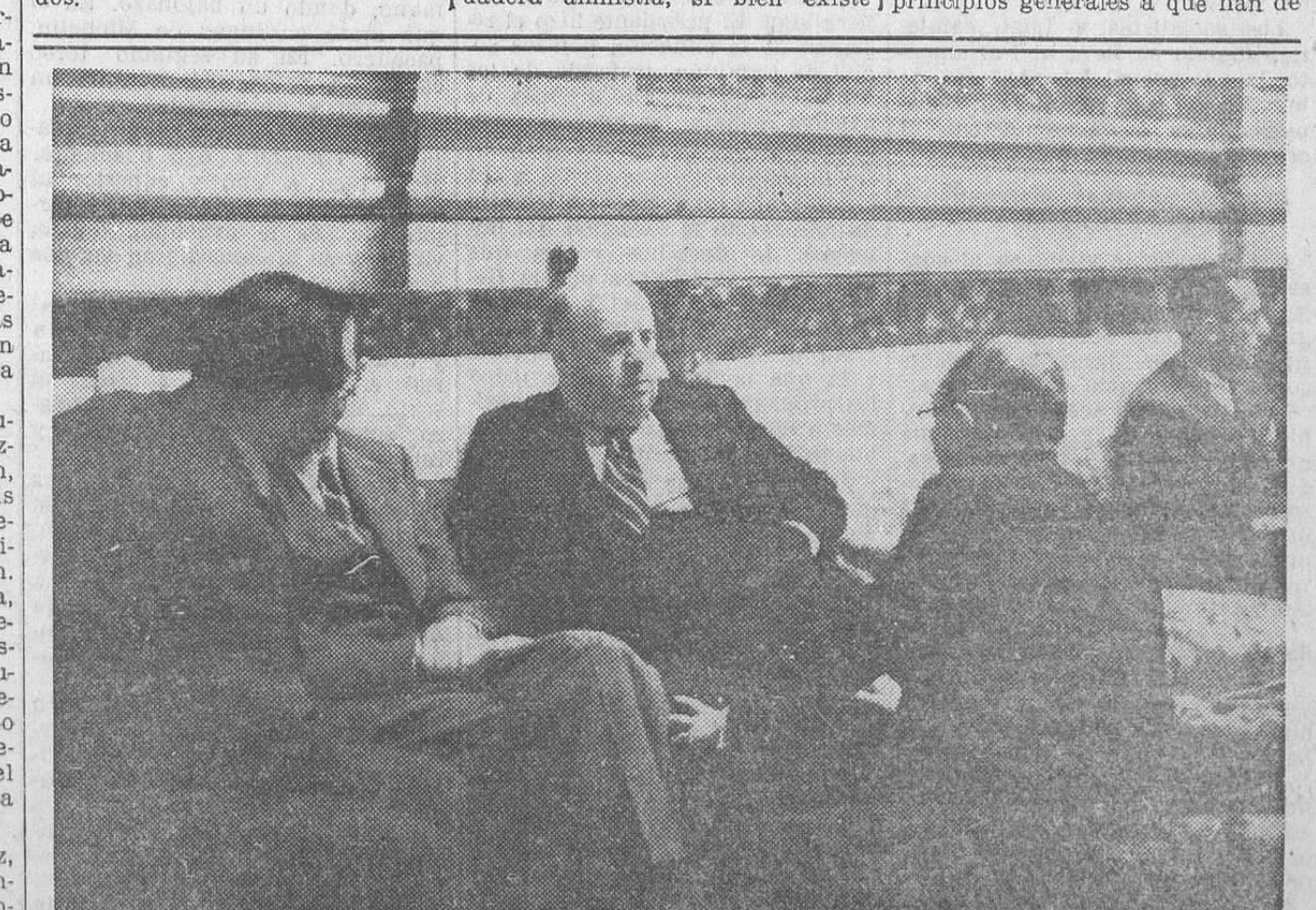
AYER EN EL CONGRESO.—Segunda parte de la conferencia, aumentado el grupo con la presencia del ministro de la Gobernación