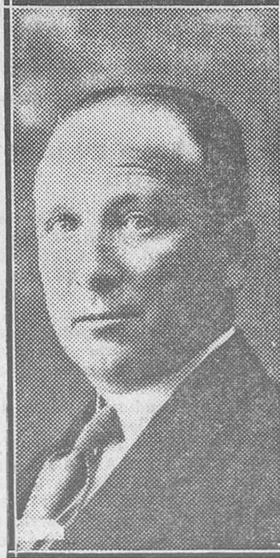
Francisco Largo Caballero

Ramón González Peña, presidente de la Ejecutiva del partido socialista