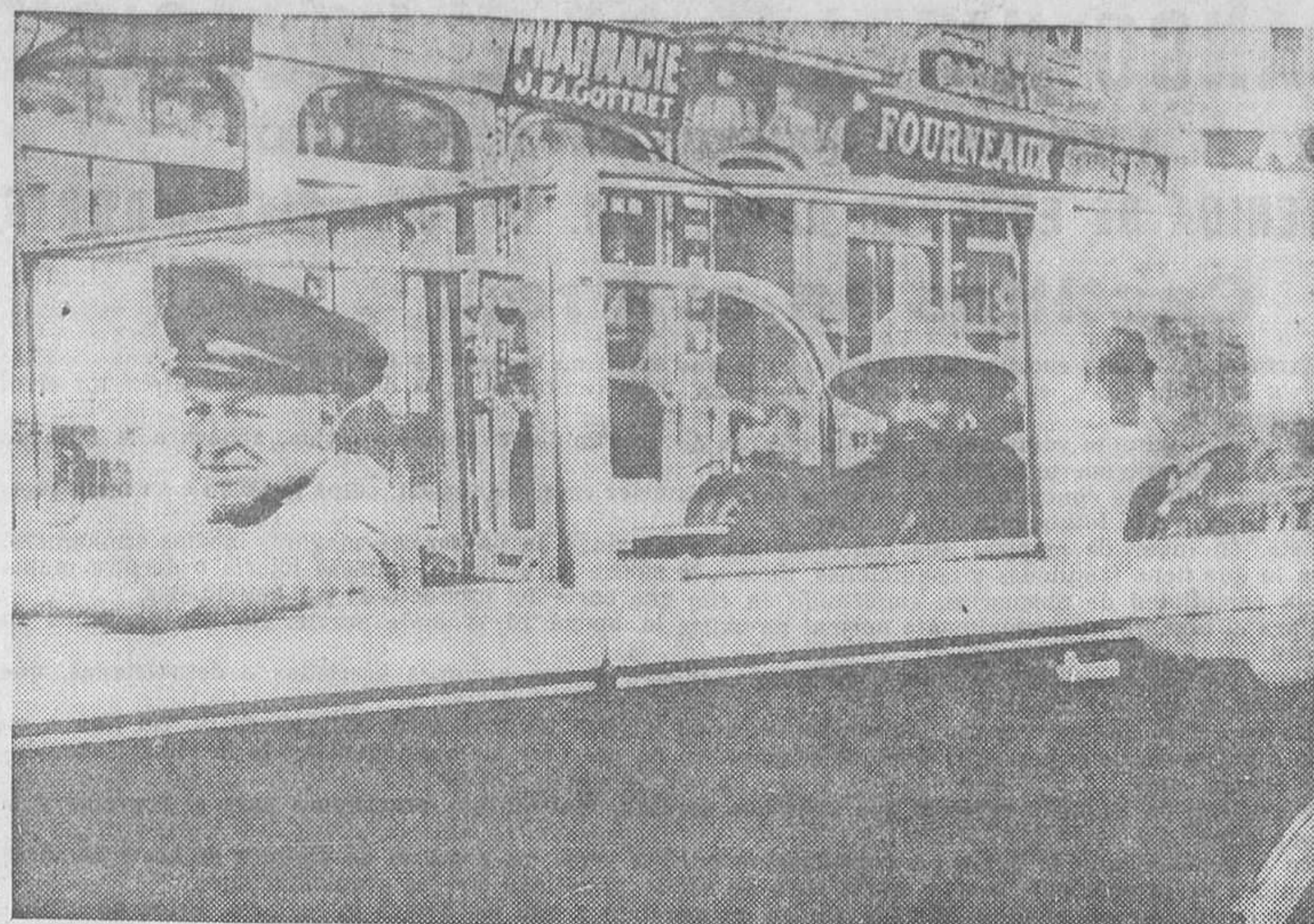
La picaresca es internacional, y por ahí fuera hay cada sirvergüenza que merece un monumento. Y uno de los más modernos es este que aparece en la fotografía, el que sabiendo la fecha de llegada del Negus de Abisinia a Ginebra, se presentó en las calles de la ciudad suiza, barbudo y majestuoso, en un lujoso automóvil, estimulando ser el emperador de Abisinia. Y llevó la farsa más adelante, pues se permitió ir a depositar una corona ante el monumento de la Reforma y se hizo recibir por las autoridades ginebrinas. ¡Ya supondrá el lector los consejos paternales que le habrá dado después la Policía suiza!...

Por encargo del Centro Oficial de Contratación de Moneda se ruega a los españoles tenedores de créditos retenidos en Austria y en Hungría se sirvan producir en la Secretaría de esta Cámara, Barquillo, 13, antes del día 9, una información relativa a dichos créditos, en la que se exprese el nombre del acreedor, nombre del deudor, fecha del envío de la mercancía cuyo valor ha sido retenido y cantidad retenida.