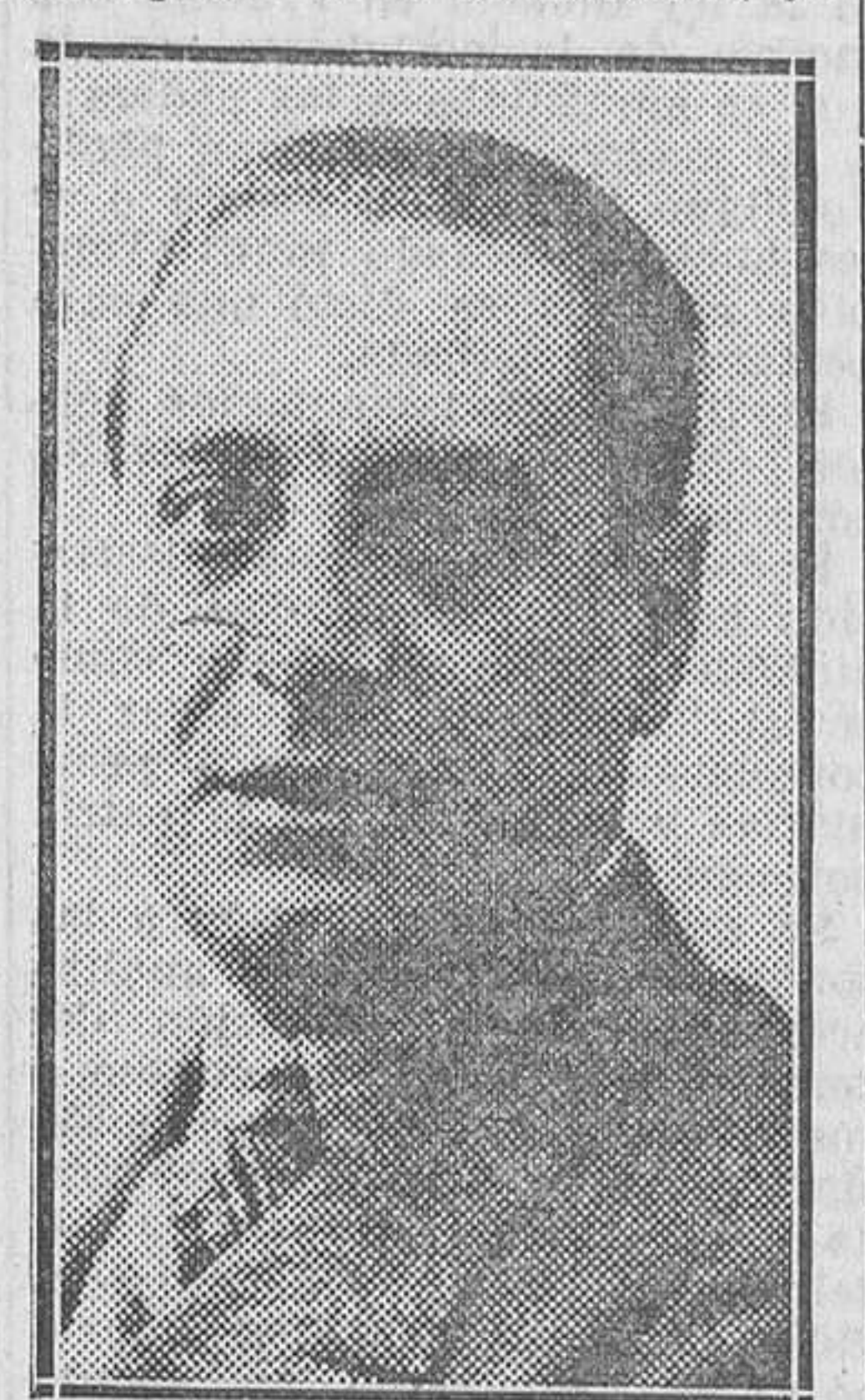
Luis Jiménez de Asúa

Al acto asistió numerosa concurrencia. El conferenciante pone de manifiesto en primer término que ha sido invitado por el Instituto del Libro para dar la conferencia, ya