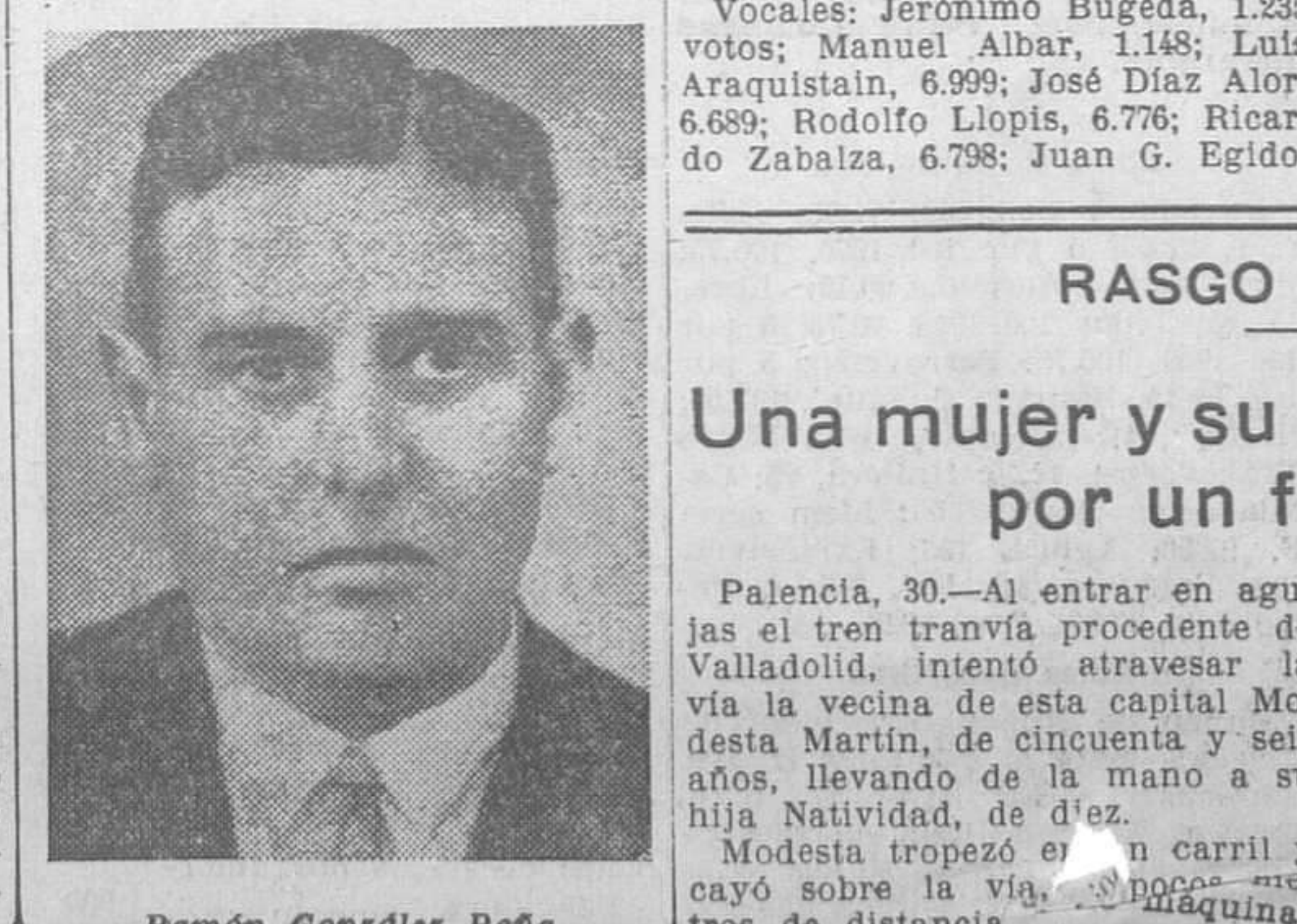
Ramón González Peña