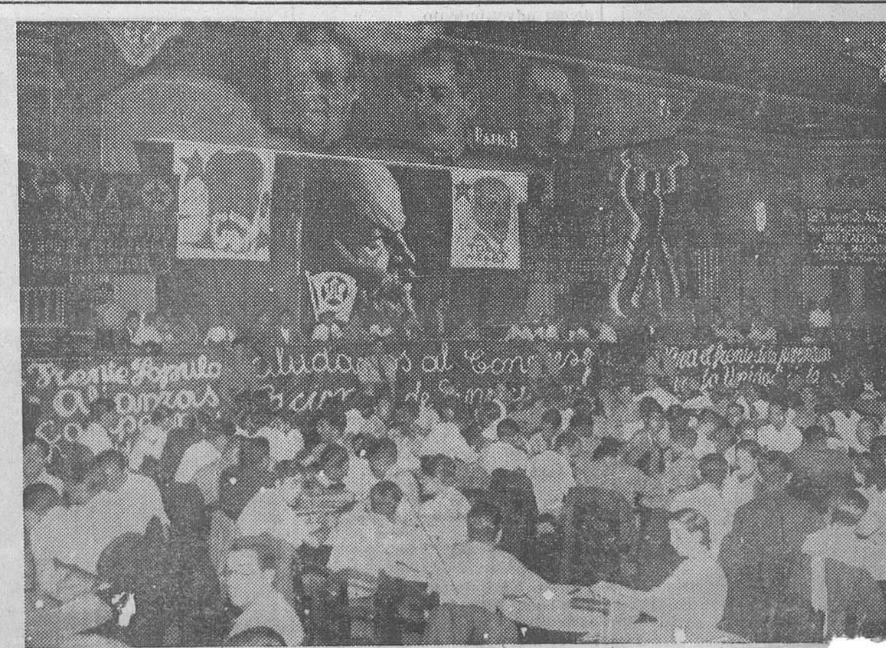
Aspecto de la sala del Metropolitano durante las sesiones del Congreso local de unificación ventuales socialistas y comunistas

En momentos como los que vivimos, en que el caciquismo y la reacción causan diariamente en nuestro país nuevas víctimas, y en que el fascismo internacional persigue ferocemente toda idea de democracia y libertad, el Patronato llama a todos los organismos antifascistas, a todas las personas de conciencia humanitaria y libre, a apoyar al Congreso nacional de la Solidaridad, como jalón decisivo para la constitución en España de la única organización de ayuda y solidaridad.»