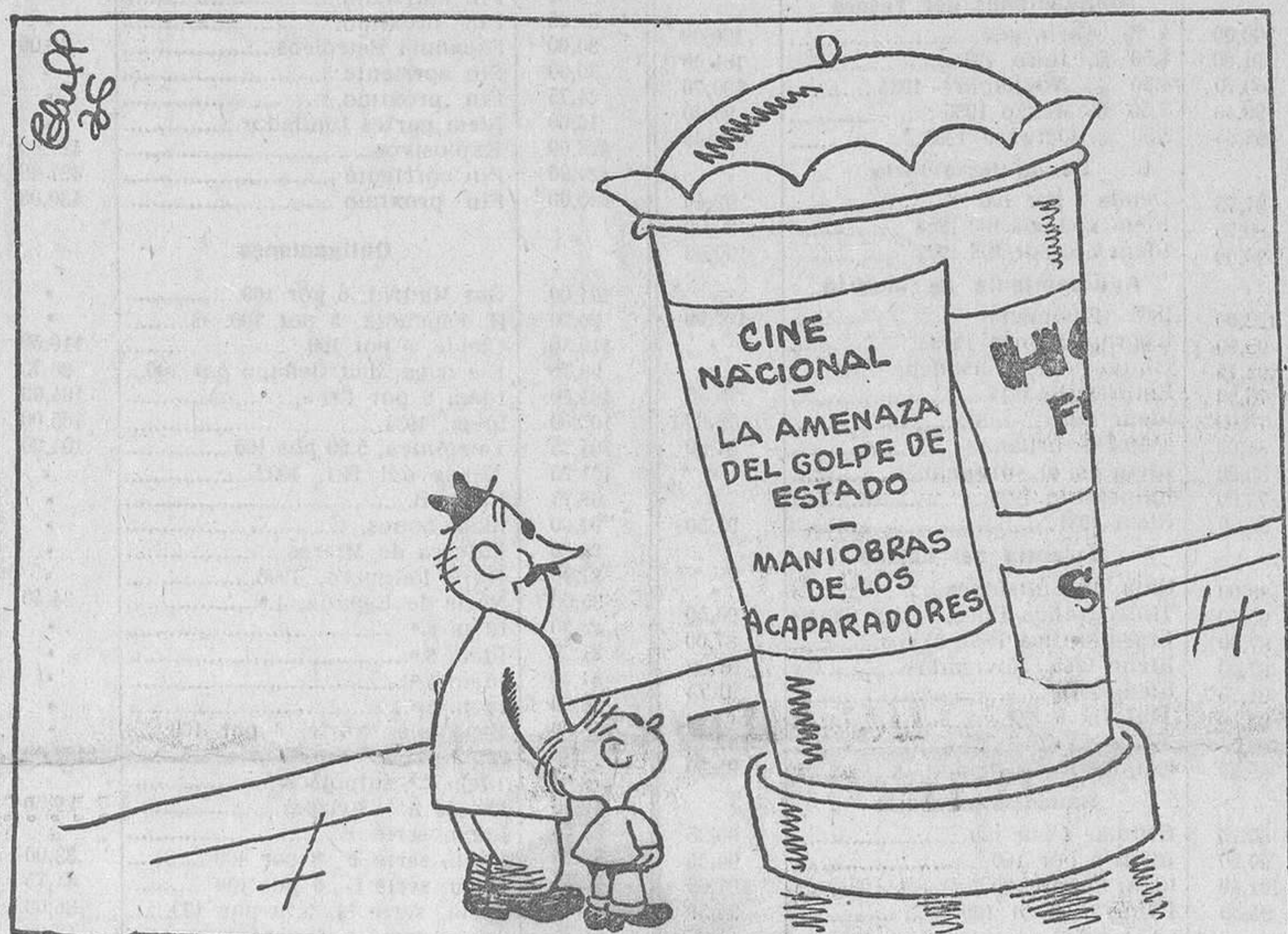
ACTUALIDADES DE LA SEMANA, por Bluff —Mira, mira... Una de miedo y una de ladrones...