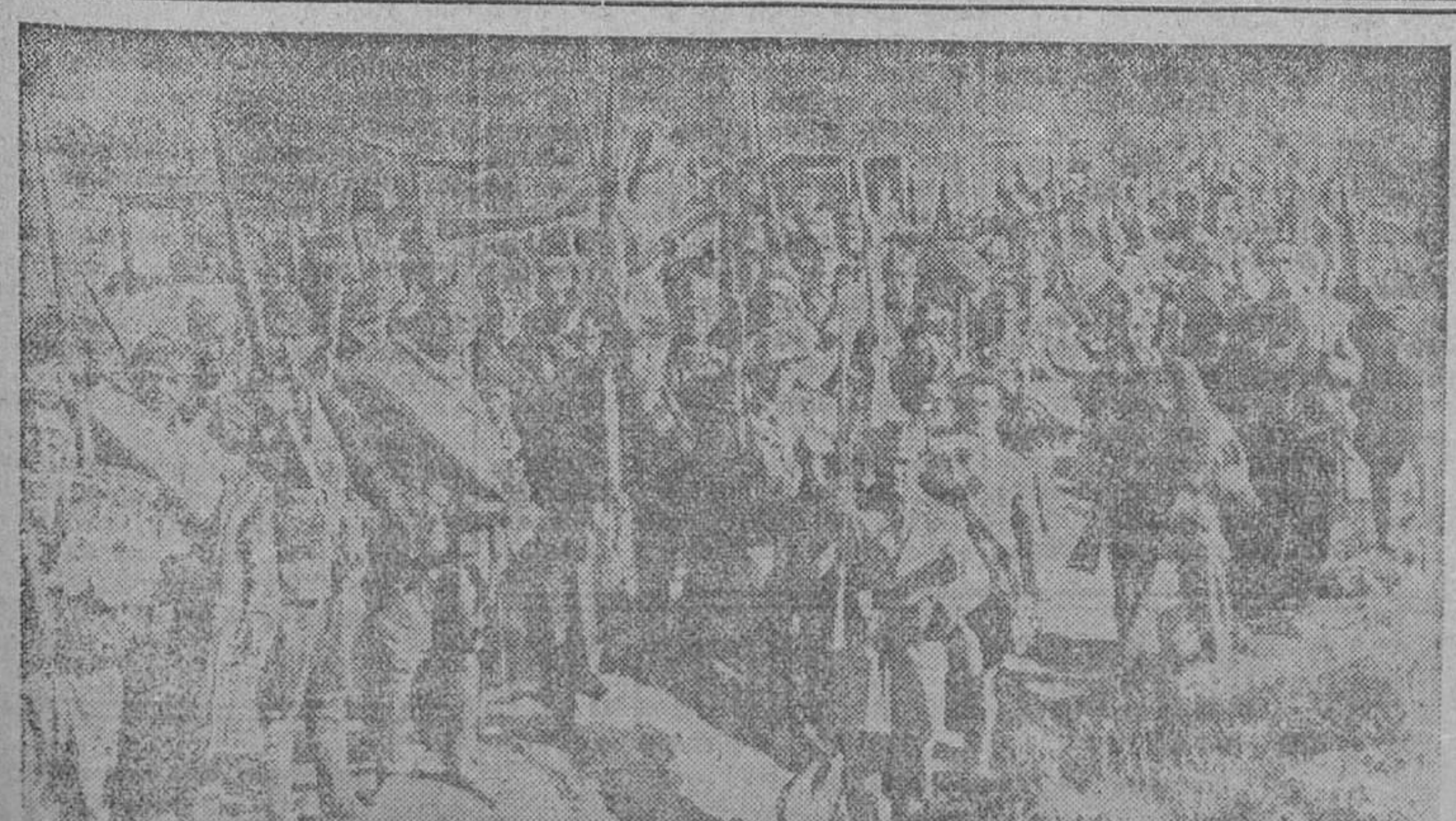
LA OFENSIVA DEL EJERCITO DEL PUEBLO.—Una de las columnas que tan heroicamente combaten en el sector del Centro muestra su júbilo por la triunfal jornada de ayer, primer escalón de la victoria total.

Majestuosamente, los tanques cruzaron ante la pasividad de aquellos hombres las líneas de