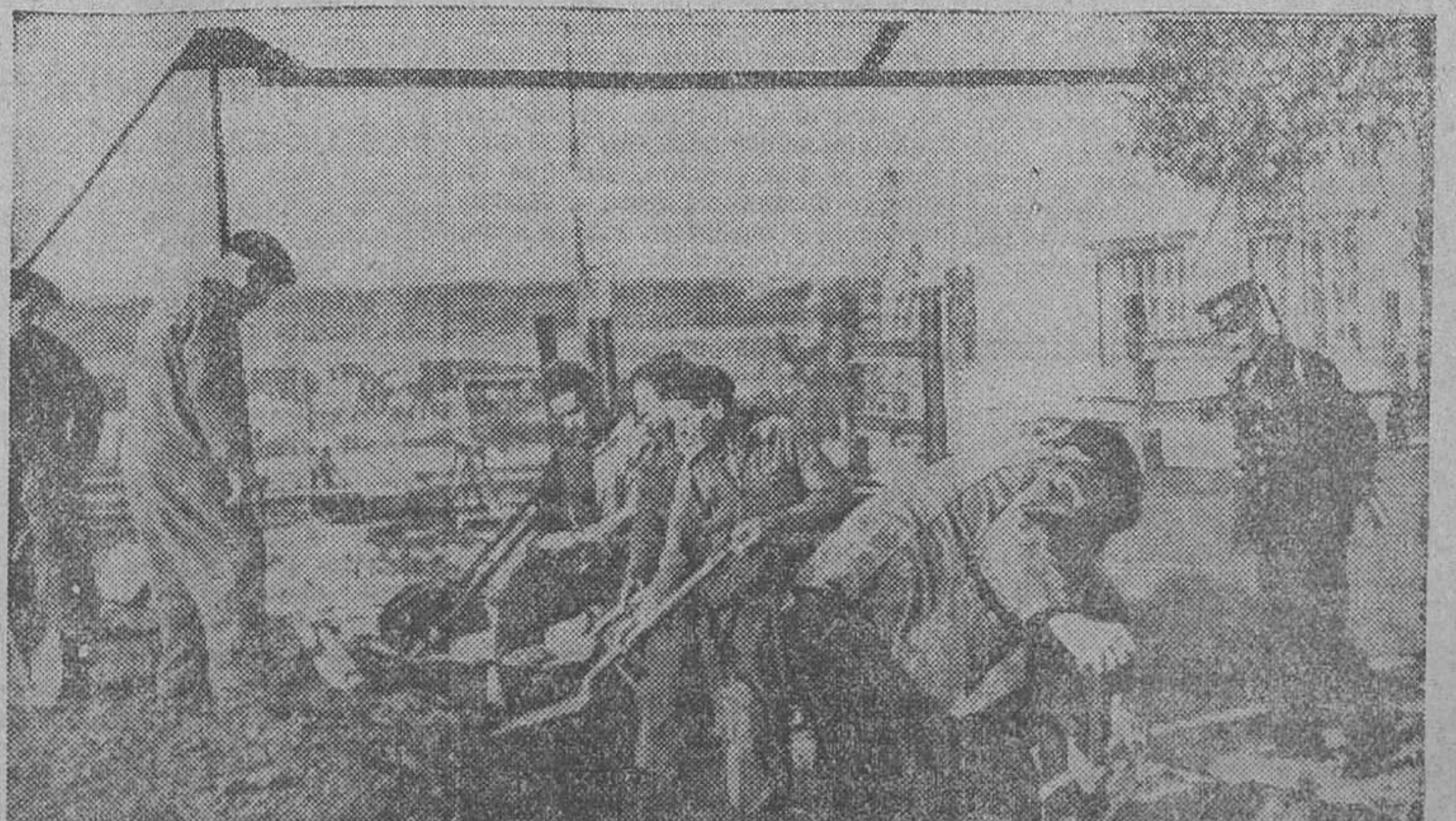
MADRID EN PIE DE GUERRA.—Los obreros ferroviarios fortificando contra los vuelos aéreos facciosos.