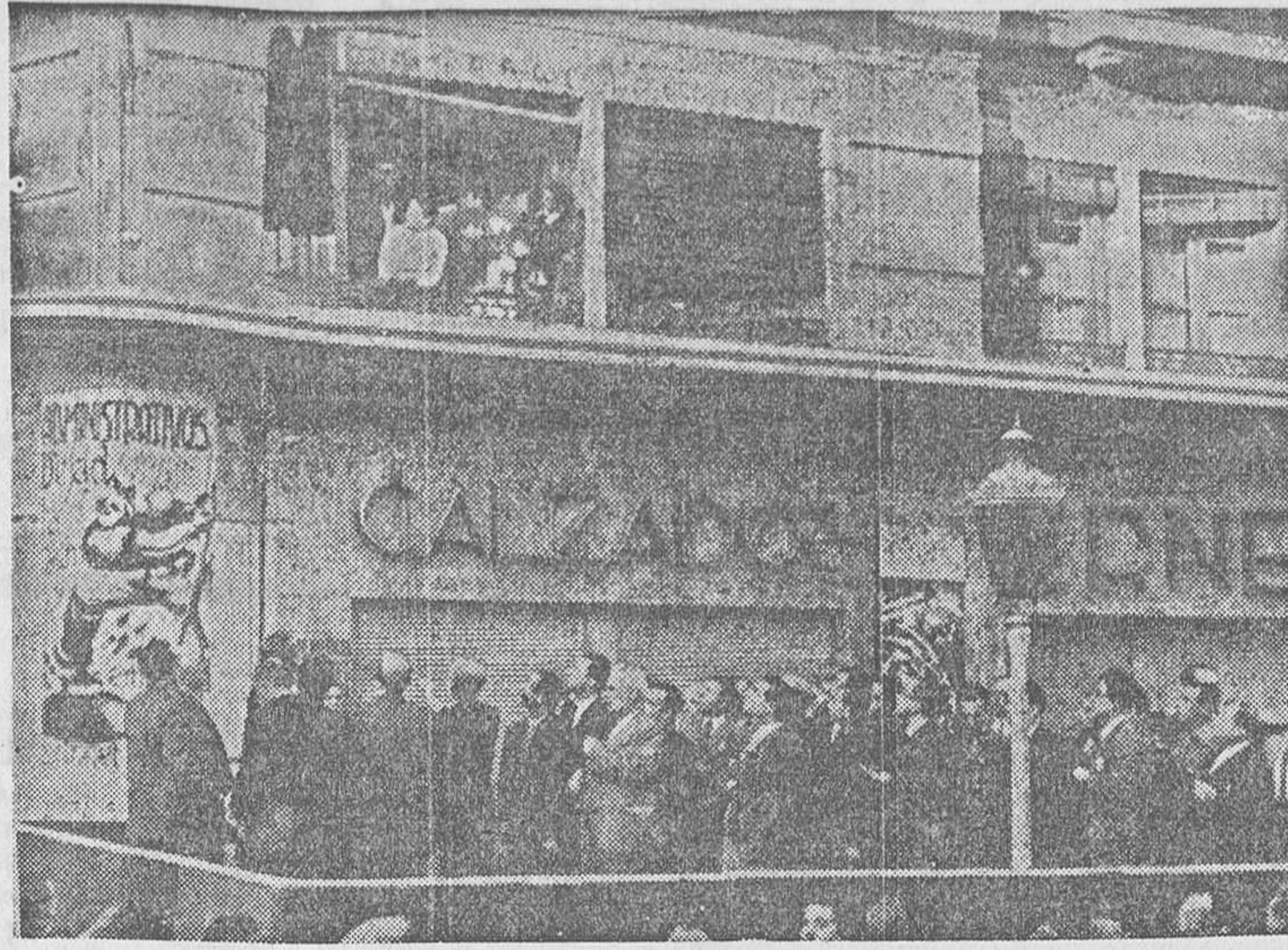
VALENCIA.—Acto de descubrir la lápida que da el nombre de Luis de Sirval a la antigua calle de las Barcas (Fot. Finesas.)

No. Lo que ocurre es que Inglaterra y Francia—sus Gobiernos, más exactamente dicho—olvidaron los deberes democráticos en un colapso de amnesia producido por el miedo a la conflagración europea, y Alemania, Italia y Portugal viven en una amoralidad producto de ambiciones nacionalistas que las empujan a someter a la codicia propia el derecho de gentes. Lo que ocurre es que vivimos una hora grave y pavorosa que se la quiere convertir en la de la quiebra de la democracia universal, y, emprendida la carrera, se saltan los estorbos sin preocuparse más que de hacerlos desaparecer. El antifascismo español es uno de esos estorbos, y el imperialismo europeo osa aplastarlo. Para conseguirlo no importa cómo. Si hay que truncar las tradiciones democráticas inglesas y francesas, se las trunca, esgrimiendo la falsedad e incurriendo en el atropello; si hay que desatar el ansia invasora de los países fascistas, se la desata, perpetrando criminal colaboración contra un Gobierno legal. Lo importante, lo necesario, es lograr el objetivo, y para ello se utiliza, por lo pronto, ese desdichado Comité de Londres, que dejará en los anales de la diplomacia un deplorable recuerdo de celestino desaprensivo e indignante.