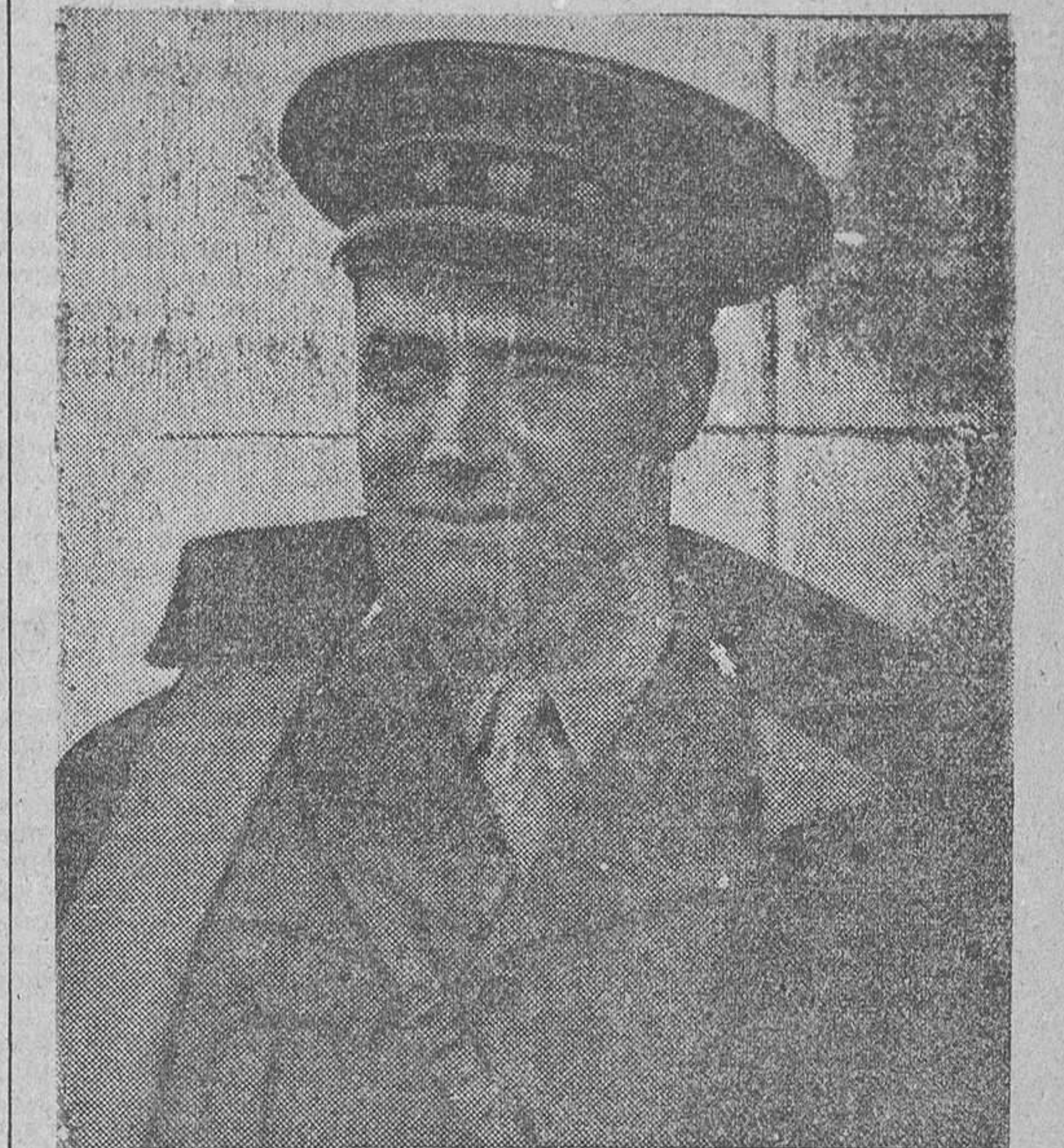
El heroico general Asensio, nombrado por decreto de ayer subsecretario del ministerio de la Guerra

Ayer mañana facilitaron en el ministerio de la Guerra las disposiciones siguientes, que afectan a cargos militares: