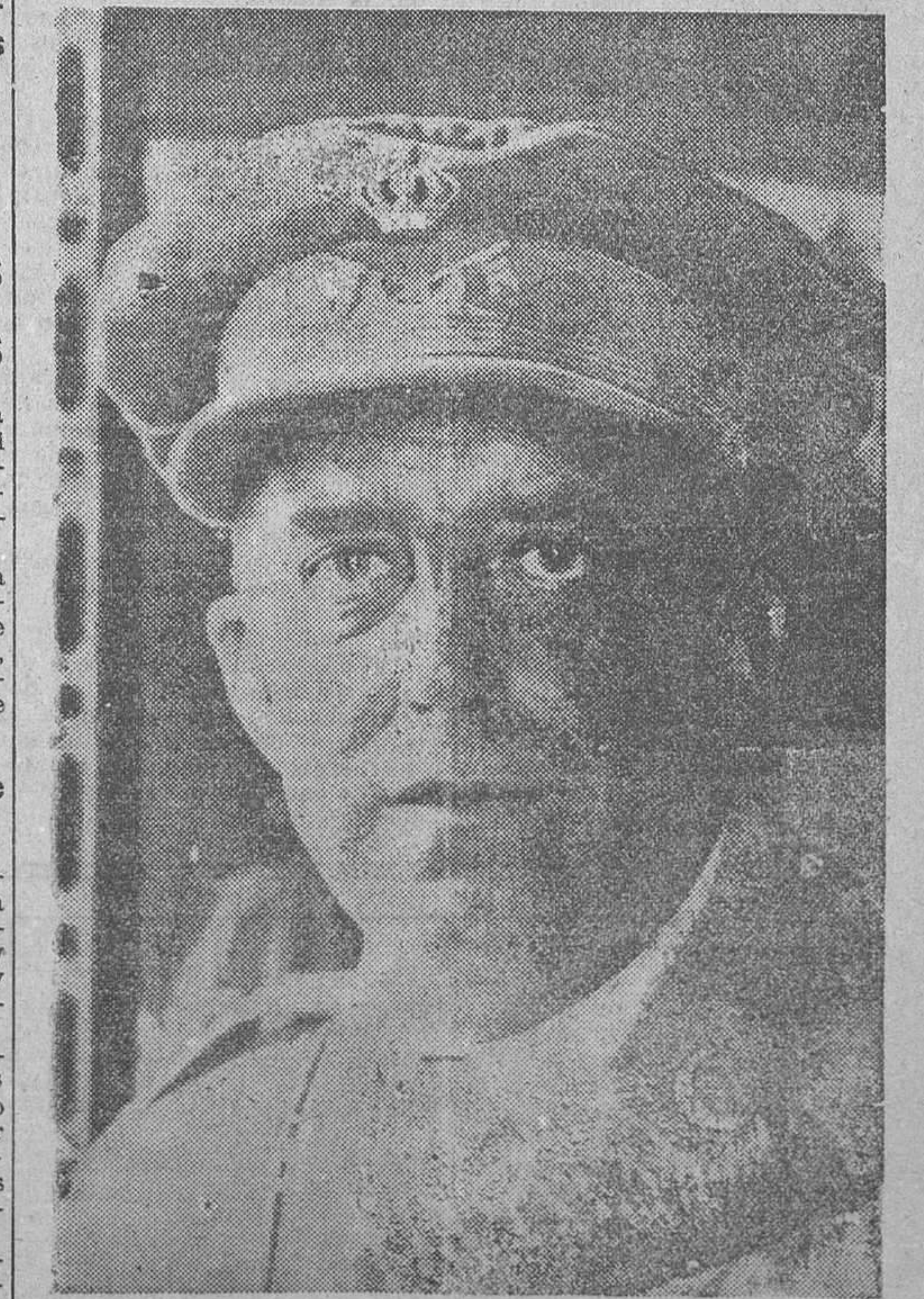
El ex ministro de la Gobernación general Pozas, designado jefe de las fuerzas que operan en el sector del Centro

SI MADRID NO GONTASE CON MADRILEÑOS PRONTOS A DISPUTARLE AL EJERCITO REACCIONARIO EL SUELO NATIVO, PULGADA A PULGADA, ESTARIA DEFENDIDO CON ENTUSIASMO POR LOS HIJOS DE LAS DEMAS PROVINCIAS ESPAÑOLAS. PORQUE MADRID ES TODA ESPAÑA