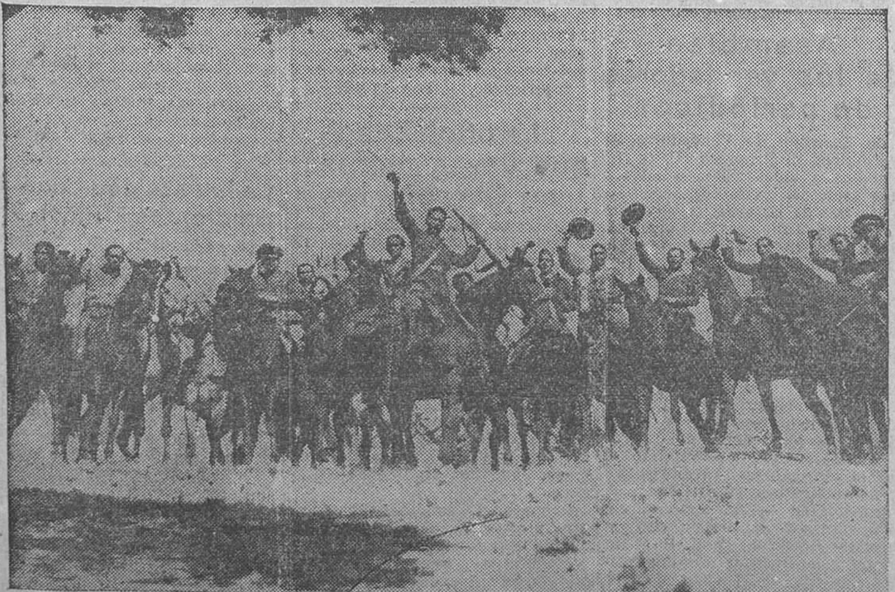
EL GLORIOSO CUERPO DE CARABINEROS.—Entusiasmo delirante al terminar una intervención, en la que se quebrantó grandemente al enemigo en un reciente combate en el sector del centro