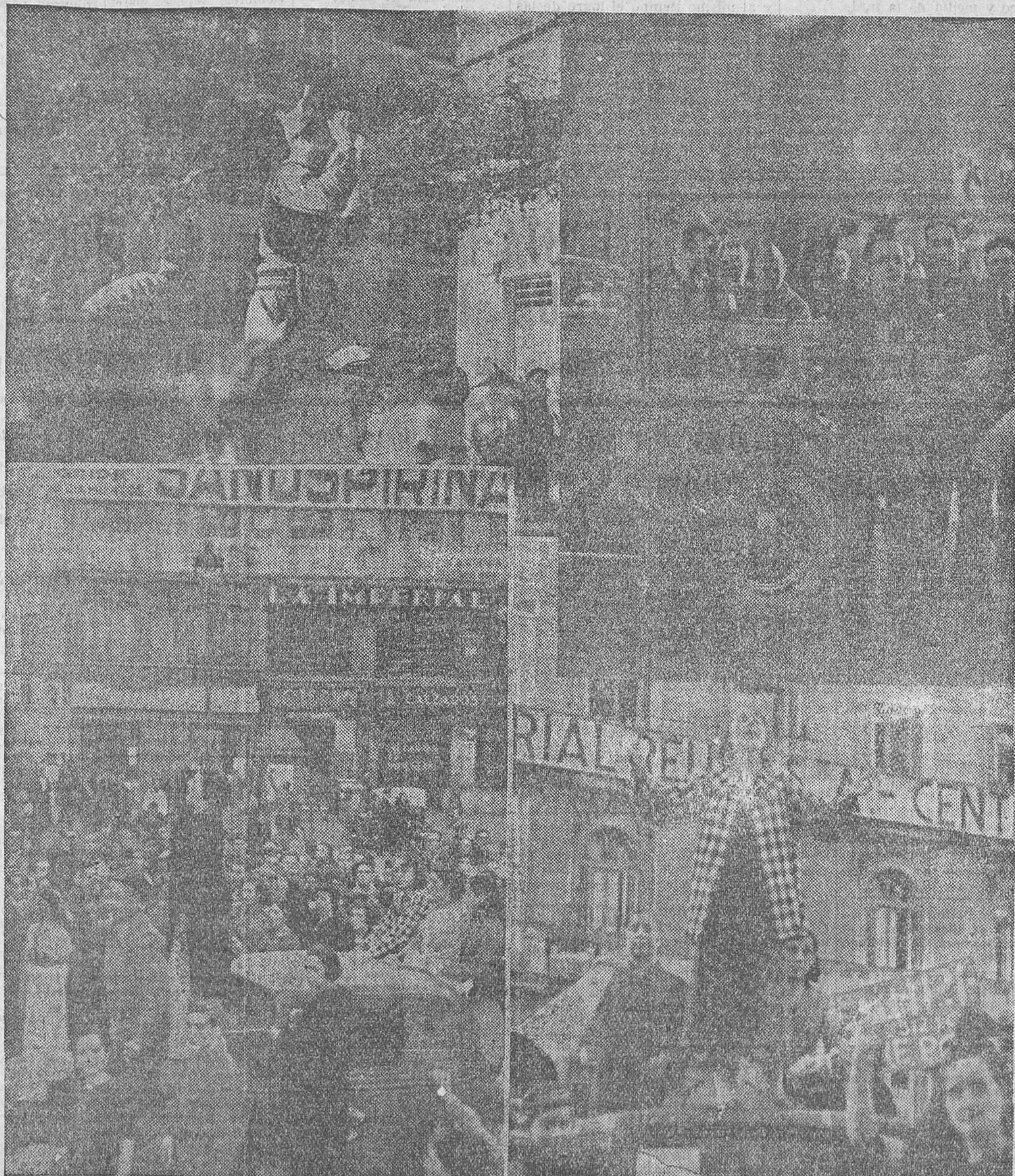
Madrid hierve en entusiasmo popular. Se ha puesto en pie en defensa de sus libertades amenazadas y ha adquirido el gesto que la gravedad de las circunstancias aconseja. El panorama de nuestras calles en los tres últimos días refleja con exactitud el firme propósito del pueblo madrileño de cerrar el paso a la bestia negra del fascismo y enterrar para siempre en las inmediaciones de nuestra capital las ansias estúpidas de traidores y mercenarios. Los presentes documentos gráficos son una débil muestra de la agitación en la capital de la República durante el día de ayer

DEFENDEMOS A MADRID LEJOS DE MADRID, PORQUE QUEREMOS CEBRAR LA VICTORIA EN LA CIUDAD INTACTA. EL TRIUNFO ENTRE RUINAS DE ELLA TENDRIA PARA LOS MADRILEÑOS UNA PUNZADA DE DOLOR