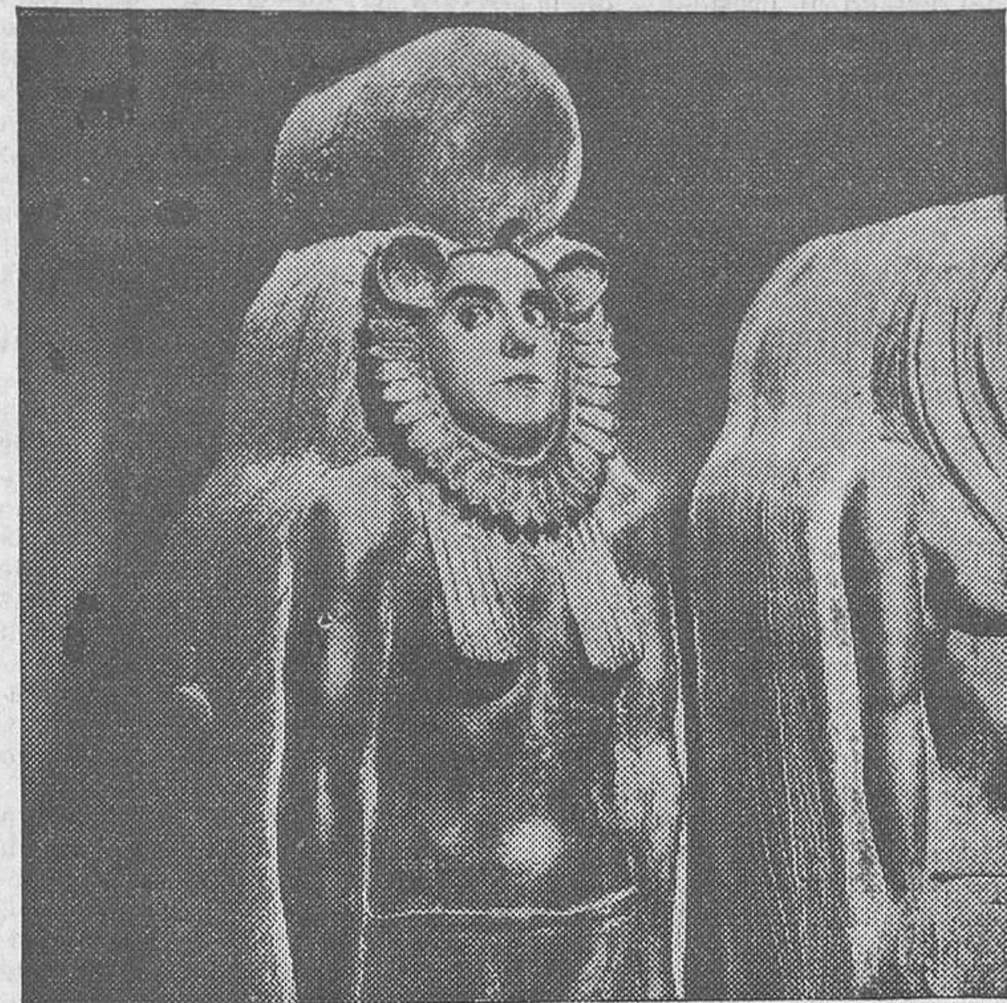
Eddie Cantor en el film de Artistas Asociados «El chico millonario», que se estrenará mañana viernes en el Capitol