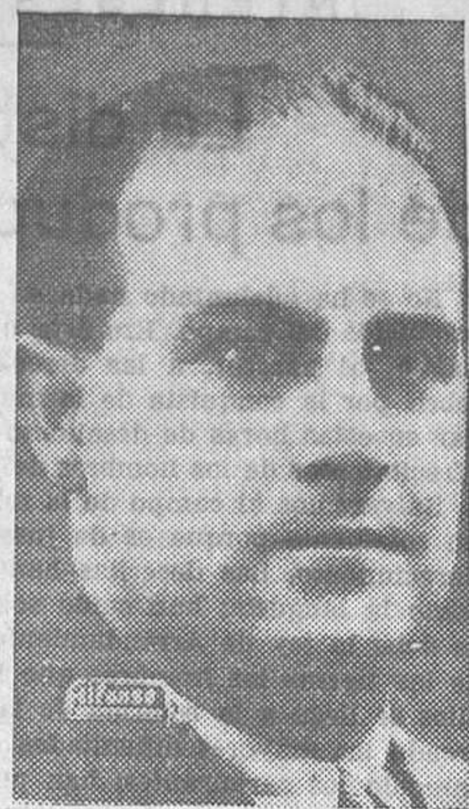
Don Aurelio Lerroux

Ha visitado al subsecretario de Obras públicas una Comisión de dichos auxiliares para rogarle el apoyo en su deseo de que se los coloque en el lugar que les corresponde en su escala, y, por tanto, se les hagan efectivos los sueldos a que tienen derecho y que ahora no disfrutan por hallarse postergados desde que se restablecieron las plantillas en Enero último.