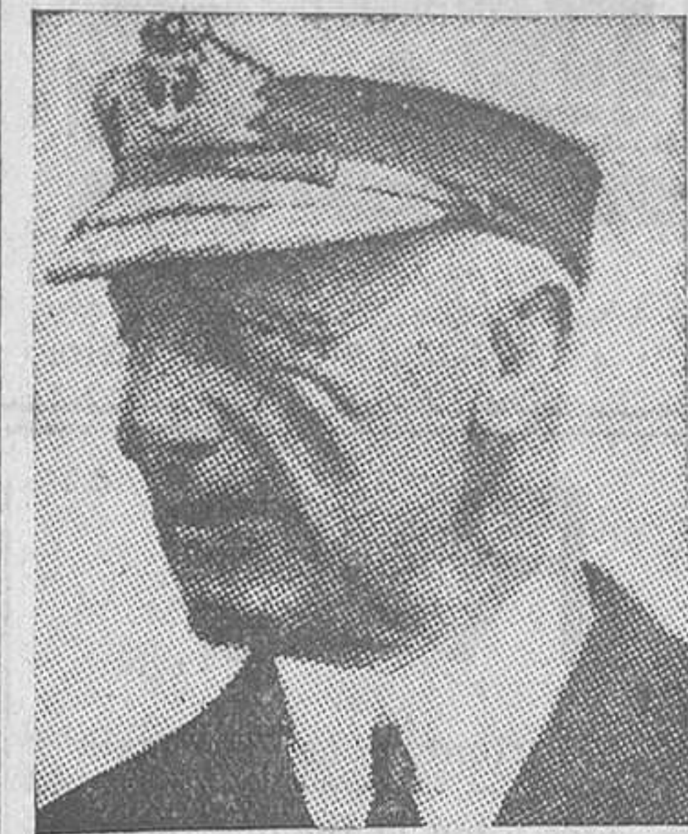
El almirante Jellicoe

Londres, 20.—A la edad de setenta y cinco años ha fallecido el conde Jellicoe, almirante inglés, a consecuencia de un resfriado que cogió el día del armisticio. Juan Ruthworth Jellicoe nació en 1859, ingresando en la Marina a la edad de trece años. Sirvió en la campaña de Egipto de 1882. Posteriormente ingresó en la Escuela Naval. Sirvió en China de 1898 a