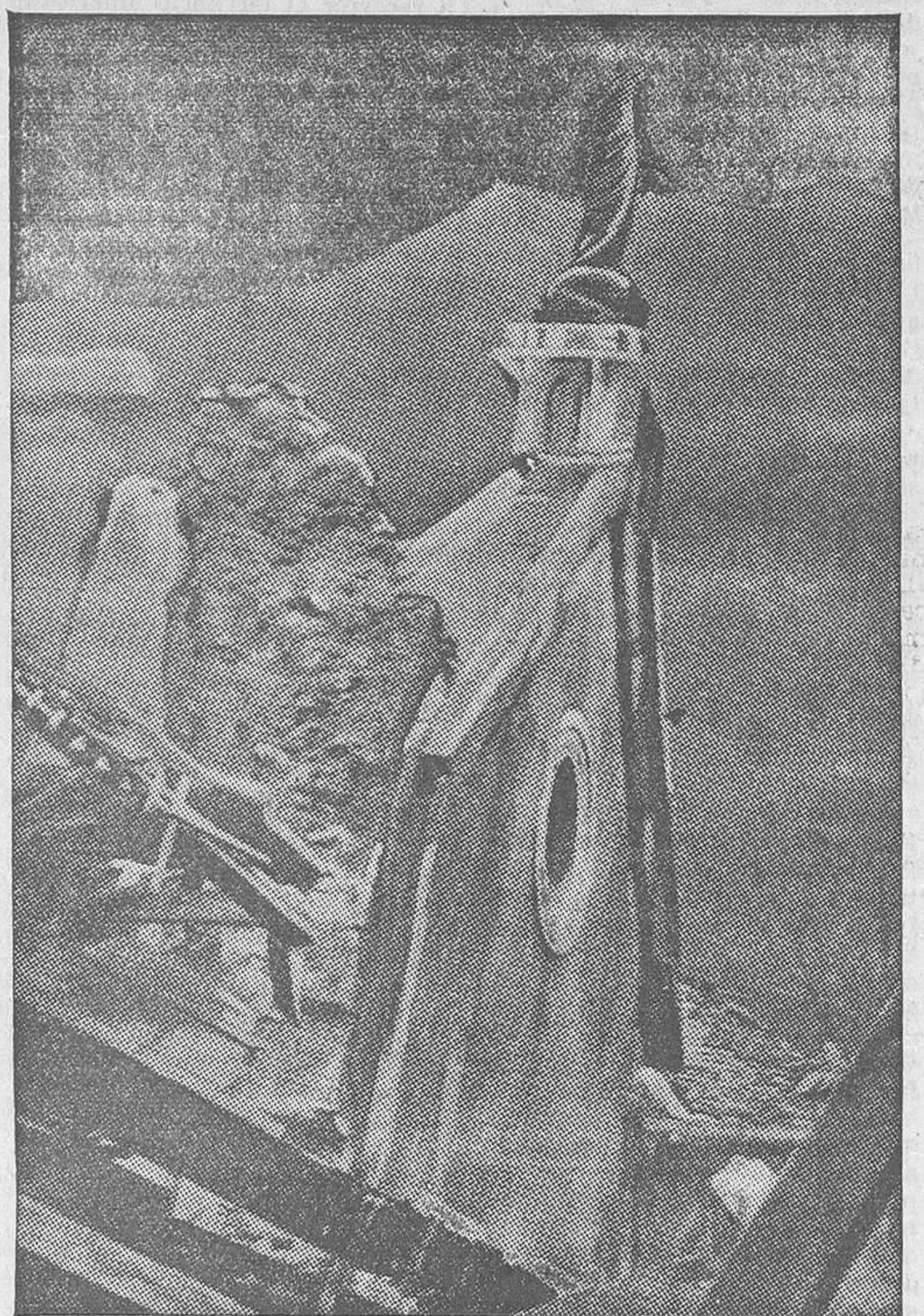
Hace dos días, en Grenoble (Francia), un desprendimiento de tierras hizo que una enorme masa de piedras cayese sobre la célebre destilería donde los padres cartujos fabrican el licor universalmente conocido. La destilería quedó destruida, y el edificio central comenzó a sufrir la presión de los materiales acumulados. Las pérdidas se calculan en 38 millones de francos, comprendida la maquinaria y las existencias de licores, que valen unos 10 millones.