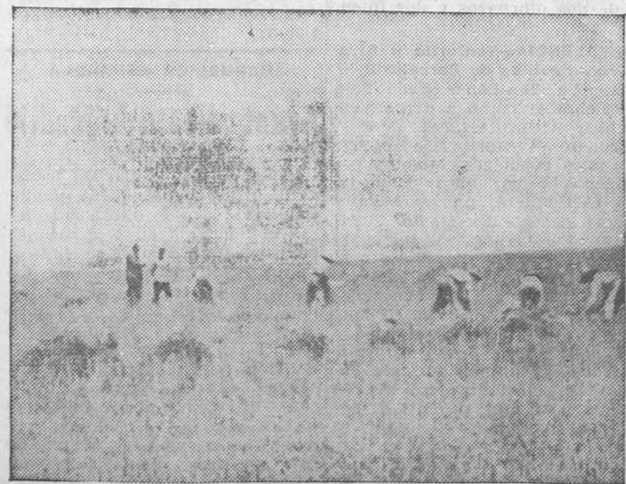
Comenzando la siega. Por fin, el fruto logrado

se morían de hambre y miseria. Y cuenta que el préstamo que el Instituto dió para ser devuelto en dos años lo fué en el primero, dando con ello muestras del espíritu de seriedad y sacrificios que ello significa... ¡Cuántos y cuántos sacrificios!