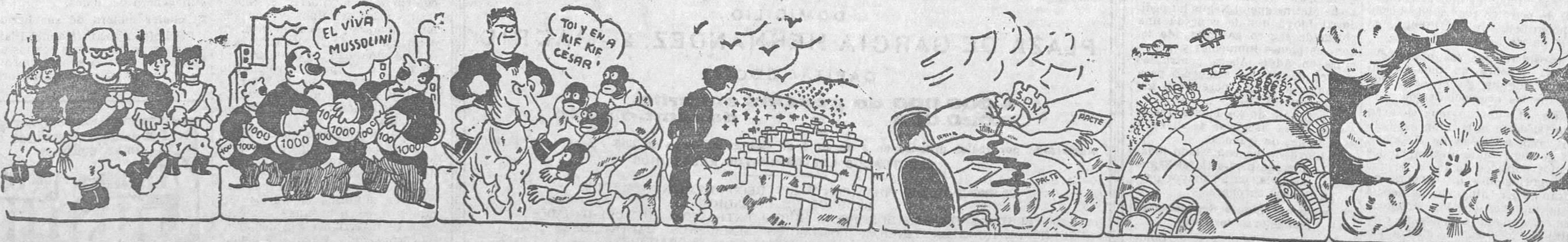
«Ocurra lo que ocurra—ha declarado Mussolini—iremos hasta el fin.»