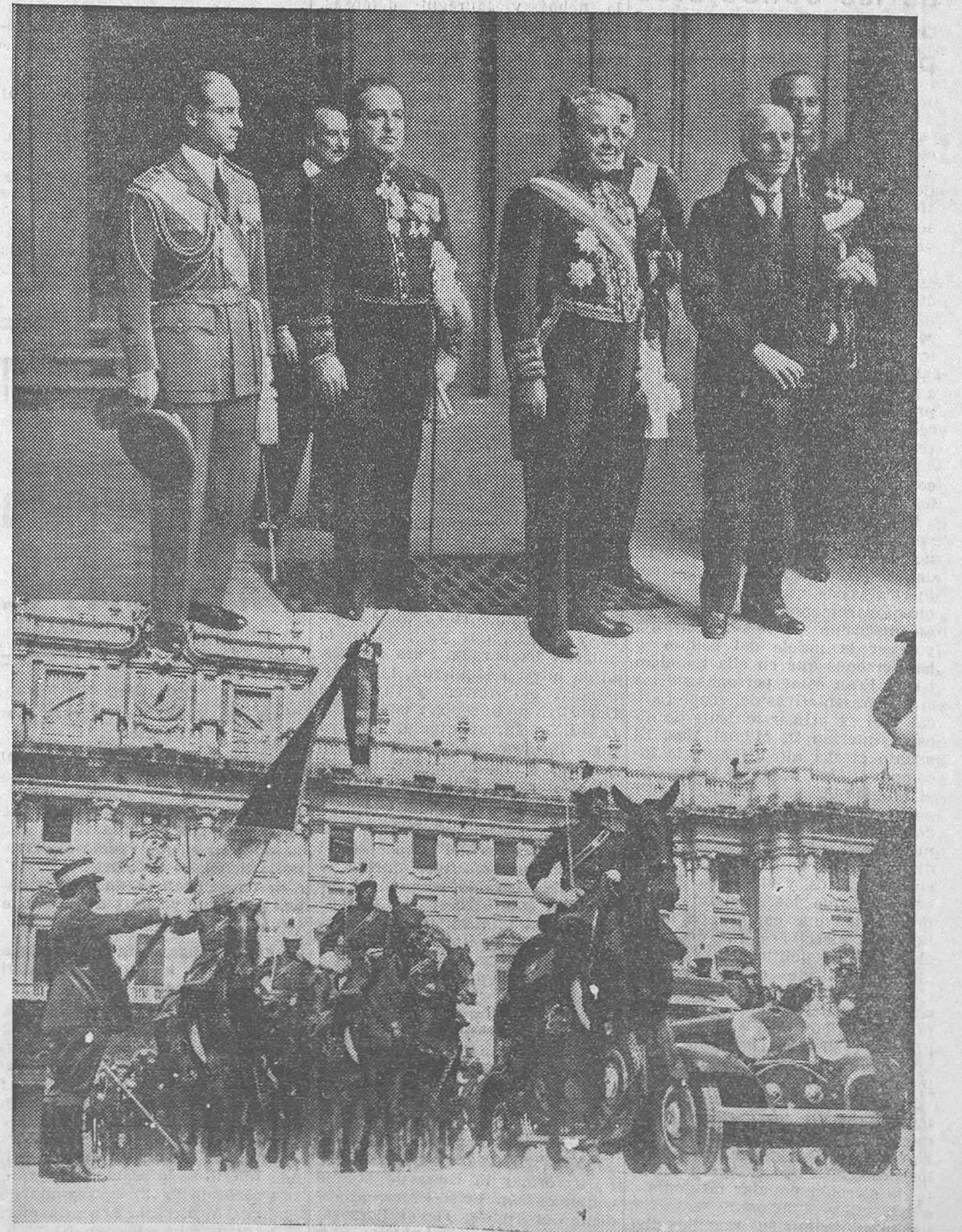
El nuevo embajador de Italia en España, acompañado de los agregados de la Embajada, al salir de presentar sus credenciales a su excelencia el presidente de la República. Abajo, el nuevo embajador abandonando el Palacio presidencial