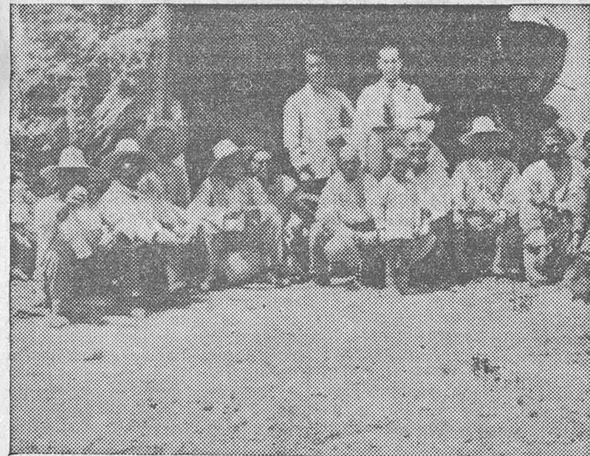
Un grupo de «kokoljistas» descansan de su agobiante trabajo

Instituto fueron depositados en la citada Sociedad 15 vagones de trigo, unos 150.000 kilos, quedándose un remanente de 471.000 kilos, con un valor en venta de unas 235.000 pesetas. Y así terminaron el año 1934, en que recogieron el fruto sólo de aquel año, ya que el anterior le emplearon en preparar la tierra, habiendo pagado a todo el mundo y percibiendo la remuneración a su esfuerzo y aportando al acervo común de los españoles más de 700.000 kilos de trigo, sacados a una tierra yerma desde hacía doce años; de una tierra abrasada por el sol, que un símbolo señorial andaluz, alegre y jaranero, retenía, como tantos otros, por estulticia e incompetencia, en tanto miles y miles de campesinos