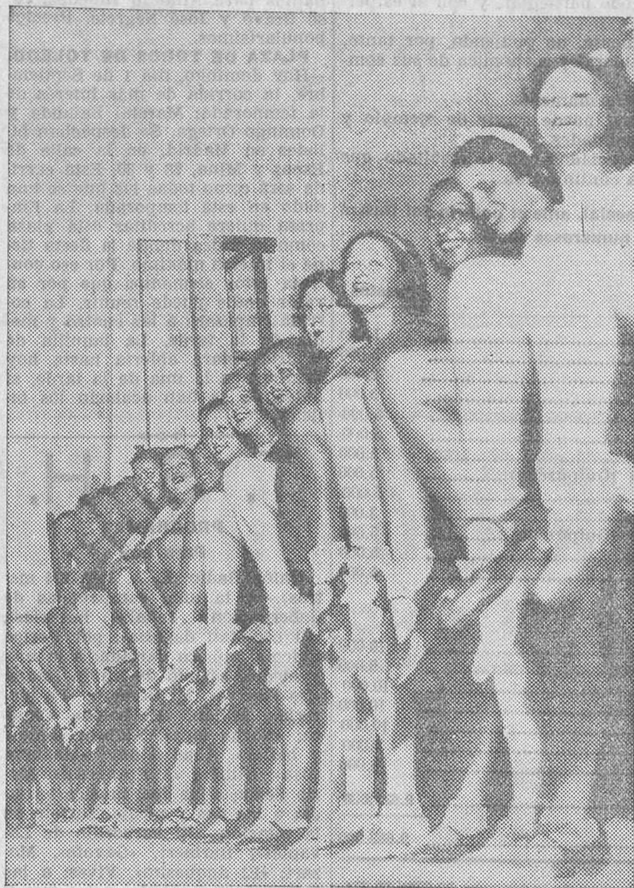
He aquí una maravillosa exposición de piernas de nuestras «girls», y no de «ceras» precisamente

El maestro grita: «¡Boys!» Un empleado repite: «¡Bois!» y el eco multiplica por los pasillos la orden conminatoria: «¡Boys!»... Este ensayo ha perdido un poco