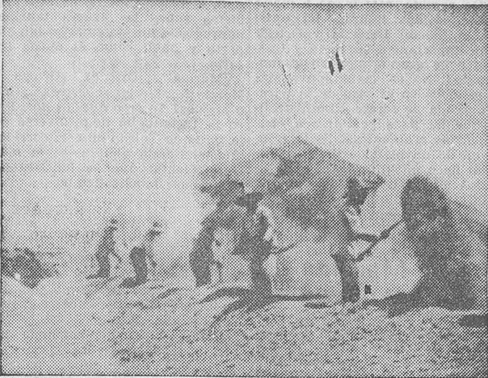
Aventando la parva

so percibió una utilidad de 1.150 pesetas, equivalentes a 2.300 kilos de trigo que había producido con exceso del préstamo.