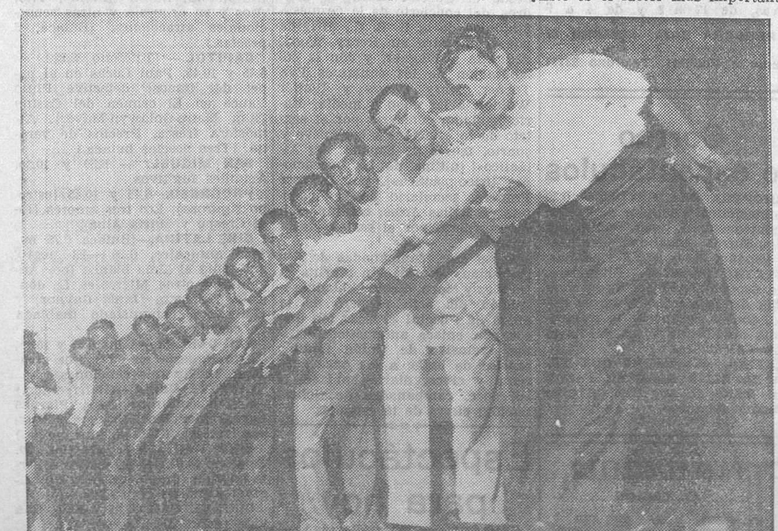
Los «boys» son los proletarios seleccionados en una raza de bailarines

Así lo da a entender una nota oficiosa que publica la Prensa sobre una reunión celebrada en Tarazona para tratar del ambiente hostil existente por la actuación de las entidades concesionarias.