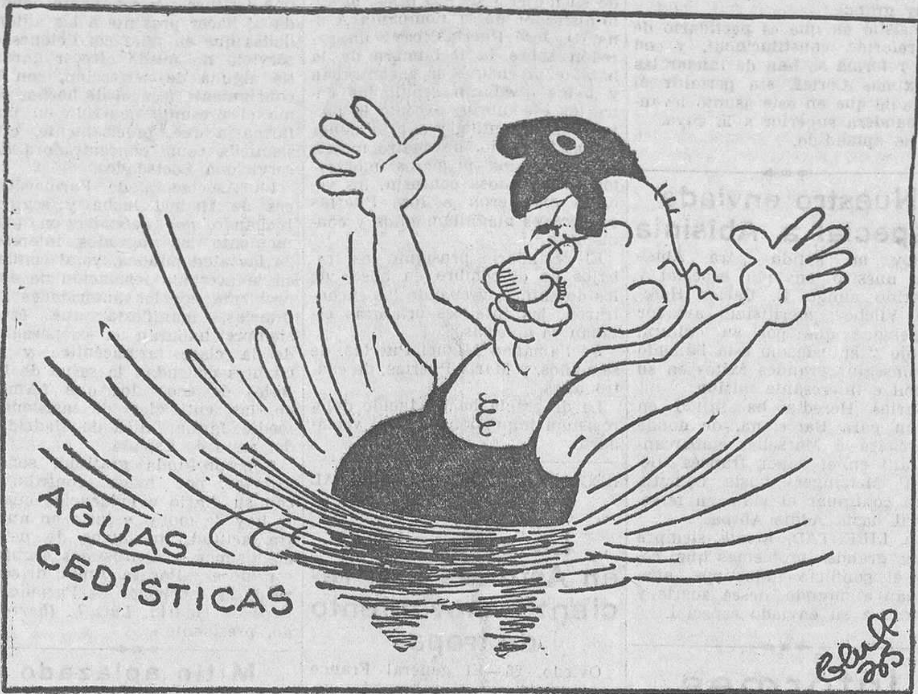
DE LOS SETENTA PARA ARRIBA..., por Bluff