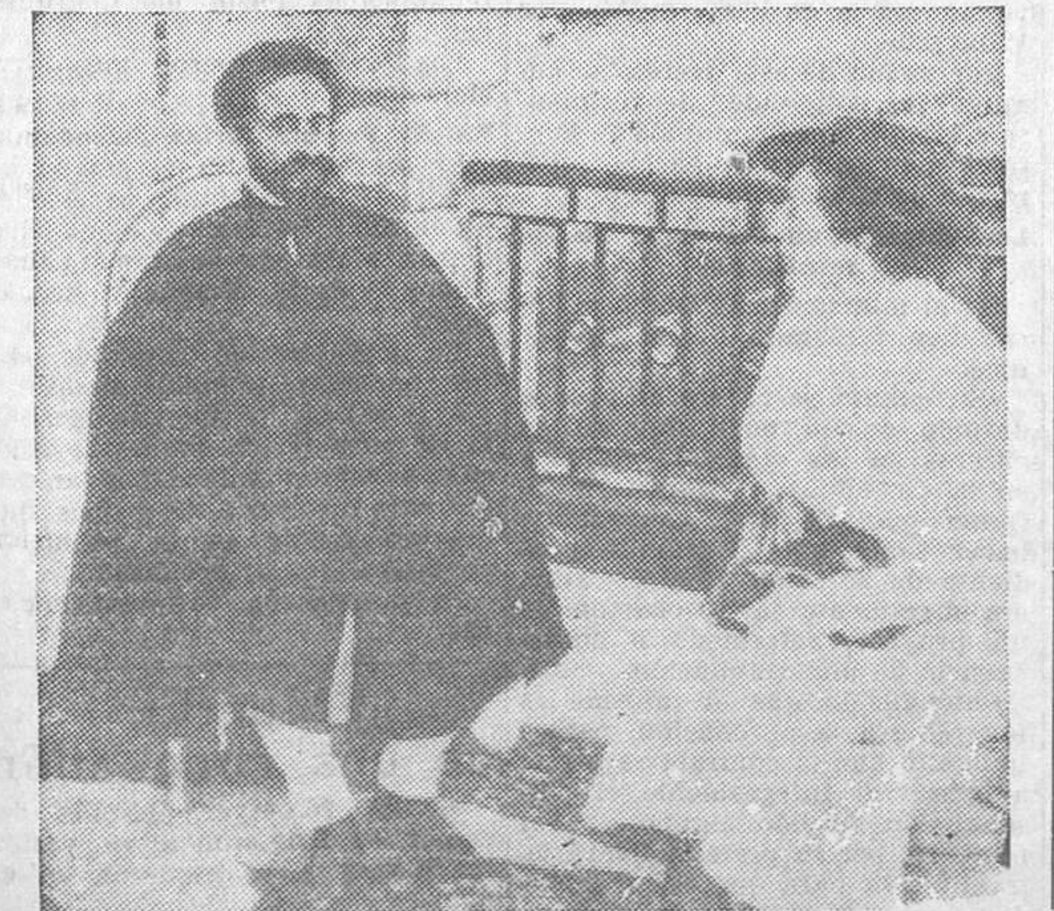
El emperador Selassie, de Abisinia, ha recibido a los periodistas extranjeros varias veces, hablandoles de sus deseos de paz, amenazados por la invasión italiana. En la fotografía aparece haciendo declaraciones a una enviada de Prensa extranjera