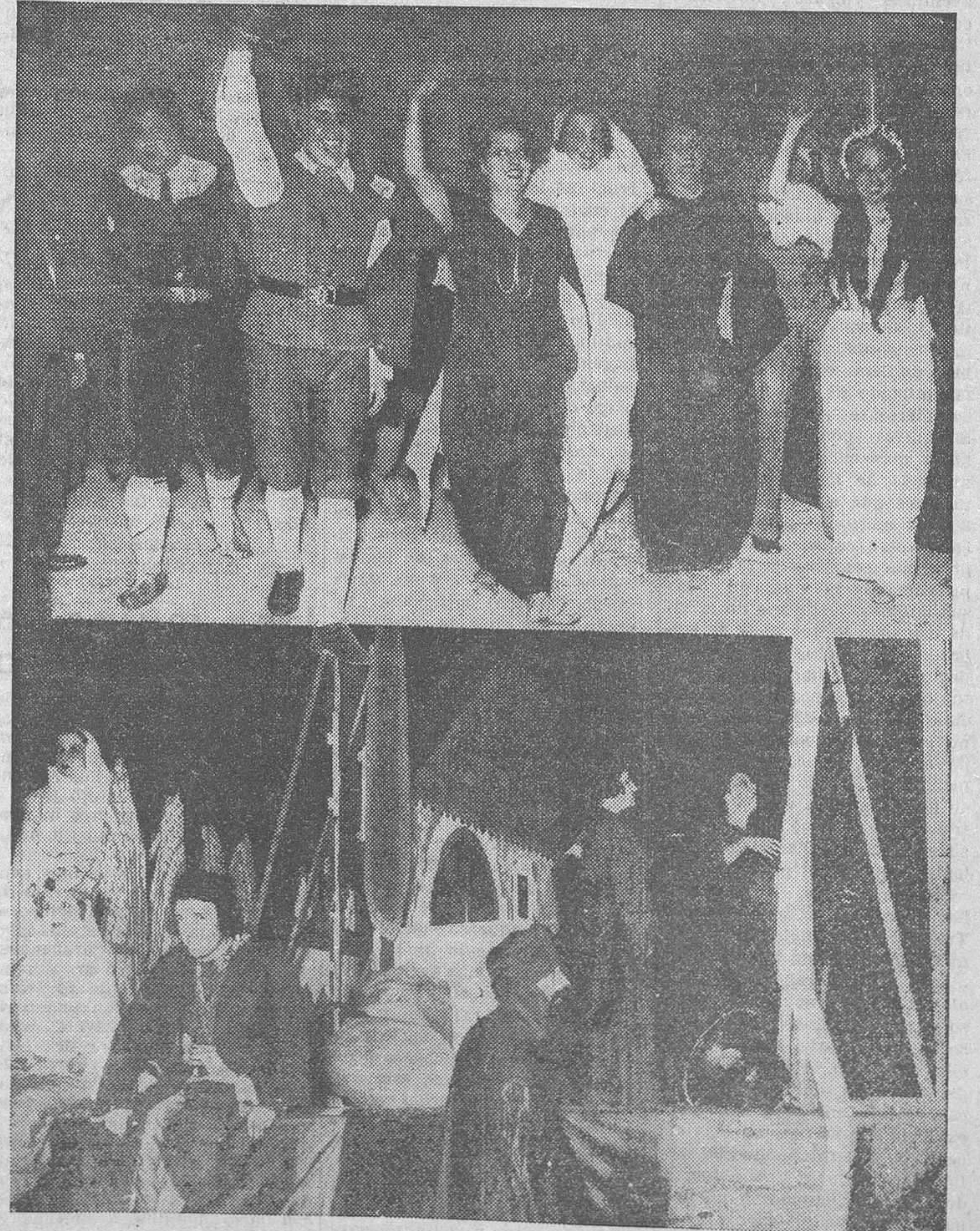
EL TRICENTENARIO DE LA MUERTE DE LOPE DE VEGA.—Los artistas que representaron «La siega», en el momento de llegar a la plaza de las Comendadoras, saludan al pueblo de Madrid, que acudió a esta representación popular. Abajo, un momento de «La siega», celebrada con éxito

Más por encima de sus deseos y maniobras hay una realidad que es preciso atender: el hambre de un millón de trabajadores en toda España, de ochenta y cinco mil obreros sólo en Madrid. El problema de la capital es fácil de aliviar. Bastaría con que el ministerio de Obras públicas concediera una autorización para que varios millares de trabajadores hallasen ocupación. Y por no hacerlo, por no tomarse el ligero trabajo de concederla, hay millares y millares de hogares madrileños donde todos los días falta el pan. Y donde suponemos se sentirá una gratitud sin límites por el genial economista zaragozano D. Manuel Marraco, actual ministro radical de Obras públicas.