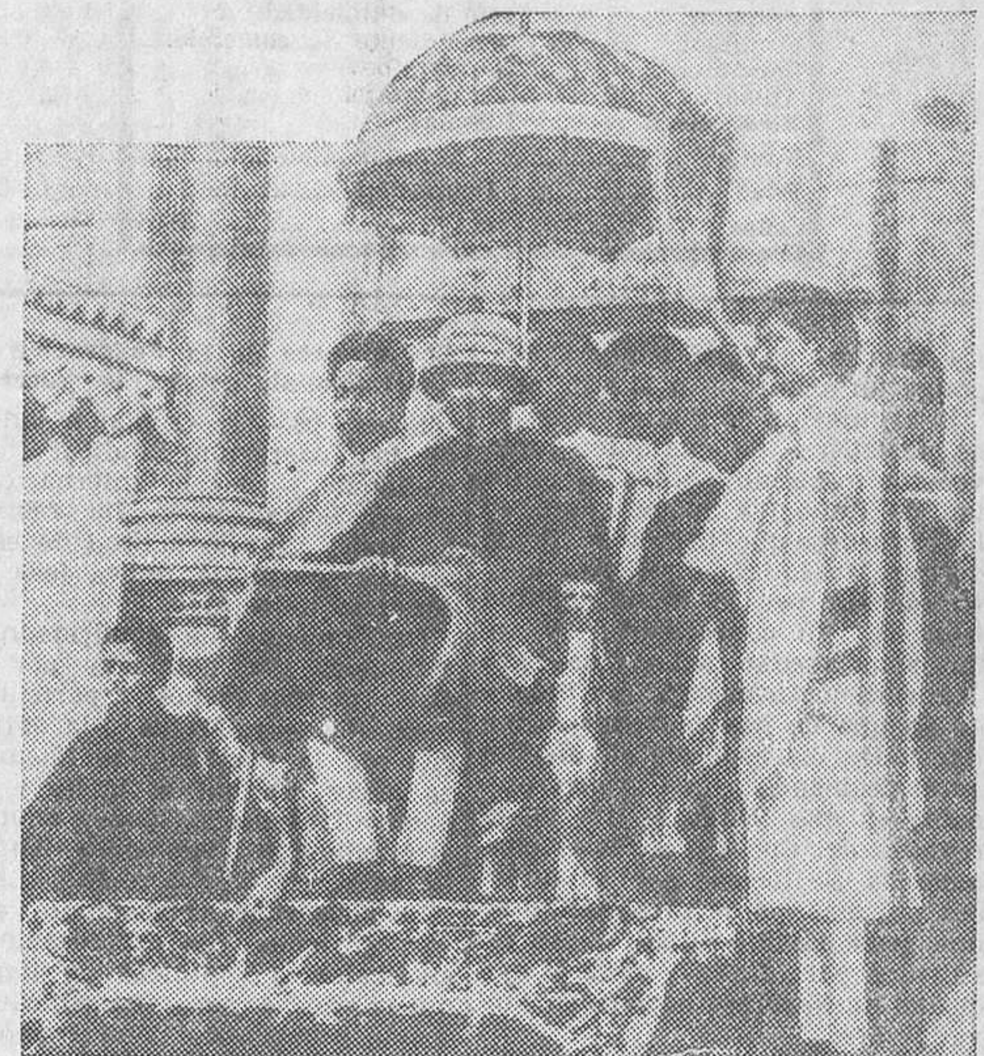
El Negus presenciando el desfile de los «boy-scouts» etíopes

el material de artillería embarcado en Southampton figuran varias piezas anti-aéreas, proyectores y armas defensivas contra ataques aéreos.