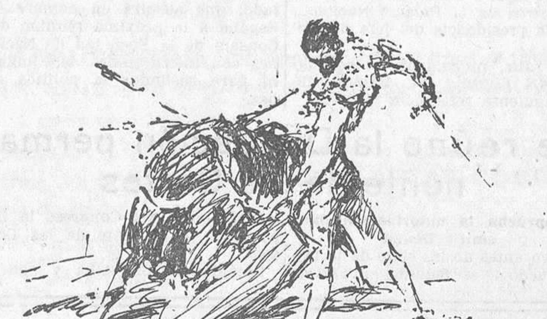
EL DOMINGO EN MADRID.—Morateño en un buen pase natural en el tercer toro

Sexto bis.—Victoriano lo fija con unos lances y luego quite bien. Ortega se hace ovacionar también en un quite.