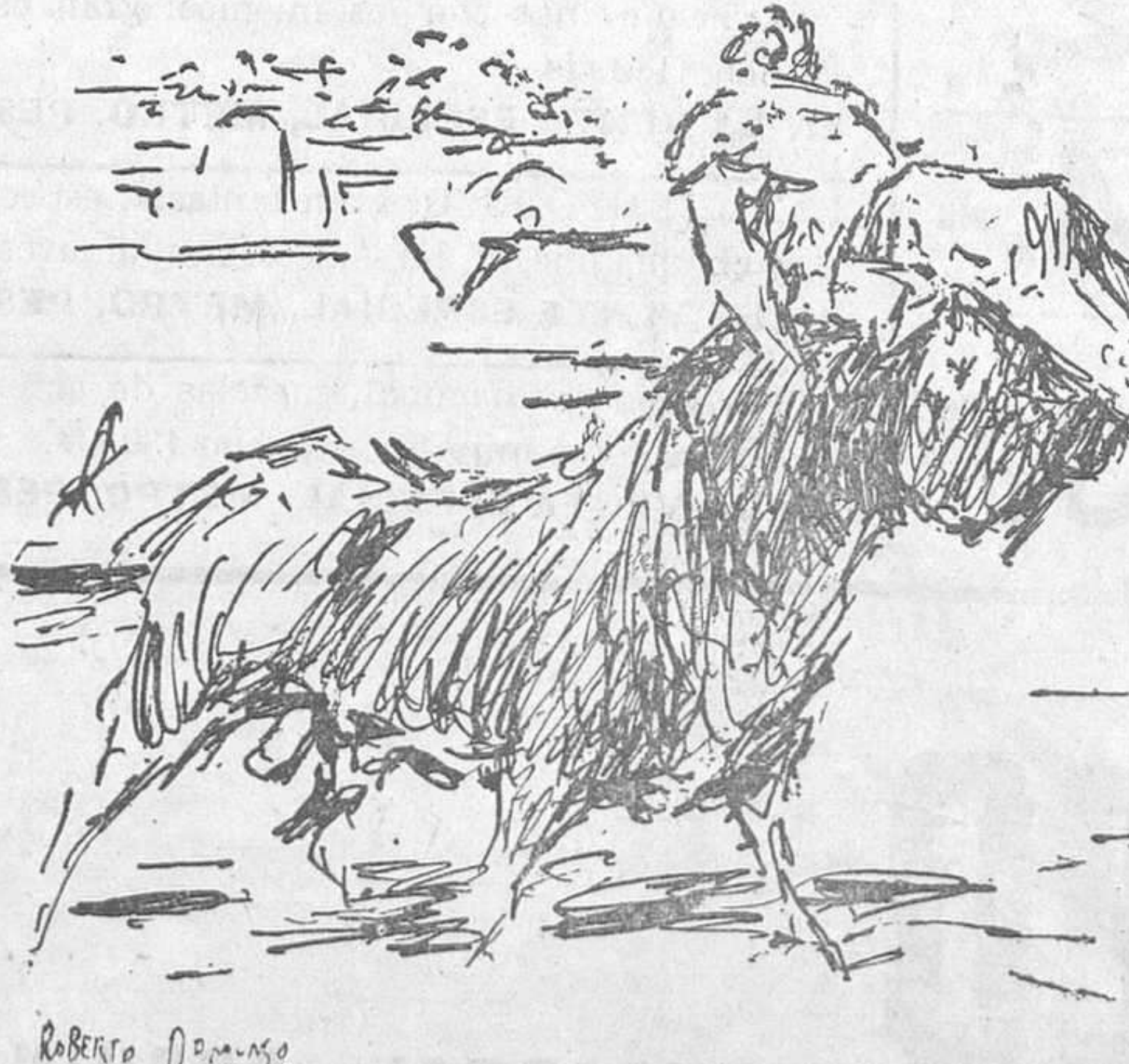
EL DOMINGO EN MADRID.—Cogida del Niño del Barrio en el primer toro. (Apuntes del natural por Roberto Domingo.)