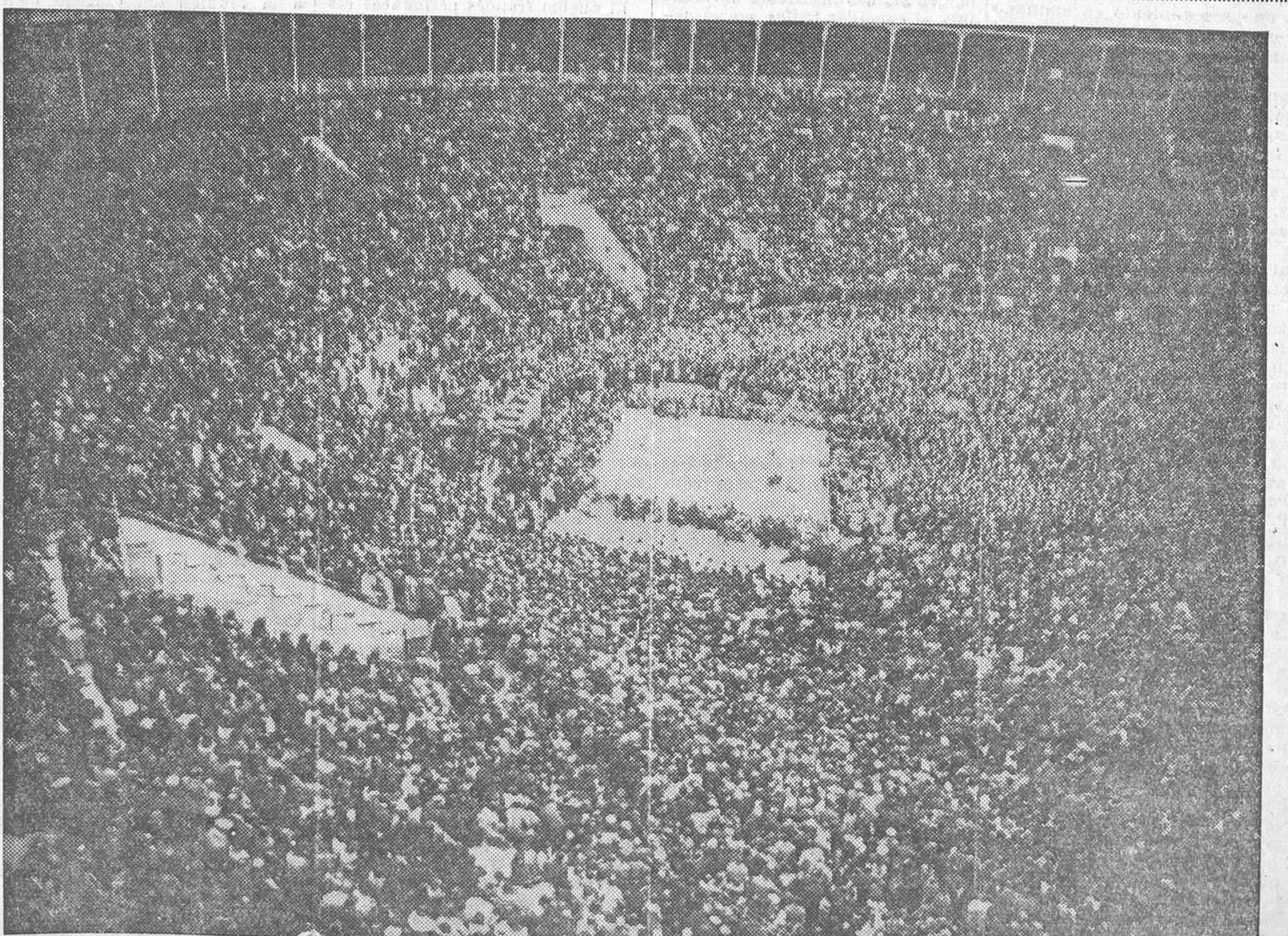
¿Cuántas personas acudieron el domingo al acto grandioso que en honor de la mujer de izquierdas se celebró en la plaza monumental? Es difícil el cálculo. Fueron setenta, ochenta, quizá cien mil personas que exteriorizaron, una vez más, el entusiasmo clamoroso de las multitudes del Frente Popular. Y entre ellas, millares y millares de mujeres. De las mujeres que con sus votos decidieron la contienda el día 16. De las mujeres dispuestas a luchar, como sea, en defensa de la República y de la libertad. El domingo, la plaza monumental, vista desde arriba, parecía el hormiguero humano que puede apreciarse en la fotografía que publicamos