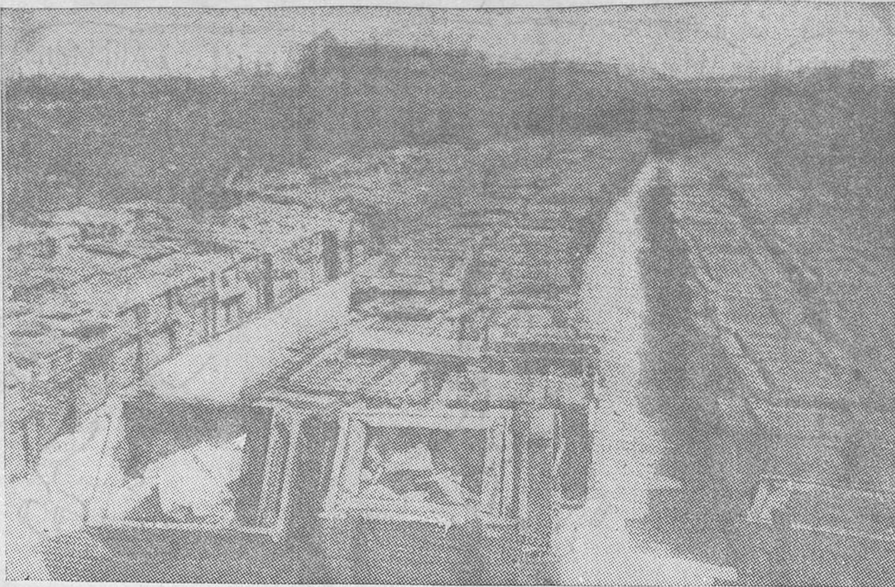
Un aspecto de las trescientas cajas que salieron de Francia con armas y municiones para Río de Janeiro y Buenos Aires, y que al ser abiertas en los muelles de la capital argentina aparecieron llenas de arena y piedras. Según informes de la Policía, parece que las armas y los cartuchos fueron a manos de las tropas del Paraguay

Entretanto, según informaciones de fuente «nazi», se sabe que la disolución de los Cascos de Acero continuará, y la próxima acción será adoptada, según se espera, en Sajonia.