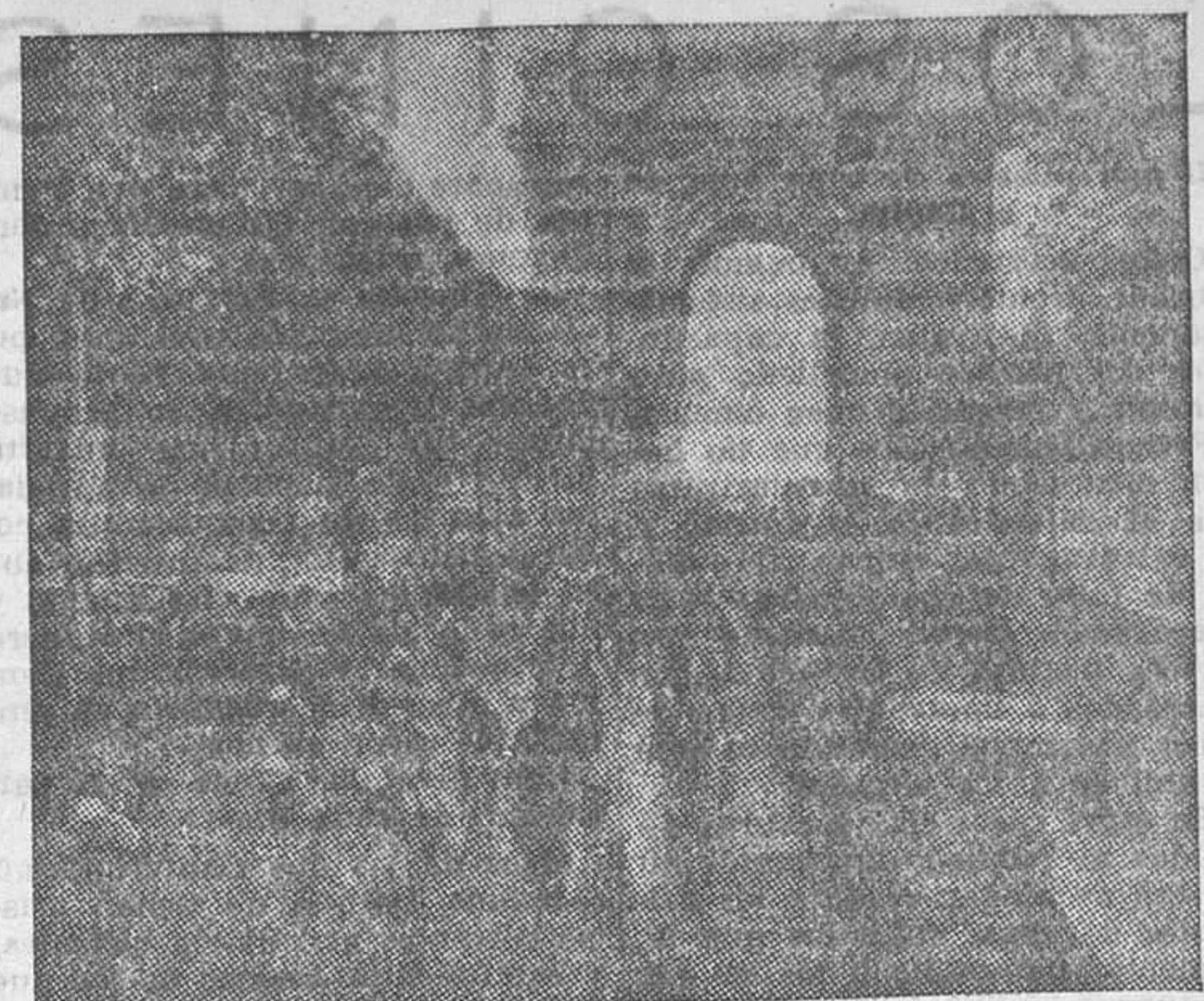
Momento de salir de París los corredores que toman parte en la Vuelta ciclista a Francia

Gerencia de LA LIBERTAD, teléfono núm. 27151