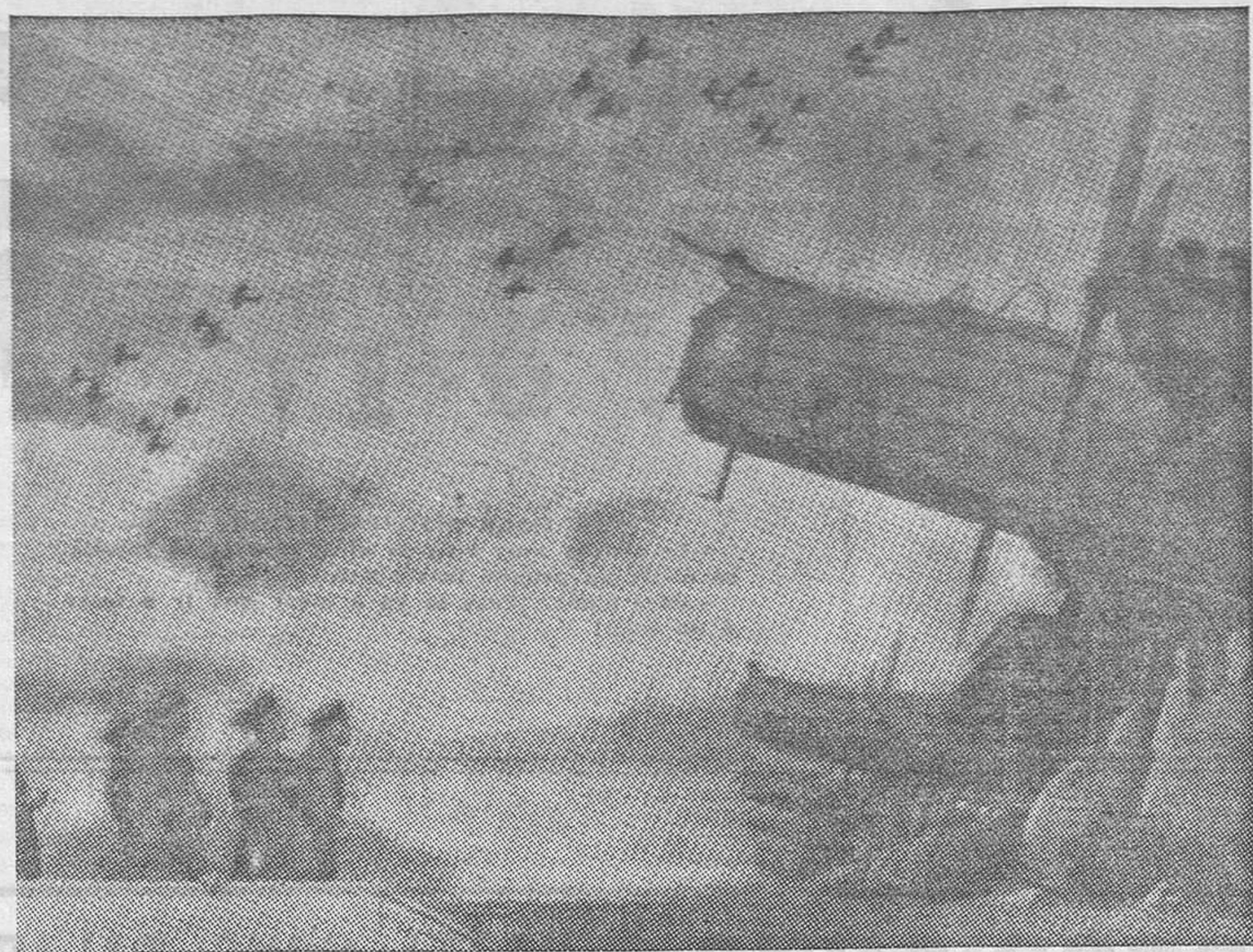
Otro aspecto de la revista de a viación militar celebrada en el aeródromo de Mildenhall (Londres)

Raleigh (Carolina del Norte), 6. El Gobierno federal colabora con las autoridades del Estado en la lucha contra la parálisis infantil.