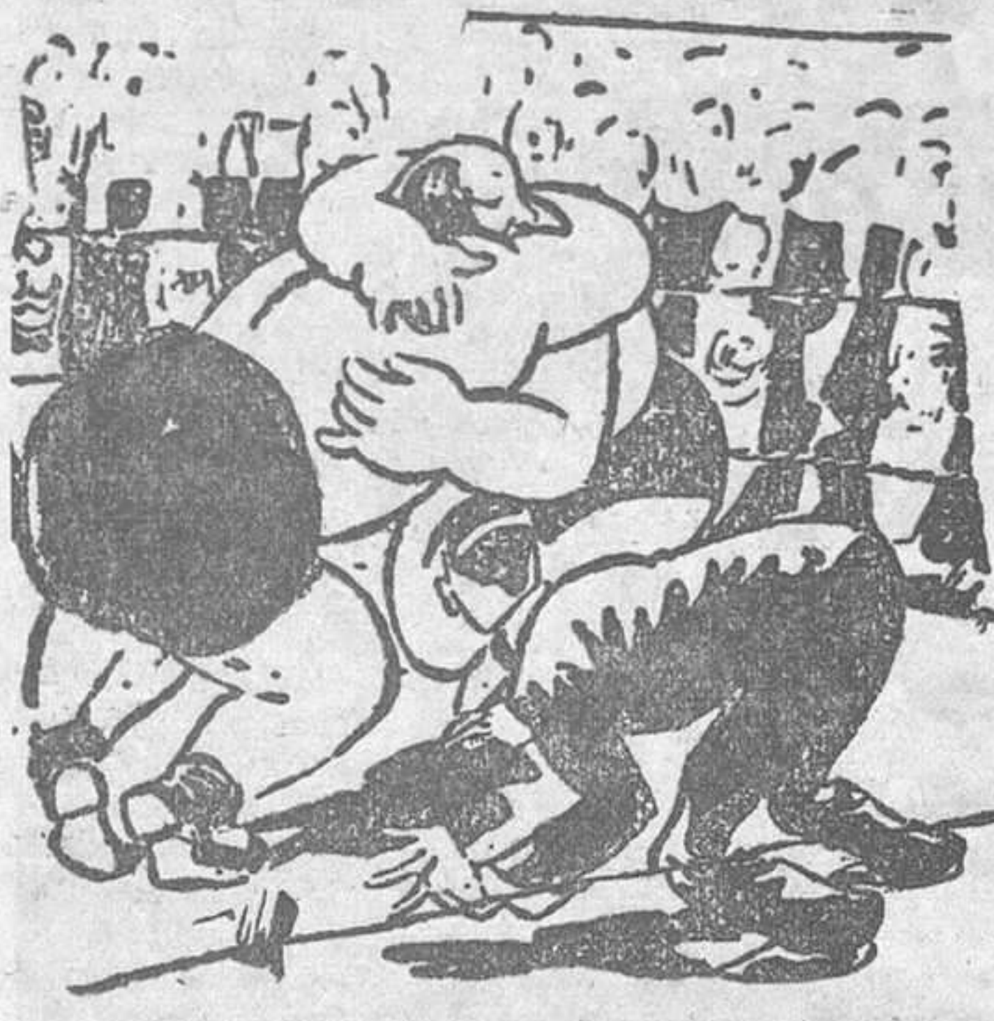
Match nulo, caballeros. ¿Se han dormido? (De «Passing Show», Londres.)