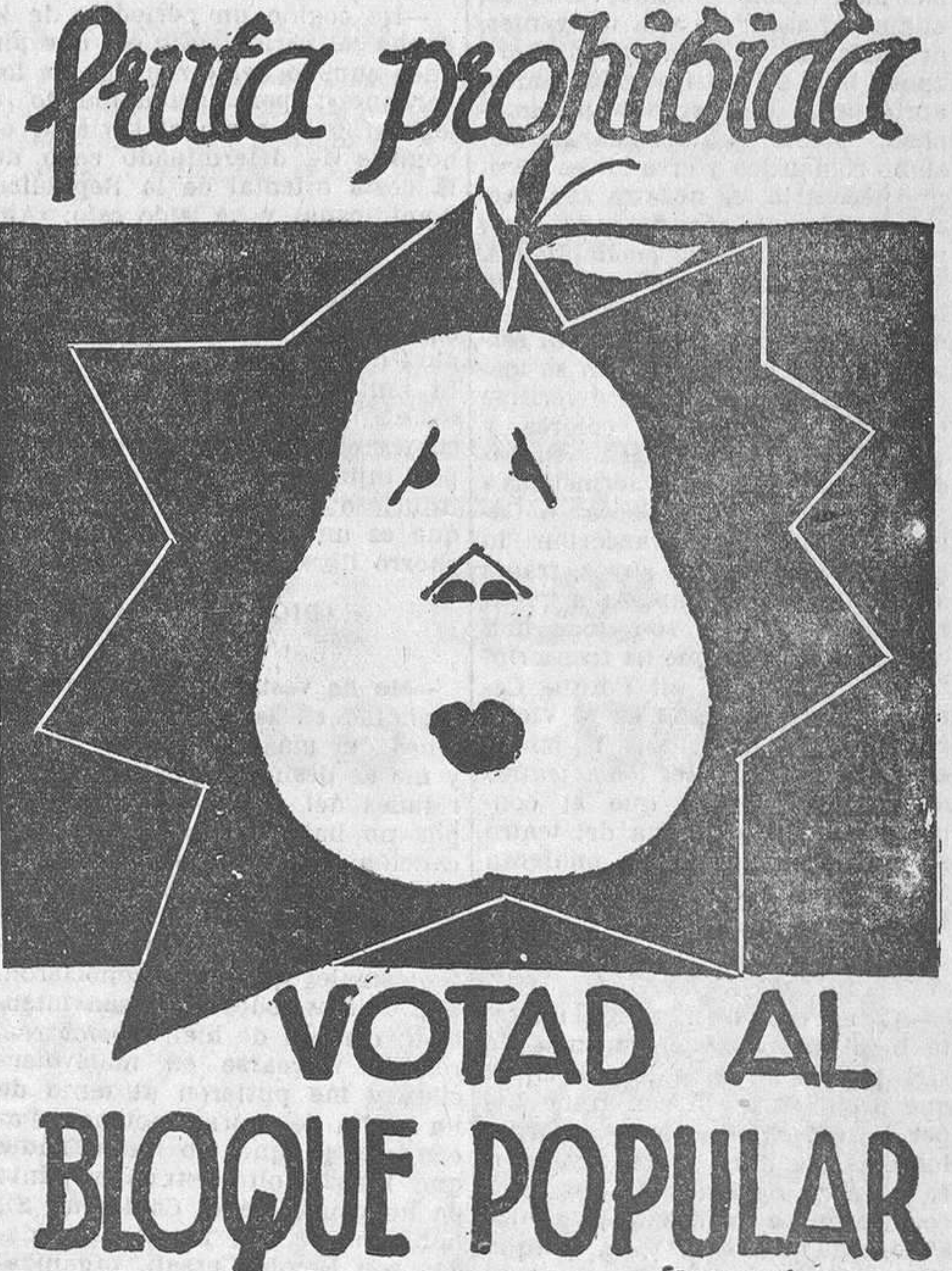
Un gracioso cartel de propaganda electoral que anoche fué fijado en Madrid.

Madrid (provincia).—Dos de Izquierda Republicana, uno de Unión Republicana y tres socialistas.