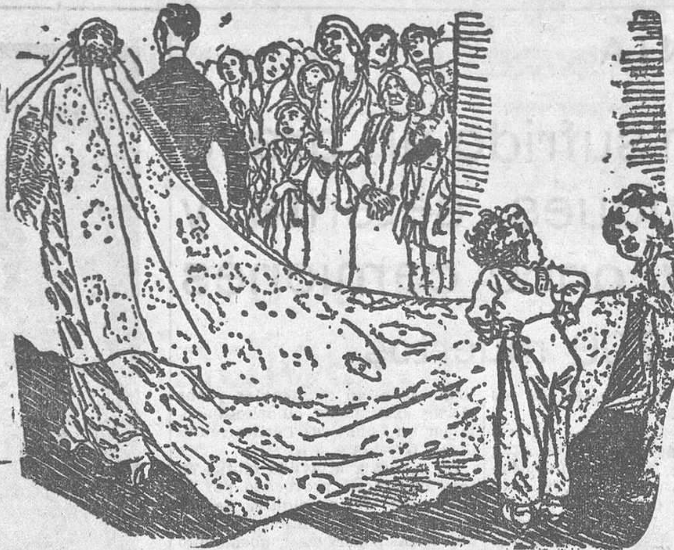
¿No sabes que tu obligación es sostener la cola de la novia? ¿Y quién me sostiene a mí el pantalón? (De «London Opinion», Londres.)