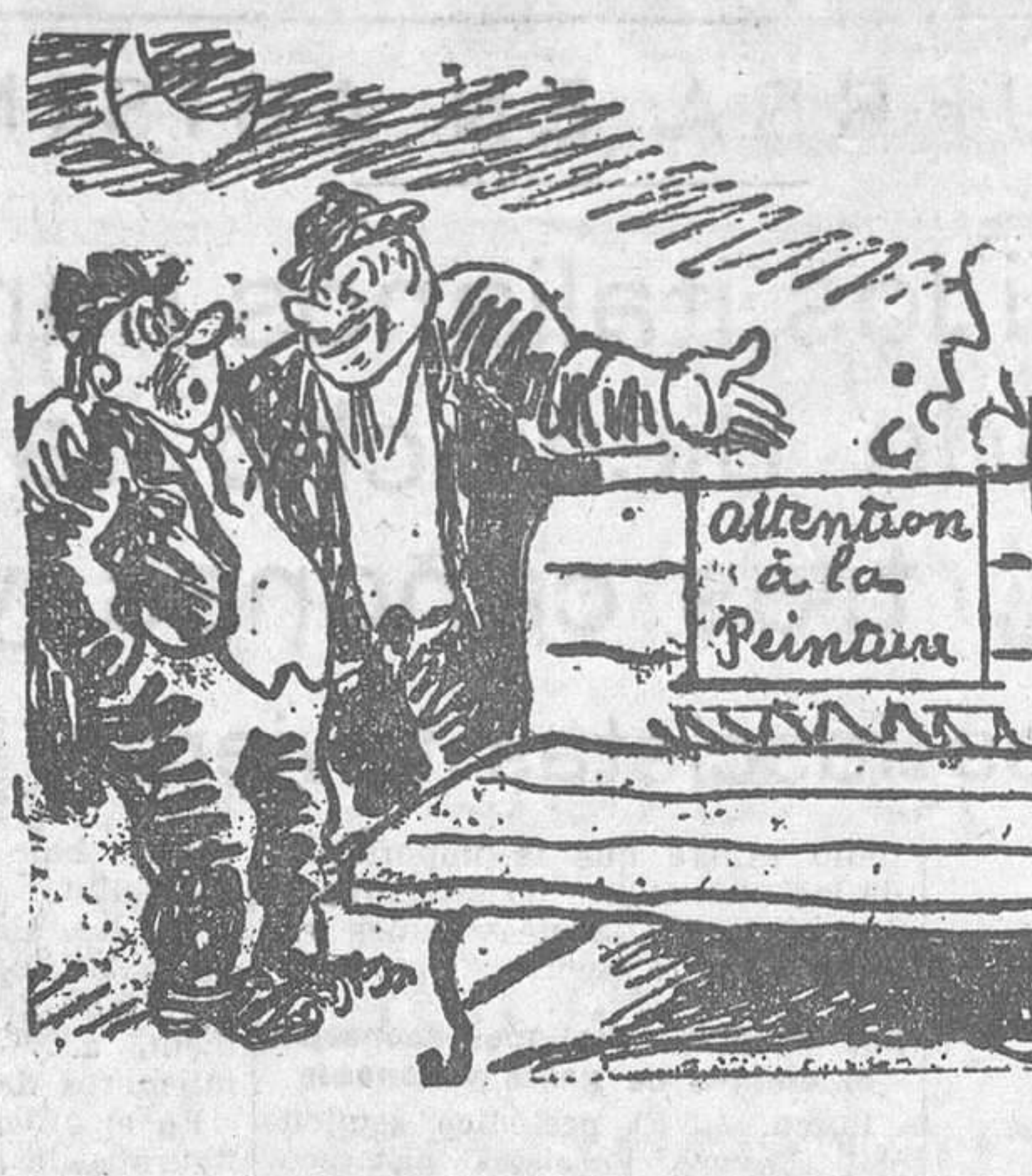
¿Tendrás que darme hospitalidad por esta noche. Están pintando mi casa. (De «Everybody's», Londres.)