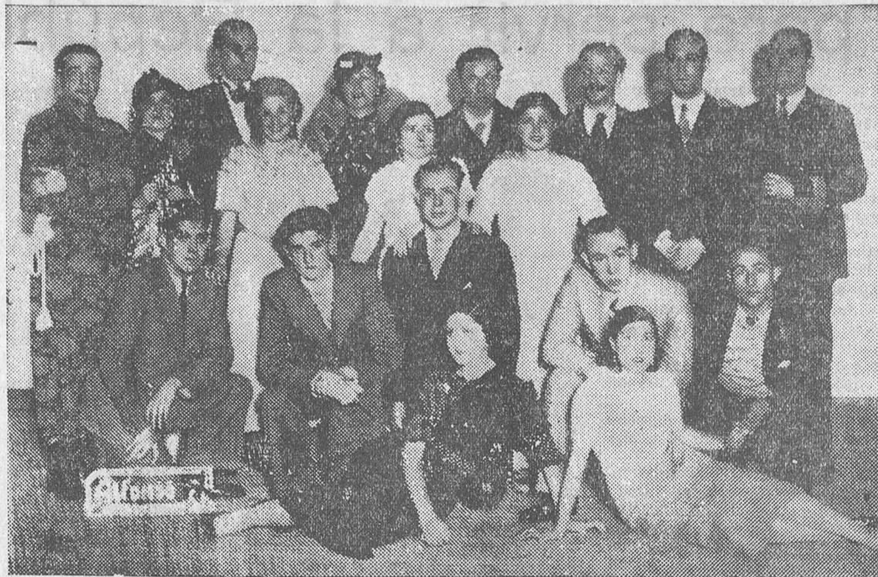
Distinguidos jóvenes de la agrupación El Pinar, que tomaron parte en el festival organizado a beneficio de los niños huérfanos de Asturias