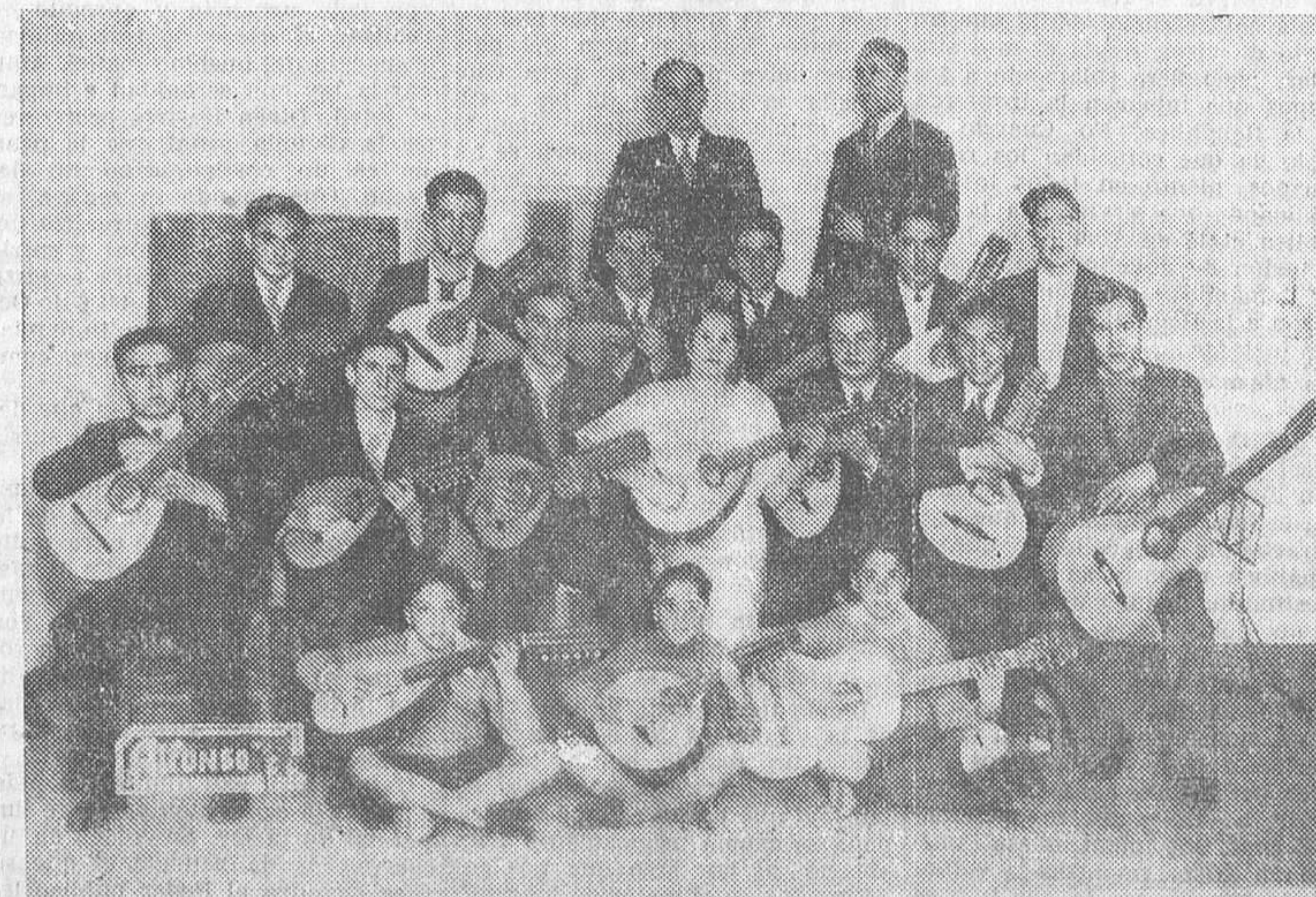
La agrupación musical Marquina, que tomó parte en el festival celebrado en el teatro María Guerrero, a beneficio de los niños huérfanos de Asturias