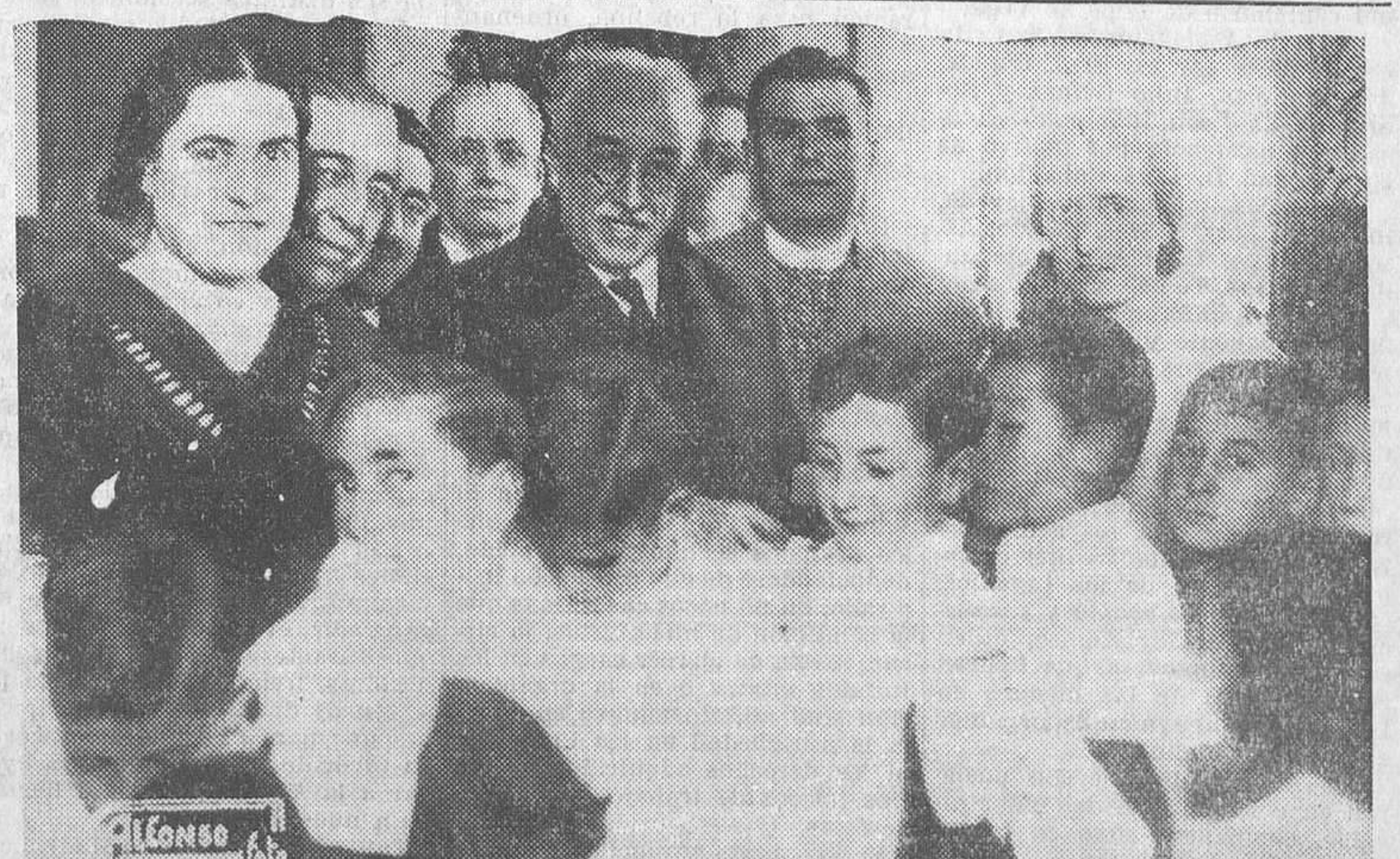
El presidente de la República repartiendo juguetes a los niños del grupo Rosario Acuña